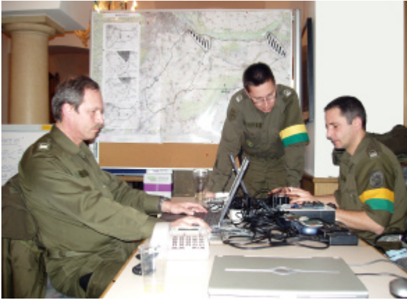
Bild links: Die Fotografen der IPSt (sitzend) mit dem Internetbetreuer bei der Arbeit in der Pressestelle