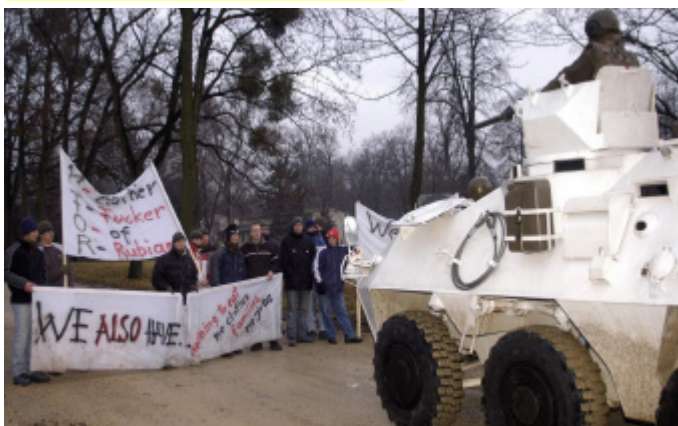
Bild unten: Die Roleplayer aus Spittal lieferten ein realistisches Szenario.

Diesmal standen die Soldaten des Stabsbataillons 7 zwar nicht im Rampenlicht, doch ohne sie wären die Übungsteilnehmer nicht einmal in den Einsatzraum gekommen, hätten auf Verpflegung verzichten müssen, ihre Fahrzeuge wären ohne Sprit liegen geblieben, die Munitionsversorgung wäre ausgefallen und Fahrzeugreparaturen hätten nicht erledigt werden können. Oberst Mag. Bernhard Meurers kann zufrieden mit seinen Soldaten sein, denn meist fallen in der Versorgung Probleme negativ auf, während die Erfolge nicht erwähnt werden.