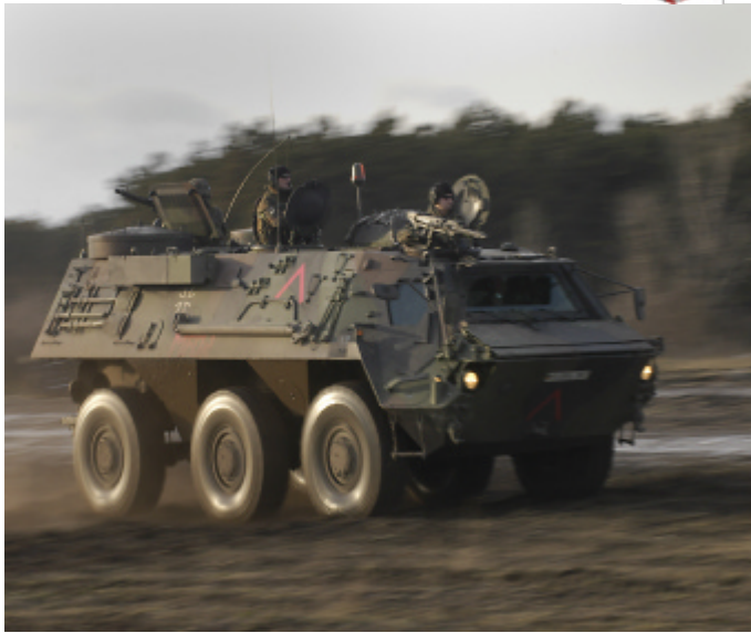
Bild oben: Ein Radpanzer "Fuchs" der deutschen Bundeswehr beim Bezug einer "blocking position".