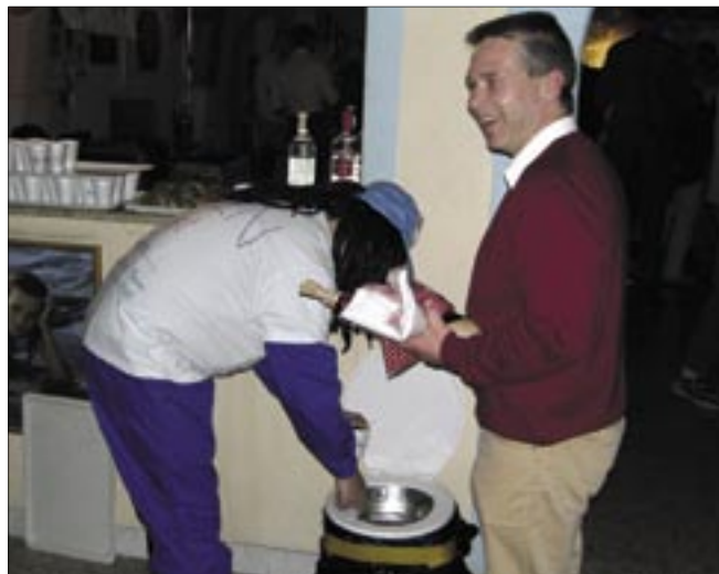
Der Jubilar mit dem CO beim aushändigen des Begrüßungscocktail aus einer dezent nachgebildeten Toiletschüssel

Golanis. „Historisch“ auch die Geschenke, mit denen die Gäste den Jubilar überraschten.