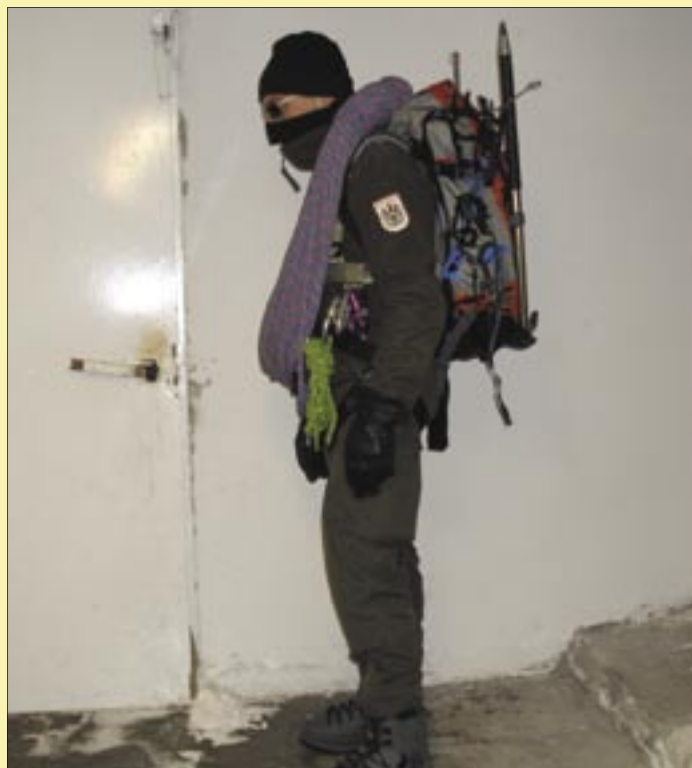
Soldat für Fels - Eistour

Gott sei Dank hat man mittlerweile in der oberen Führungsebene erkannt, dass die Alpinausbildung und die Ausrüstung für