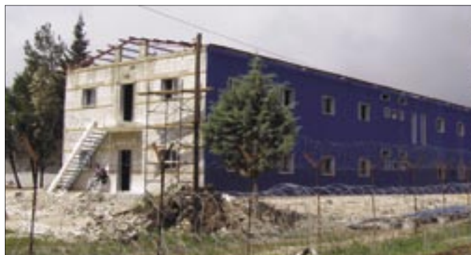
Neubau und zugleich Unterkunft für mehr als 60 Soldaten