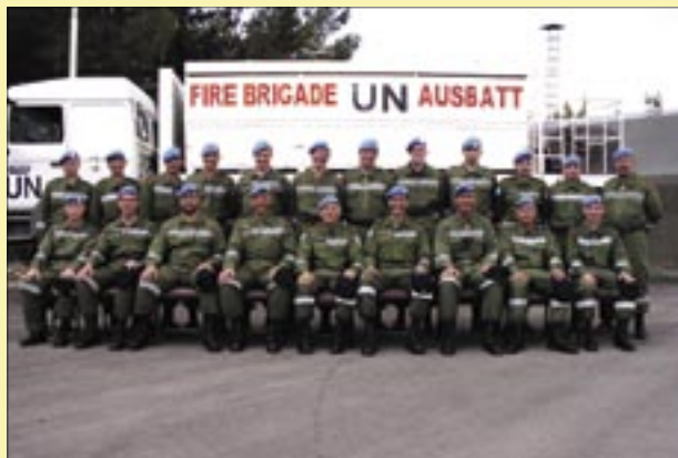
Fire Brigade Camp FAOUAR

Zum Abschluss kann ich nur bitten: „ Möge uns Feuerwehrmännern des AUSBATT der heilige Florian einen realen Brandfall für die weitere Zukunft ersparen! “