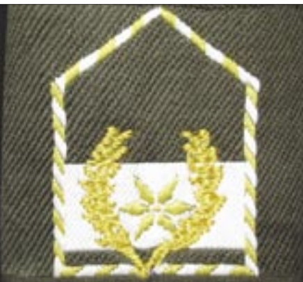
Senior Warrent Officer