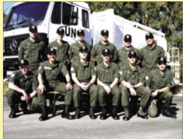
Feuerwehr Team der 2. Kompanie auf Stützpunkt 27

AUSBATT, mehr oder weniger Laien in Bezug auf Brandeinsätze und technische Hilfeleistung. Klar, jeder hat schon ein- oder mehrere Male einen Feuerlöscher oder Ähnliches in der Hand gehabt, aber das war es auch schon.