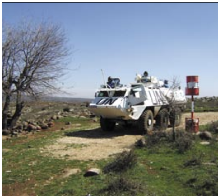
Beobachtung der „Grazing Area“

äußerst anspruchsvoll, aber vielseitig und interessant.