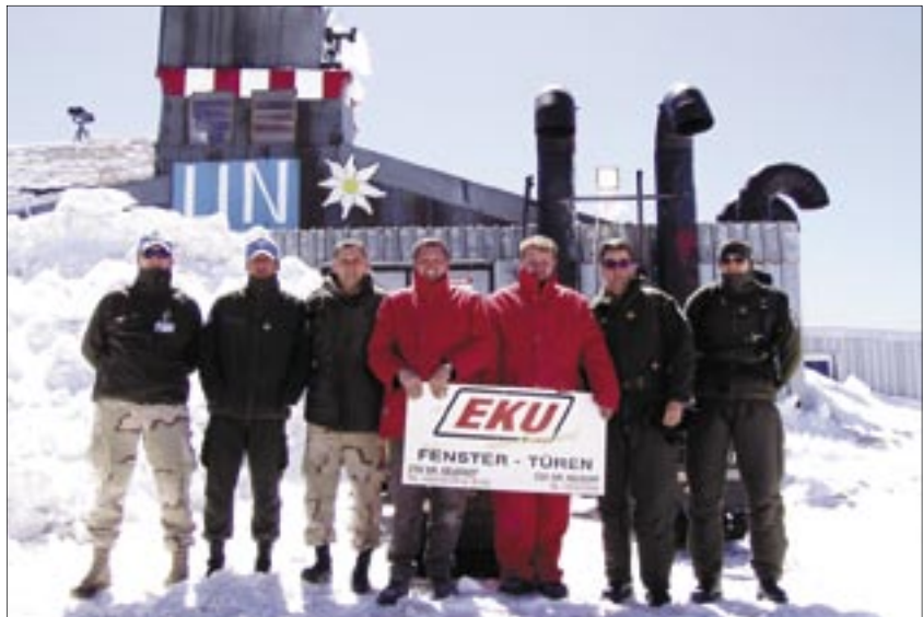
Eine Herausforderung für die EKU Fenster

men und verfügen über 5 Wärme-Dämmkammern. Sie sind leicht 3-dimensional justierbar, sodass dies auch von den Stützpunktbesatzungen durchgeführt werden kann. Diese Fenster sind somit standhaft gegen Verziehen, hervorgerufen durch große Temperaturunterschiede bzw. Windkräfte, denn hier oben pfeift der Wind nicht selten mit Spitzengeschwindigkeiten zwischen 130 – 200 Km/h.