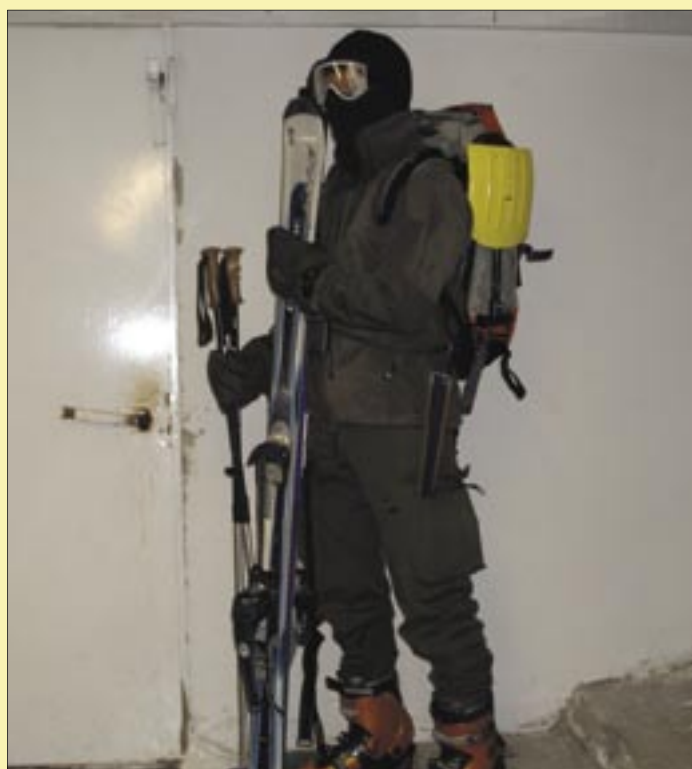
Soldat für Schitour

die am Mt. Hermon Dienst versehenen Soldaten sehr wichtig und notwendig ist.