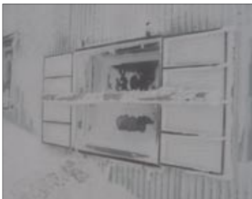
Bestandene Bewährungsprobe der Fenster, in Eis und Schnee

Diese Spezialfenster haben einen doppelt verstärkten Stahlrah-