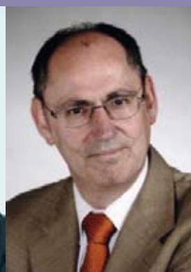
GenMjr Mag. Oschep seit 2010