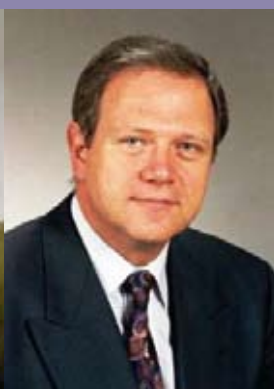
HR Mag. Deutsch 1998-2007