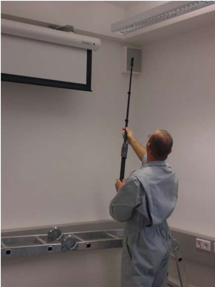
Zum Schutz vor Lauschangriffen werden sensible Objekte und Institutionen mit technischen Mitteln durch Mitarbeiter des Amtes überprüft (Bild).

auch im militärischen Bereich führen können, werden zukünftig jeden mit kinetischen Mitteln ausgetragenen Konflikt begleiten. Sogar ein ausschließlich im Cyberspace geführter Konflikt ist mittlerweile denkbar. Der Schutz der eigenen strategischen IKT-Netzwerke vor solchen Attacken stellt für entsprechend entwickelte Staaten nicht nur eine technische und organisatorische Herausforderung dar, sondern auch eine rechtliche, da der Angreifer meist nicht identifizierbar oder einer bestimmten Gruppierung bzw. einem Staat zuordenbar ist. Computer Emergency Response Teams (CERT), auch ausgestattet mit entsprechenden rechtlichen Befugnissen, sind daher eine zwingende Konsequenz, um diesen Bedrohungen mit Erfolg zu begegnen. Es gilt, die relevanten Daten zu sammeln, die Bedrohungen, Schwachstellen und möglichen Schäden laufend zu analysieren und in einem Lagezentrum darzustellen. Eine Zusammenarbeit oder zumindest ein regelmäßiger Erfahrungsaustausch zwischen den staatlichen und zivilen IKT-Sicherheitsorganisationen ist aufgrund der (weltweiten) Vernetzungen unabdingbar. Beispielsweise kann eine Schadsoftware, die am „anderen Ende der