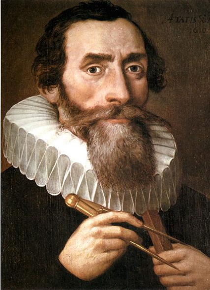
Johannes Kepler, Kopie eines verlorengegangenen Originals von 1610 im Benediktinerkloster in Kremsmünster

Jesuit, und Johannes Kepler selbst hatte sich im Tübinger Stift geweigert, die sogenannte Konkordienformel (ein Ideologie-Konzept der Evangelisch-Lutherischen Kirche, das sich in erster Linie gegen die Anhänger Calvins und Zwinglis richtete) zu unterschreiben. Zwar wurde derartiges eigentlich nur von einem lutherischen Geistlichen verlangt, aber genau das hatte Kepler eigentlich immer werden wollen.