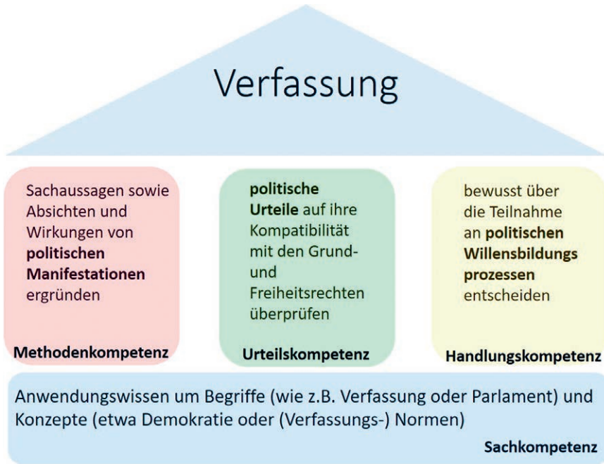
Abb. 1: Exemplarische Anknüpfungspunkte zum Thema »Verfassung« im Österreichischen Kompetenzmodell für Politische Bildung

Grundlegend dafür ist auch das Wissen zu Verfassungsprinzipien und zu in der Verfassung festgelegten politischen Strukturen und Ordnungen, »welche Handlungsspielräume, Zuständigkeiten und Abläufe bei Auseinandersetzungen festlegen« (ebda, S. 9). Dies spiegelt sich wider in den verschiedenen Dimensionen politischen Denkens und Handelns (vgl. Abb. 1): Das im Bereich der Politischen Sachkompetenz erworbene und stetig weiterentwickelte Wissen um Begriffe (wie z. B. Verfassung oder Parlament) und Konzepte (etwa Demokratie oder [Verfassungs-]Normen) kommt in den prozeduralen Kompetenzbereichen zur Anwendung, indem z. B. erst damit Sachaussagen sowie Absichten und Wirkungen von politischen Manifestationen erkannt werden können (Politikbezogene Methodenkompetenz) oder politische Urteile auf ihre Kompatibilität mit den Grund- und Freiheitsrechten überprüft werden können (Politische Urteilskompetenz) oder bewusst über die Teilnahme an politischen Willensbildungsprozessen entschieden werden kann (Politische Handlungskompetenz).