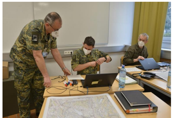
Stabsarbeit – stets unter Beachtung von COVID-Schutzmaßnahmen