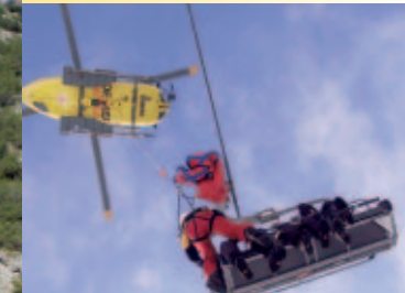
Aktuellste Rettungsaktionen - Verletztenbergung von einem Sessellift Breathtaking rescue demonstration - recovery of injured from a chairlift