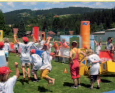
Wer wird das Bundes-Siegerteam? Große Siegerehrung am Freitag Nachmittag! Which team will be national champion? Award ceremony on Friday afternoon!

Die „Kinder-Sicherheitsolympiade“ ist ein Teamwettbewerb für Volksschüler der 4. Klassen. Es stehen bei jeder Veranstaltung mehrere Klassenbewerbe und Spiele auf dem Programm, in deren Rahmen die Kinder nicht nur ihr vorhandenes Sicherheitswissen testen, sondern auch ihre Geschicklichkeit unter Beweis stellen können. Im Vordergrund steht aber nicht der Wettkampfgedanke, sondern die große Chance, durch Spiel und Spaß bewusst Selbstschutz zu lernen.