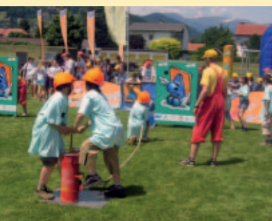
Sicherheit spielend erlernt - Teilnehmer der Kinder-Olympiade bei der Lösch-Station. Learning safety through games – participants in the children's olympiad as fire-fighters