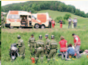
Immer und überall - Rotes Kreuz und Feuerwehr im Dauereinsatz Always and everywhere - Red Cross and Fire Brigade in permanent action