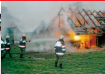
Spektakuläre Löscheinsätze bei der Leistungsschau Spectacular fire fighting demonstrations during the performance show