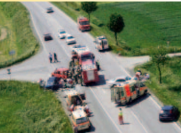
Notruf-Nummern: 122/133/144/112 Feuerwehr/Polizei/Rettung/Euronotruf Emergency numbers: 122/133/144/112 Fire Brigade/ Police/Ambulance/ Euro emergency