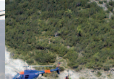
Hubschrauber des Innenministeriums im Alpeinsatz Helicopter of the Federal Ministry of the Interior on alpine rescue mission