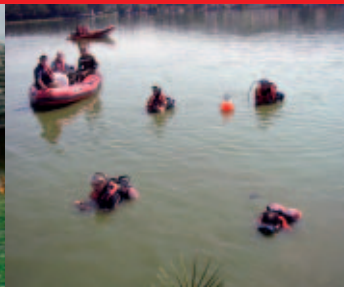
Spezialisten der Wasser-Rettung und der Feuerwehr zeigen Ihr Können Life savers and fire brigades demonstrate their ability