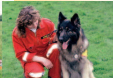
Spektakuläre Einsätze der Rettungshundebrigade Spectacular demonstrations by the dog rescue brigade