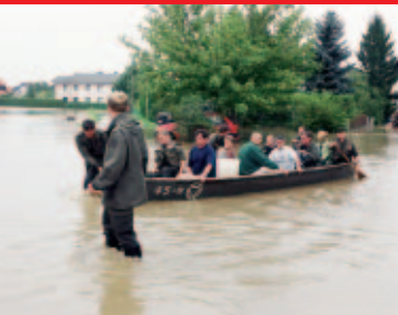
Schutz und Hilfe durch das Österreichische Bundesheer Protection and assistance by the Austrian Army