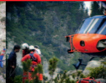
Zusammenarbeit von Bergrettung und Flugrettung Integrated rescue demonstration by mountain and air rescue teams