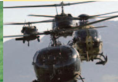
Flugrettungseinsätze mit den verschiedensten Einsatz-HS aus Österreich und den Nachbarländern Air rescue operations with rescue helicopters from Austria and neighbouring countries