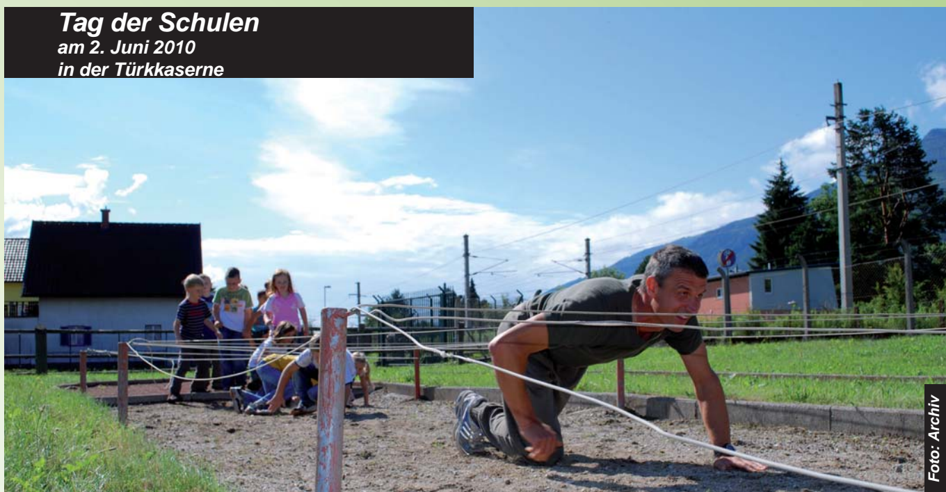
Tag der Schulen am 2. Juni 2010 in der Türkkaserne