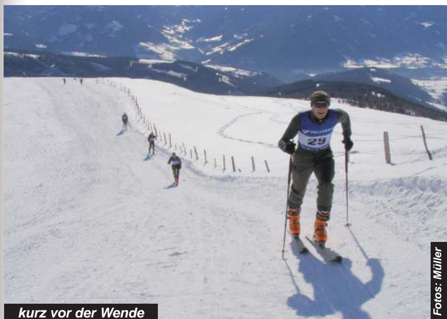
kurz vor der Wende