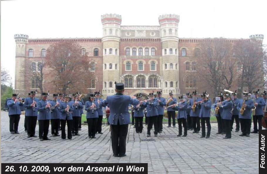
26. 10. 2009, vor dem Arsenal in Wien