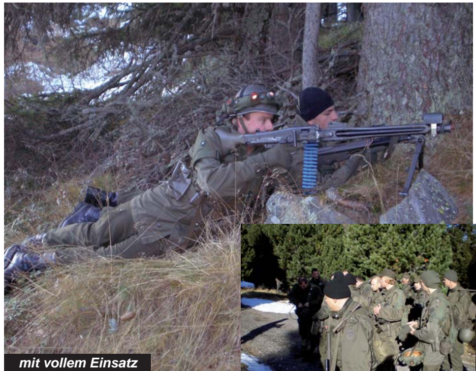
mit vollem Einsatz

Durch die Übungsphase im Flachgau wurde das am Truppenübungsplatz Aufgefrischte und Neuerlernte in die Praxis umgesetzt. Großräumig in den Gebieten des Haunsberg, der Kaiserbuche, des Irrsberg und rund um Zellhof wurde das Bataillon eingesetzt. Im Rahmen eines Medientages zeigten die Miliz-Soldaten am 26. November 2009 die militärischen Maßnahmen gegen Sabotageaktionen und Terroranschläge.