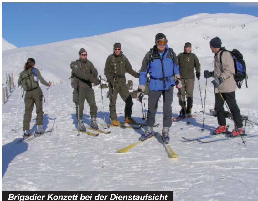
Brigadier Konzett bei der Dienstaufsicht