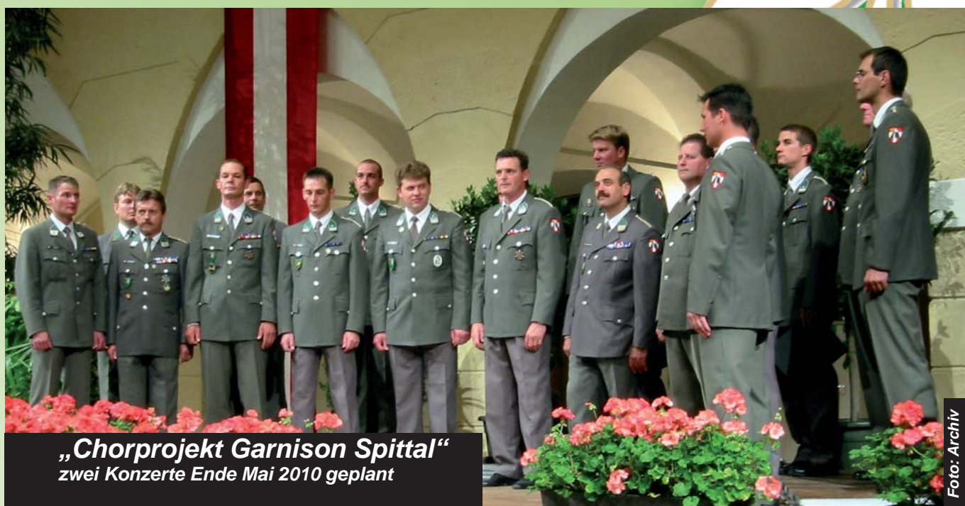
„Chorprojekt Garnison Spittal“ zwei Konzerte Ende Mai 2010 geplant