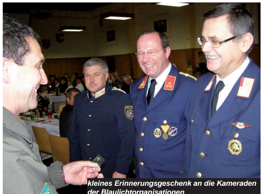
kleines Erinnerungsgeschenk an die Kameraden der Blaulichtorganisationen