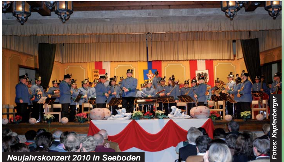
Neujahrskonzert 2010 in Seeboden