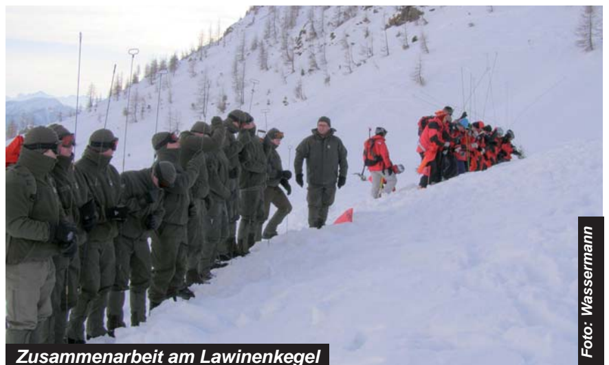
Zusammenarbeit am Lawinenkegel

Am 22.Jänner fand dann die gemeinsame Übung mit der