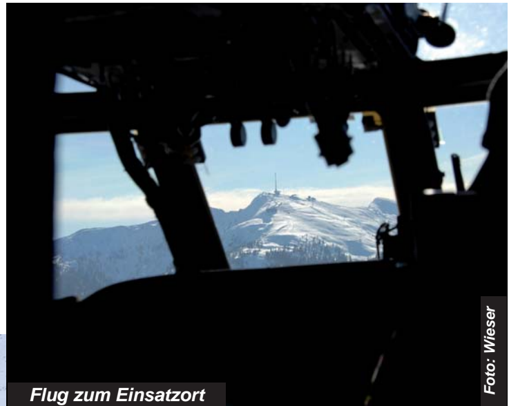
Flug zum Einsatzort

mann Harald Blaßnig auch durchgeführt. Geübt wurden die Alarmierung, die Formierung, die Verlegung zum Einsatzort und die Organisation auf einem Lawinenkegel.