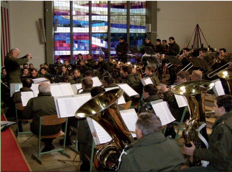
Weihnachtskonzert der Militärmusik Kärnten in der Stadtpfarrkirche

Viele Kadersoldaten und ehemalige Angehörige des Jägerbataillons 26 folgten der Einladung zur heurigen Weihnachtsfeier- schon traditionell- in die Türkkaserne, um für einige Stunden Stress, Hektik und Rummel in der Vorweihnachtszeit zu vergessen.