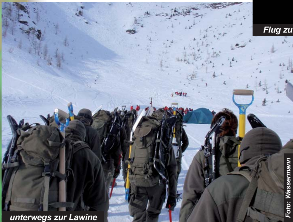
unterwegs zur Lawine