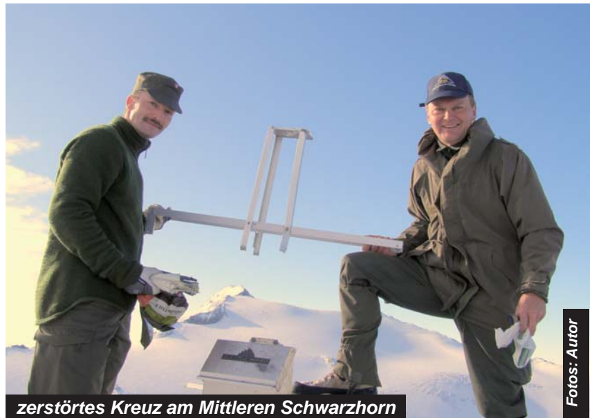
zerstörtes Kreuz am Mittleren Schwarzhorn

freierer Schnee. Entlang des Speichersees gelangten wir zur Abzweigung ins Kleinellendtal auf 1916 Meter Seehöhe. Dort entschlossen wir uns wegen der Schneehöhe entlang des Höhenrückens über den Hohen First und parallel zum Eisenriegel in die Scharte zwischen Südlichen und Mittleren Schwarzhorn aufzusteigen. Weglos und immer angelehnt an die Abhänge des Eisentales erreichten die „Seven Summitter“ über steiles Blockgelände nach leichter Kletterei den Gipfel. Leider war das Gipfelkreuz durch Sturm oder Blitzschlag