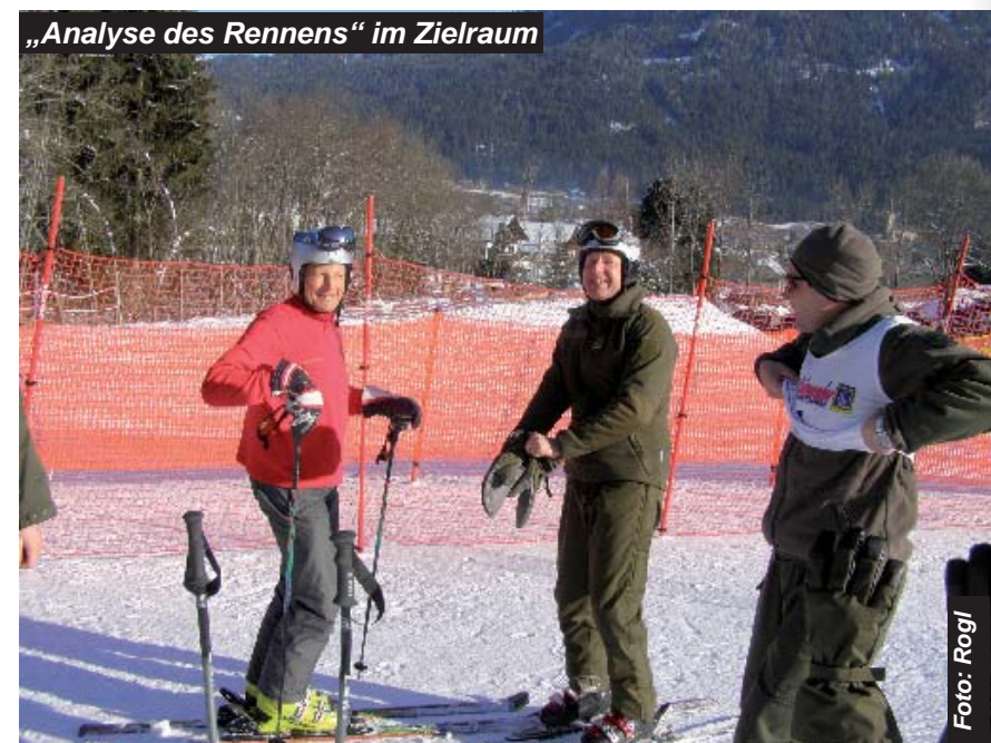
„Analyse des Rennens“ im Zielraum

Der zweite Bewerb das Schibergsteigen ging am Donnerstag, dem 21. Jänner 2010, über die Bühne. Organisiert durch die 2. Jägerkompanie galt es, von der Frido Kordonhütte