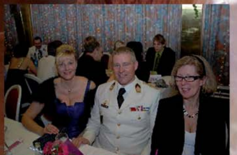
Impressionen vom Ballgeschehen