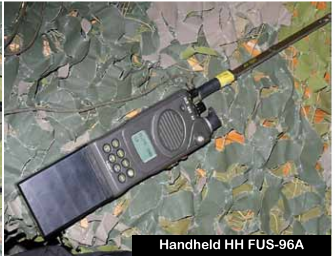
Handheld HH FUS-96A

Das Truppenfunksystem CONRAD besteht aus zwei Grundgeräten, dem Sender/Empfänger RT-9101A und dem so genannten Handheld CNR-710A. Der Sender/Empfänger wird im Tornisterfunksatz (FUS-96D), in Kraftfahrzeugen (FUS-96E bis L) und in Luftfahrzeugen (FUS-96M) grundsätzlich baugleich verwendet. Der abnehmbare Bedienteil erleichtert wesentlich den Fahrzeugeinbau: Der Sender/Empfänger kann - je nach vorhandenem Platz - flexibel angebracht werden, und der Bedienteil ist davon weitgehend unabhängig montierbar.