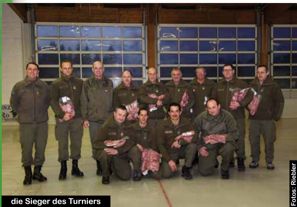
die Sieger des Turniers