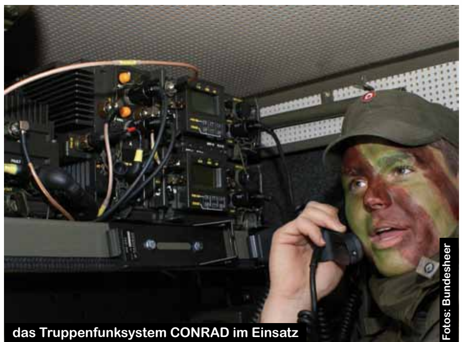
das Truppenfunksystem CONRAD im Einsatz