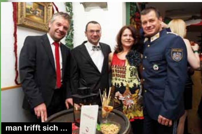
man trifft sich ...

Die Pipeband spielt traditionelle Schottische Marschmusik,