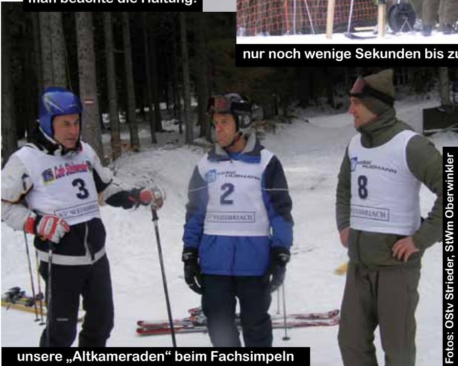
unsere „Altkameraden“ beim Fachsimpeln