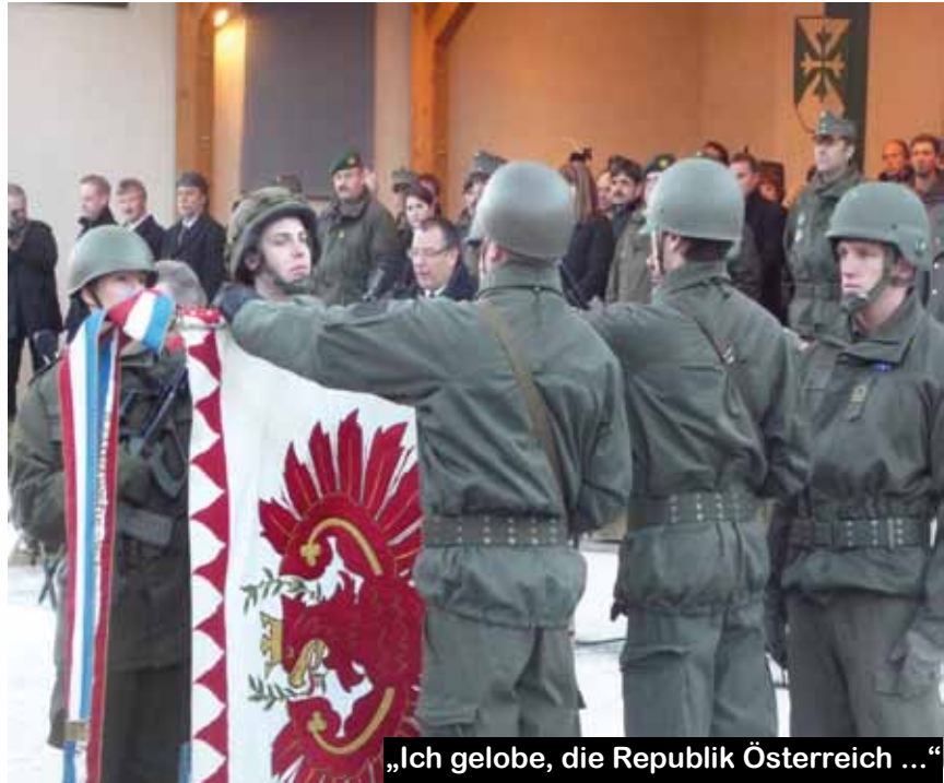
„Ich gelobe, die Republik Österreich ...“