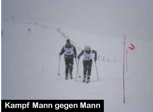
Kampf Mann gegen Mann

Von gemeldeten 120 Starten gingen schlussendlich 112 Kameradinnen und Kameraden ins Rennen. Einzelstart im Minutenintervall, die Gegner vor, neben und hinter sich, so kämpfte man sich Meter für Meter dem Wendepunkt entgegen. Schwierigste Verhältnisse, Schneefall und schlechte Sicht, zugeschneite Brillen, kaum erkennbarer Untergrund und