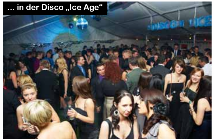
... in der Disco „Ice Age“

rung fand die Miternachtseinlage, dieses Mal gestaltet durch die „Carinthian Pipes and Drums“.