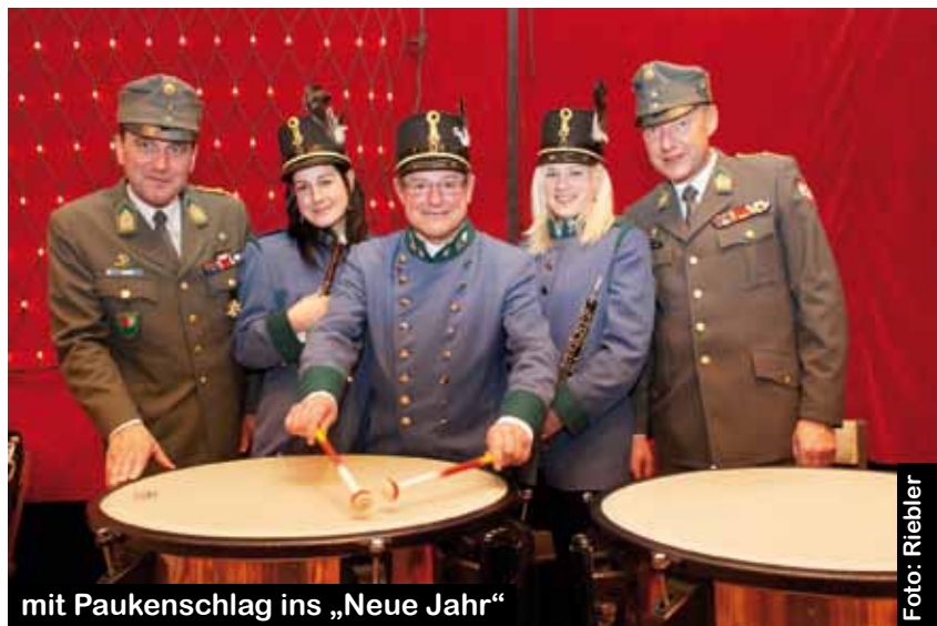
mit Paukenschlag ins „Neue Jahr“