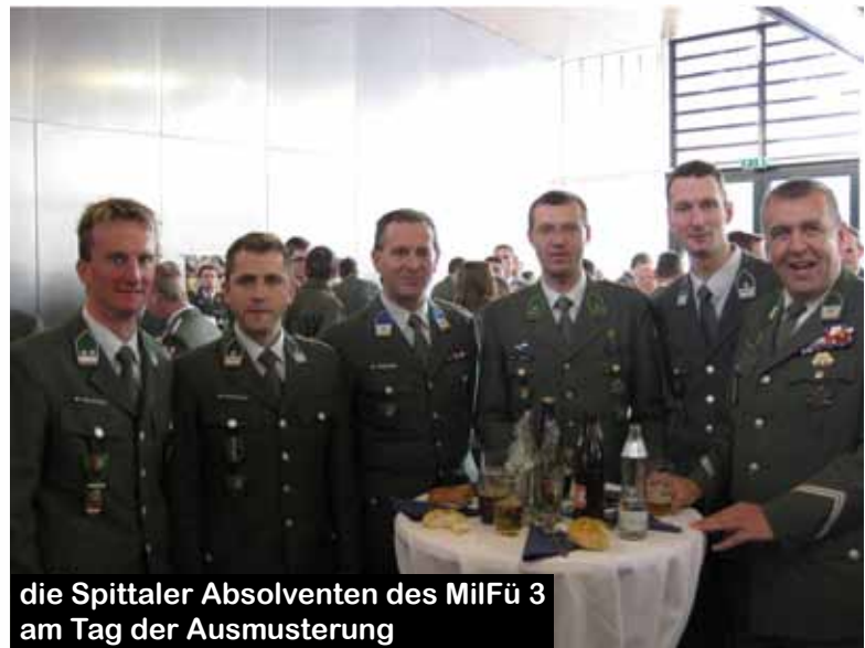
die Spittaler Absolventen des MilFü 3 am Tag der Ausmusterung

Generalleutnant Dietmar Franzisci, Leiter der Sektion II im Bundesministerium für Lan-