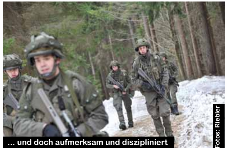
... und doch aufmerksam und diszipliniert