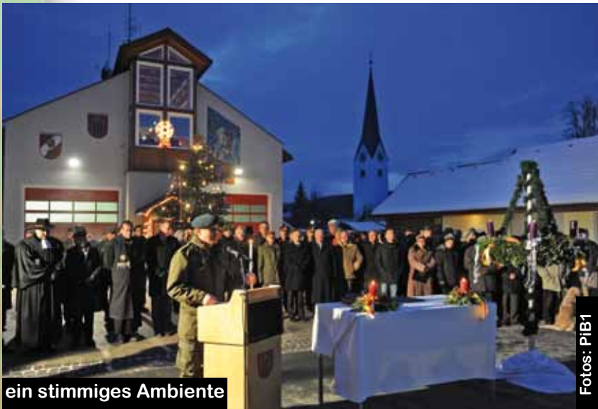
ein stimmiges Ambiente