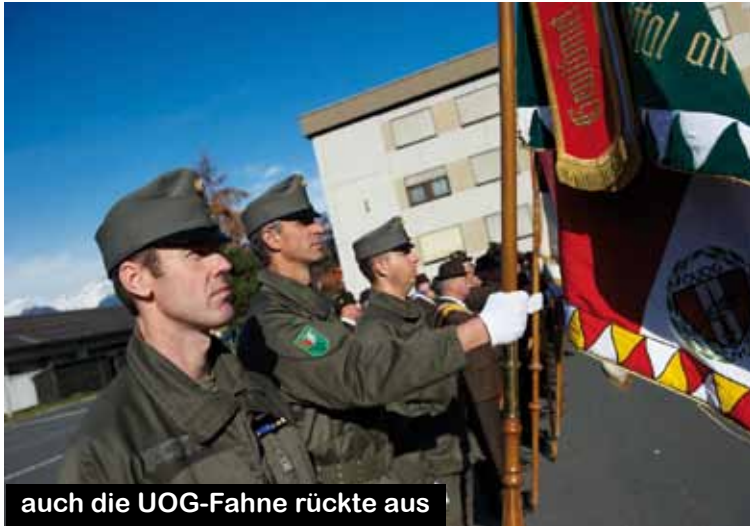
auch die UOG-Fahne rückte aus