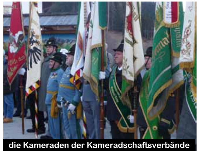
die Kameraden der Kameradschaftsverbände