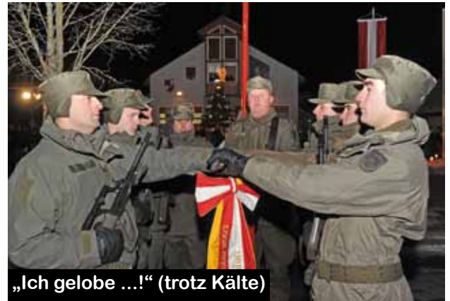
„Ich gelobe ...!“ (trotz Kälte)