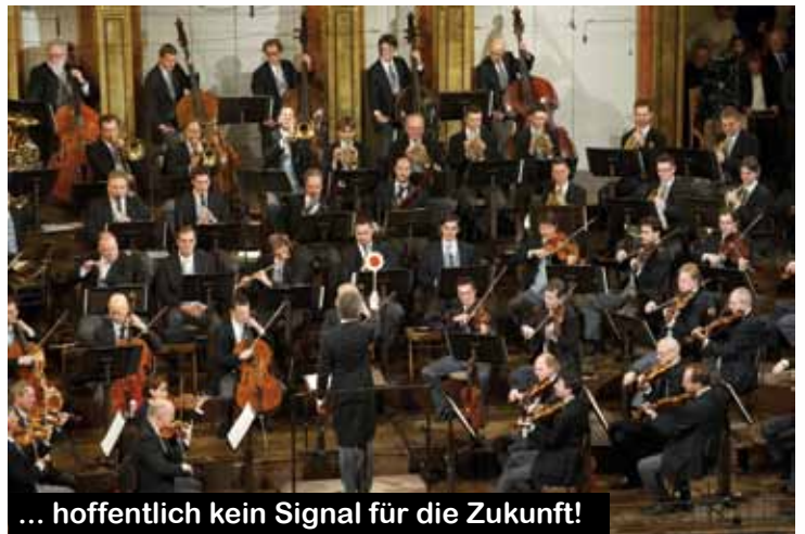
... hoffentlich kein Signal für die Zukunft!