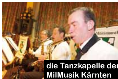
die Tanzkapelle der MilMusik Kärnten

Das Ballkomitee dankt für Ihren werten Besuch!