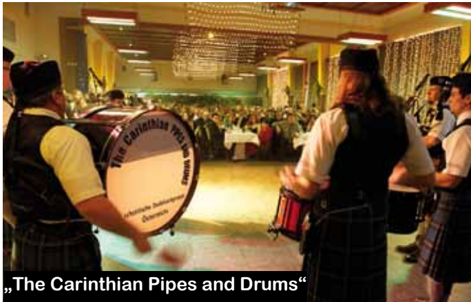
„The Carinthian Pipes and Drums“