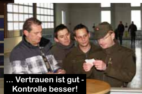
... Vertrauen ist gut - Kontrolle besser!