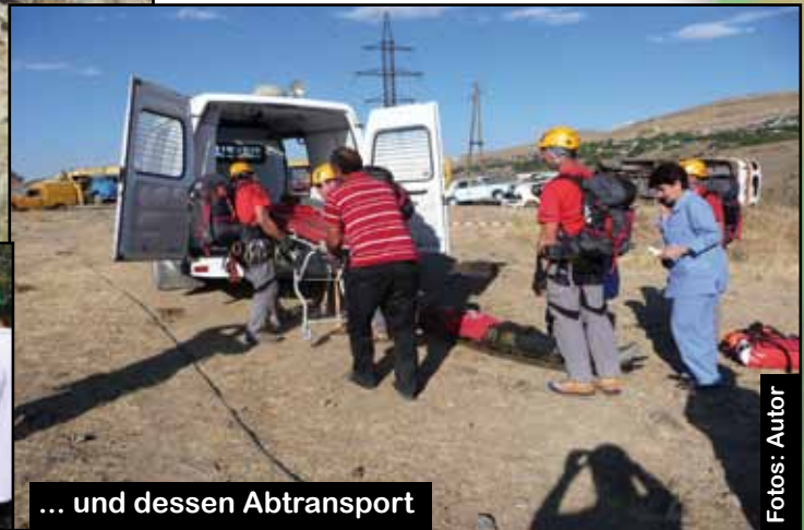
... und dessen Abtransport