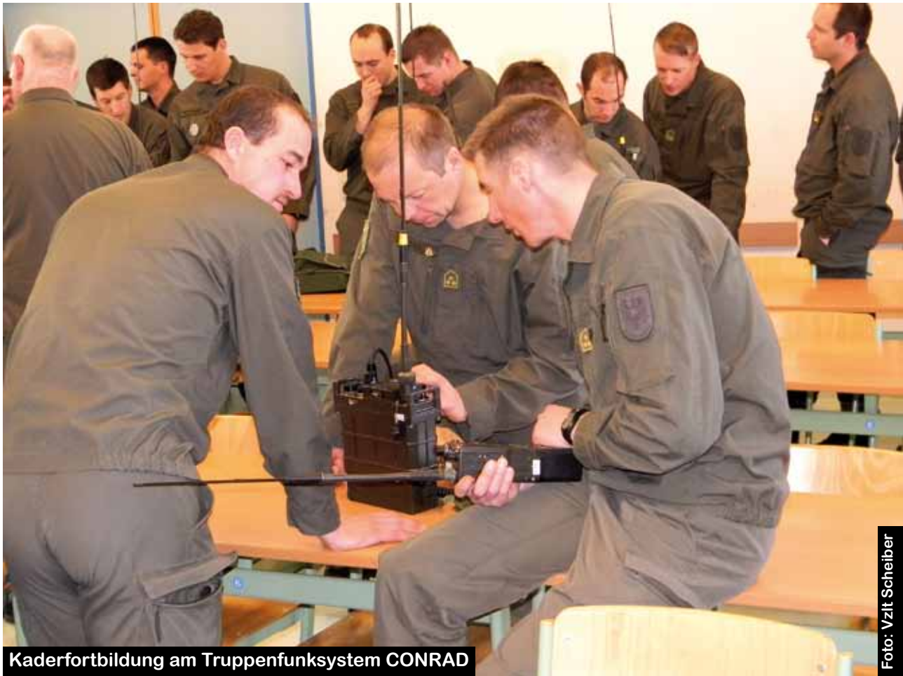
Kaderfortbildung am Truppenfunksystem CONRAD