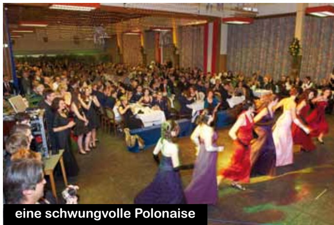
eine schwungvolle Polonaise

und Bassdrum, etwas von der faszinierenden schottischen Tradition und Kultur in Österreich bekannt zu machen. Da in den Jahren 1945 bis 1953 bekannterweise ein Schottisches Highland-Regiment der englischen Besatzungsmacht in der Türkaserne stationiert war, versuchte man heuer den Kreis der Geschichte des JgB26 durch diese Musik zu schließen. So zog sich das „Schottenkaro“ vom Ankündigungsplakat über die Eintrittskarten bis hin zur Dekoration.