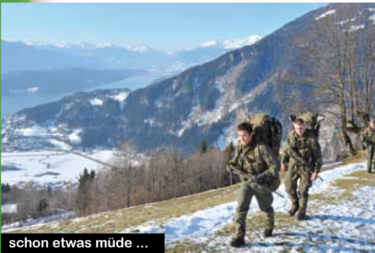
schon etwas müde ...

Nach einer minus 20 Grad kalten Nacht in gut beheizten Gruppenzelten traten die Marschgruppen die zweite Etappe des Bewerbes an. Gleich zu Beginn mussten sich die Gruppen ihren Weg durch die Granatschlucht bahnen, welcher durch Seilgeländer und einem „Bärenhang“ (Möglichkeit zur Überwindung von natürlichen Hindernissen) recht vorweihnachtlich „geschmückt“ war. An diesem Tag beehrte uns die hohe Dienstaufsicht in Person des stellvertretenden Brigadekommandanten Oberst Johann Gaiswinkler, welcher