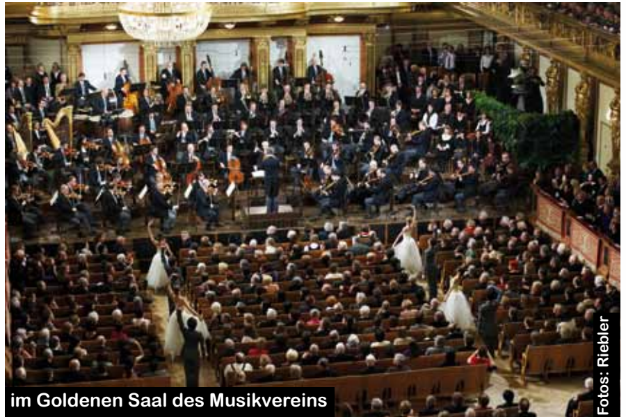
im Goldenen Saal des Musikvereins