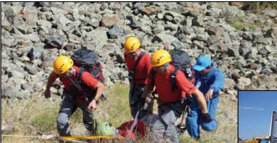
Bergung eines Verletzten ...

Der sechste Tag war gekennzeichnet von einem ausgiebigen Kulturprogramm. Dabei besuchte unser Team ein Felsenkloster aus dem 12. Jahrhundert und den Sevansee auf