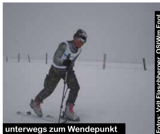
unterwegs zum Wendepunkt