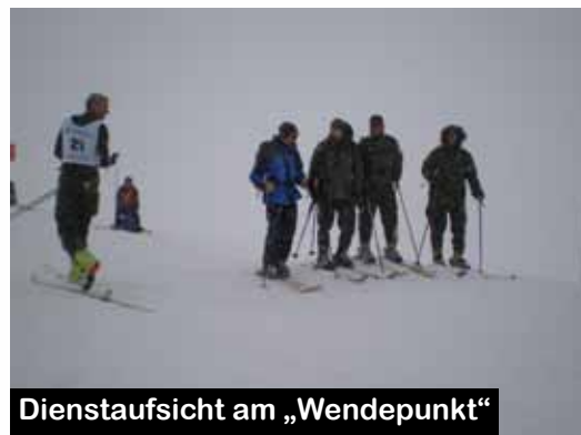
Dienstaufsicht am „Wendepunkt“