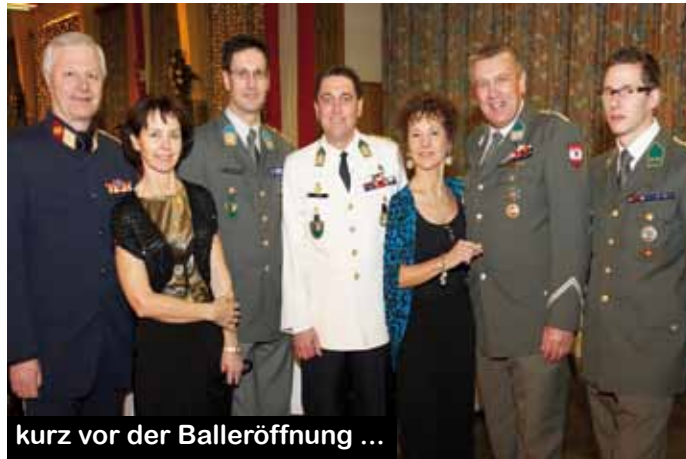
kurz vor der Balleröffnung ...