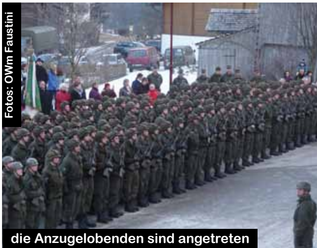
die Anzugelobenden sind angetreten