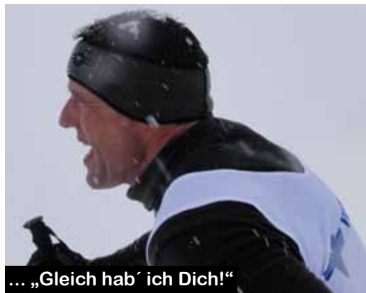
... „Gleich hab´ ich Dich!“