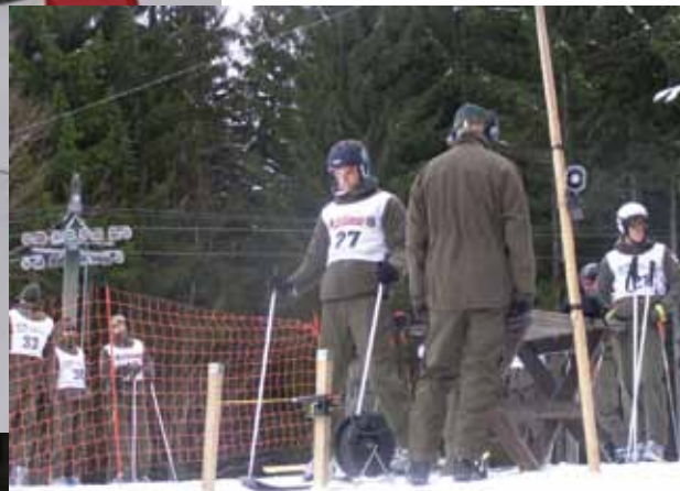
nur noch wenige Sekunden bis zum Start