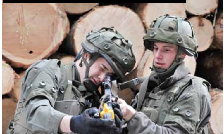
justieren des Schieß-Simulators für das StG77

den von den Teilnehmern rund 25 Kilometer in anspruchsvollem Gelände zurückgelegt. Dazwischen mussten Stationen durchlaufen werden, bei denen die Soldaten und deren Kommandanten gefordert wurden, wie beispielsweise das richtige Verhalten bei Minenbedrohung und/oder Munitionsfunden, das Lösen einer Gefechtsaufgabe im Rahmen einer Feinddarstellung, das geschützte und richtige Überwinden von chemisch oder biologisch verseuchten Geländeabschnitten sowie das richtige Behandeln von verwundeten Soldaten und deren Bergung aus der Gefahrenzone. Der Tag endete schließlich in der winterlich weihnachtlichen Granatschlucht in Radenthein, in welcher die Soldaten in ihren