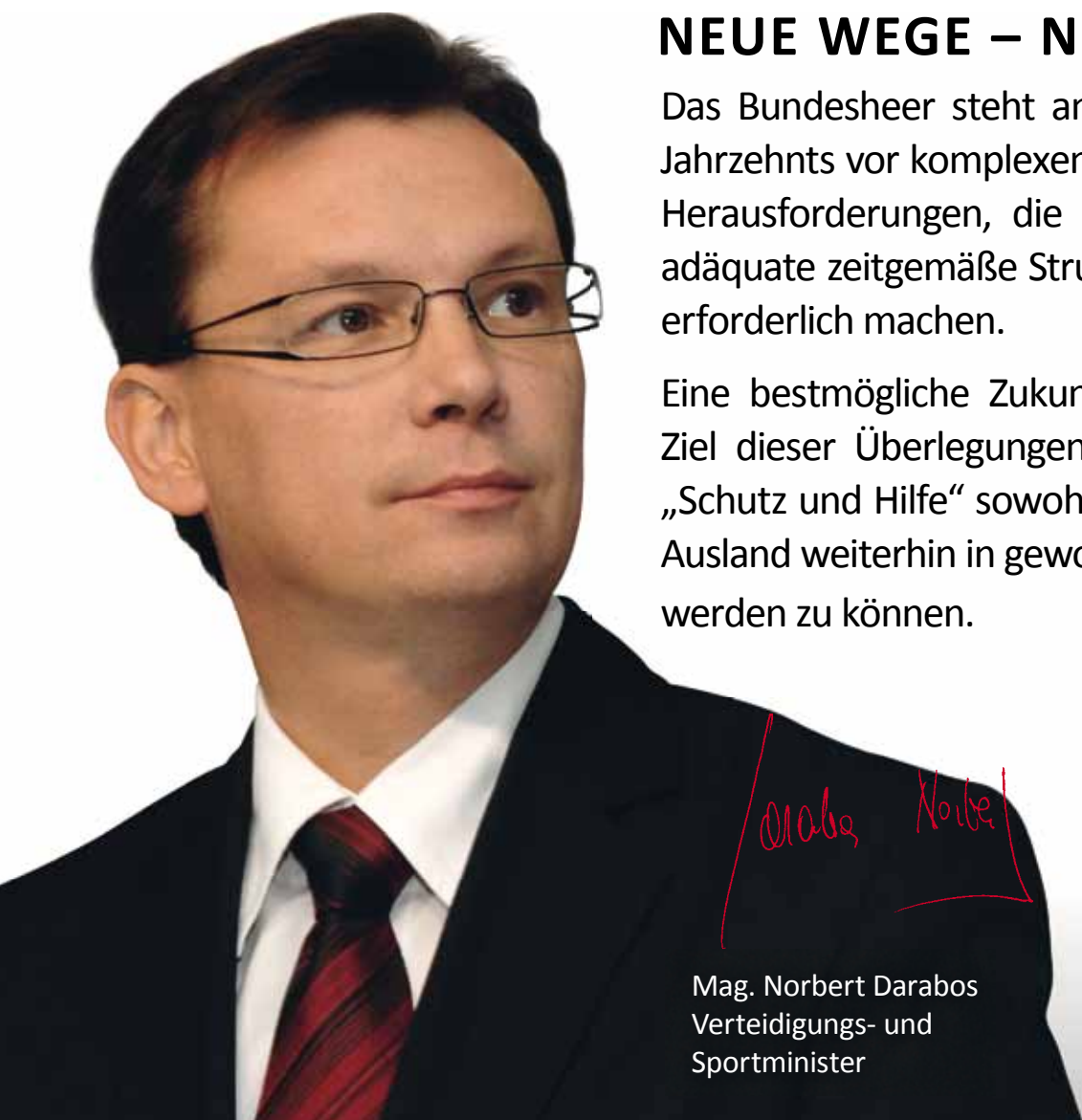
Mag. Norbert Darabos Verteidigungs- und Sportminister

Eine bestmögliche Zukunftsperspektive ist das Ziel dieser Überlegungen, um unserem Motto „Schutz und Hilfe“ sowohl im Inland als auch im Ausland weiterhin in gewohnter Qualität gerecht werden zu können.