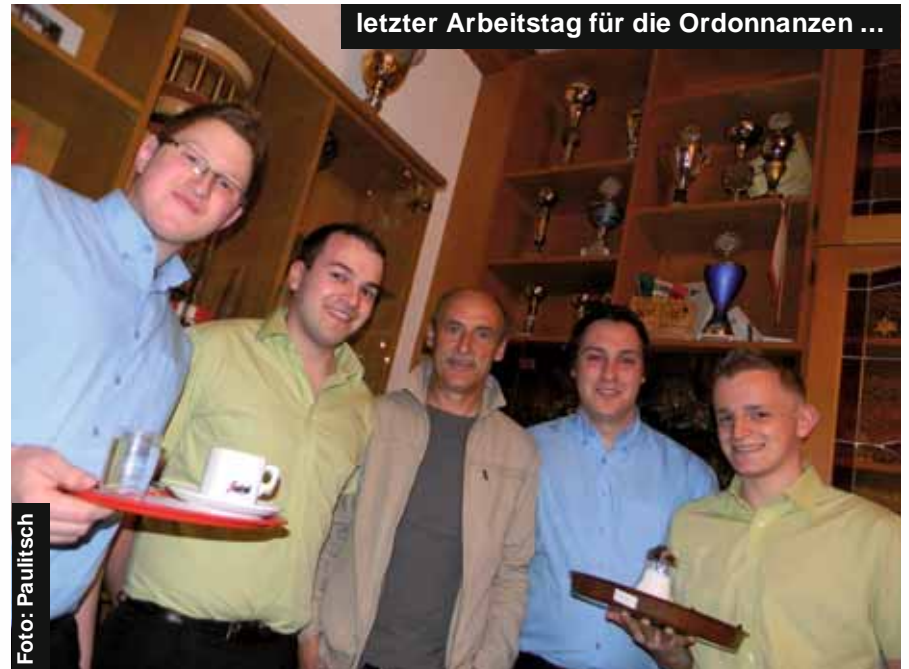
letzter Arbeitstag für die Ordonnanzen ...