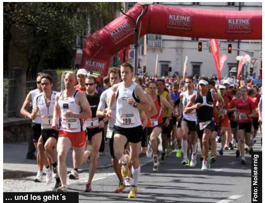
... und los geht's

posten, Zeitnehmung, Ausschankpersonal, Einweiser, Kinderbetreuer und vieler mehr, um eine Veranstaltung in dieser Größenordnung zum Erfolg