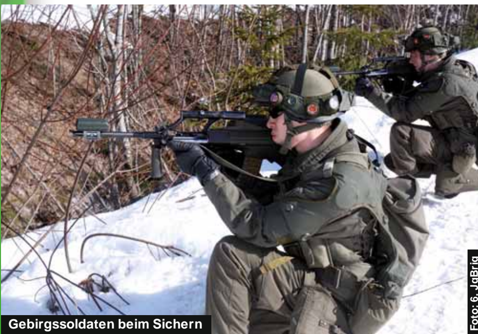
Gebirgssoldaten beim Sichern

Die Ausgangslage, sowie die Befehle für den Angriff wurden so gestaltet, dass möglichst viele Elemente des Gebirgskampfes zur Anwendung kommen konnten. So wurden Aufklärungskräfte über unwegsames Gelände angesetzt, vorgestaffelt Unterstützungswaffen überhöht in Stellung gebracht, Kräfte mit Hubschraubern