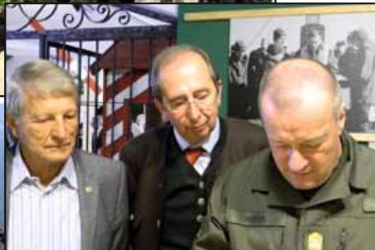
... und interessiert im Traditionsraum

Nach einem ersten freundschaftlichen Begegnen der Ehrengäste und ehemaligen Angehörigen und Weggefährten fanden im ehemaligen Offiziersca-