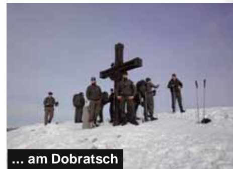
... am Dobratsch

Der Einblick in urbane Gefechtstechnik (Kampf in verbautem Gebiet) war ein weiterer Höhepunkt der Ausbildung. Den teilnehmenden Milizsoldaten wird nicht nur der motorisierte