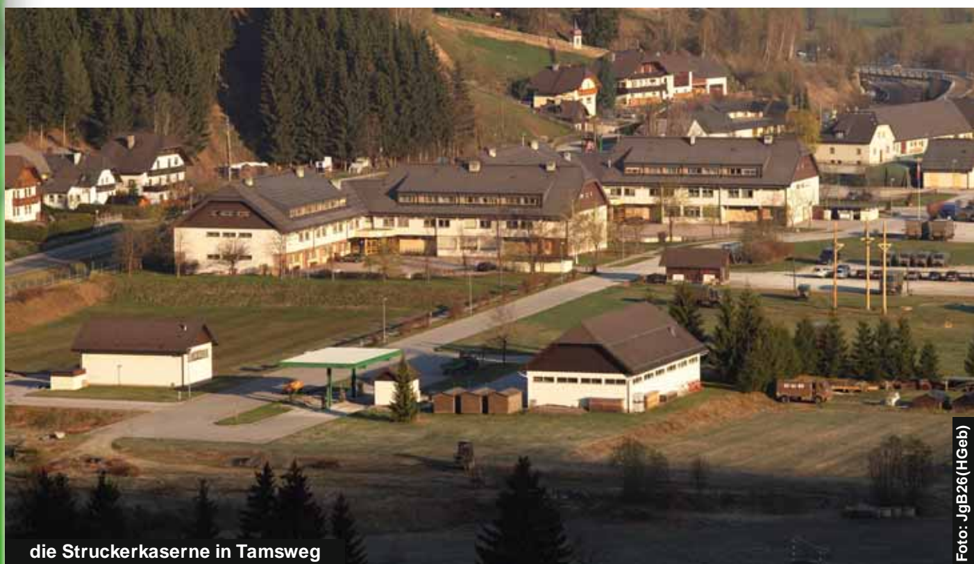
die Struckerkaserne in Tamsweg