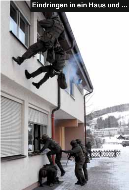
Eindringen in ein Haus und ...

Auch diesmal folgten wieder besonders viele Mitglieder des Österreichischen Kameradschaftsbundes der Einladung.