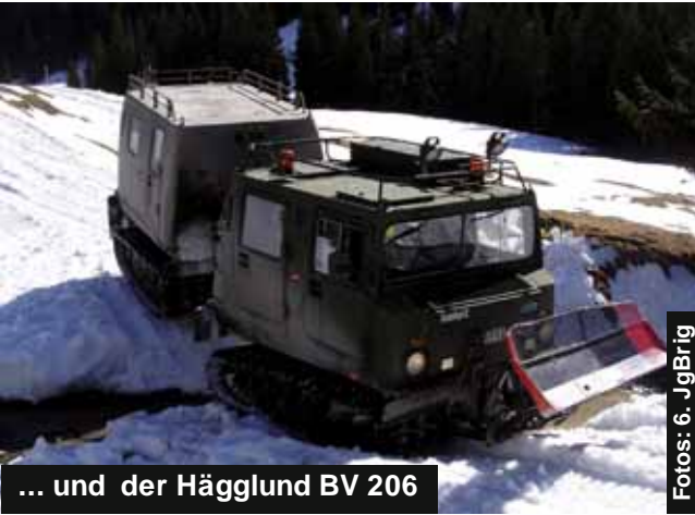
... und der Högglund BV 206