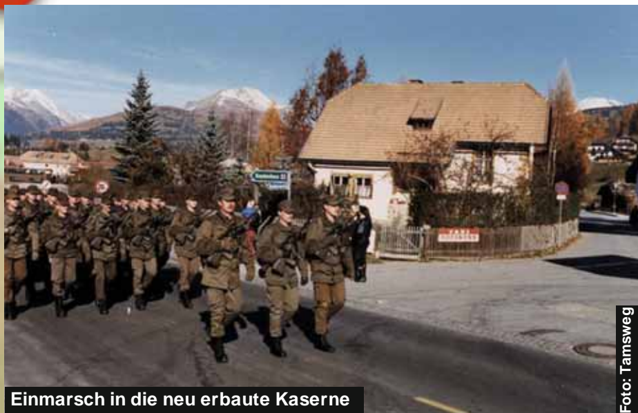
Einmarsch in die neu erbaute Kaserne