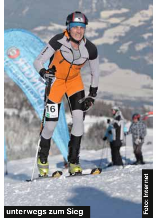
unterwegs zum Sieg