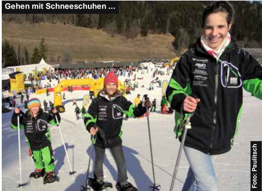
Gehen mit Schneeschuhen ...

Informationen gab es auch über laufende Auslandseinsätze des Heeres, über Abläufe während der Stellung, die Grundausbildung sowie