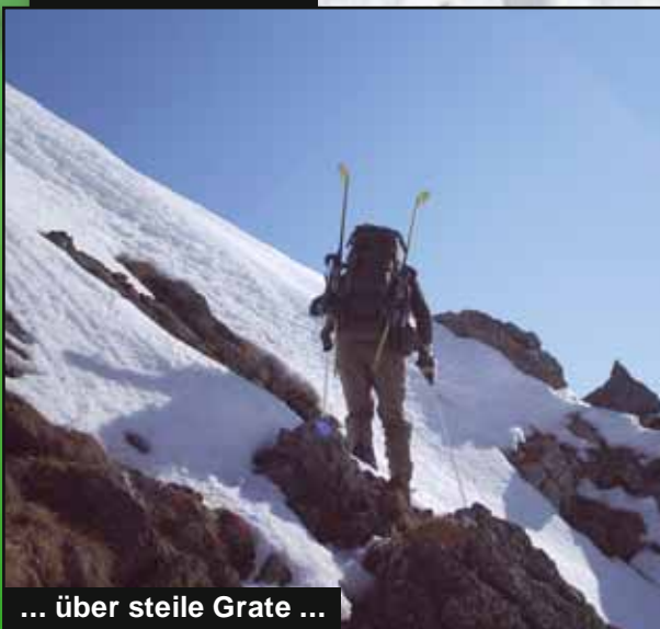
... über steile Grate ...