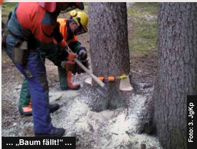
... „Baum fällt!“ ...