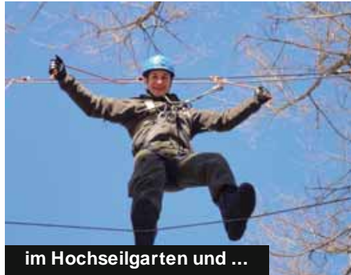
im Hochseilgarten und ...

Wir werden sicher noch unseren Kindern und Enkelkindern erzählen,