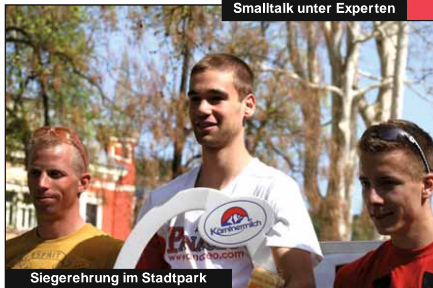
Siegerehrung im Stadtpark