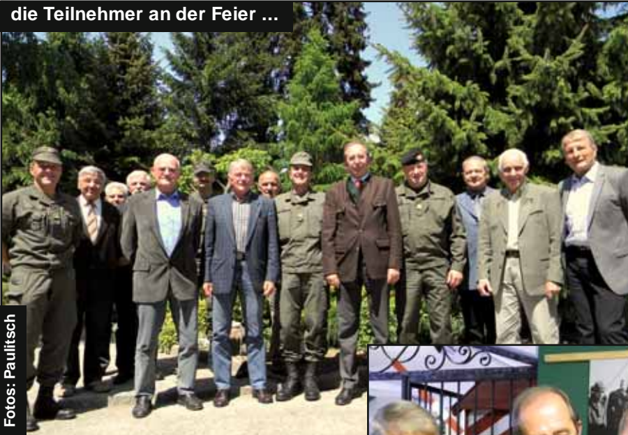
die Teilnehmer an der Feier ...

Nach einer kurzen Kaffeepause und dem anschließenden Besuch bei der Kampfunterstützungskompanie, bei der den frisch eingerückten Rekruten gerade die eigene Kompanie vorgestellt wurde, fand man sich noch zum gemütlichen Teil und dem Schwelgen in Erinnerungen im Bereich der Cafeteria.