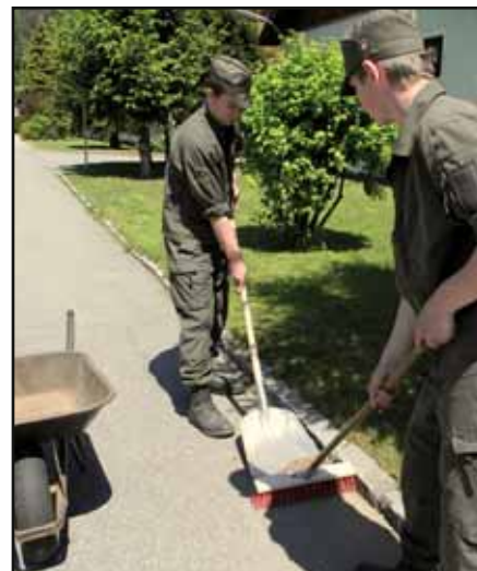
fleißige Rekruten beim Saubermachen