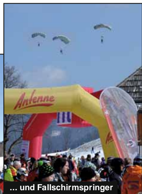
... und Fallschirmspringer

für die Redaktion Vizeleutnant Friedrich Paulitsch