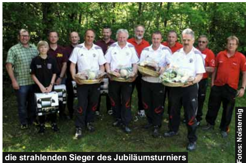
die strahlenden Sieger des Jubiläumsturniers