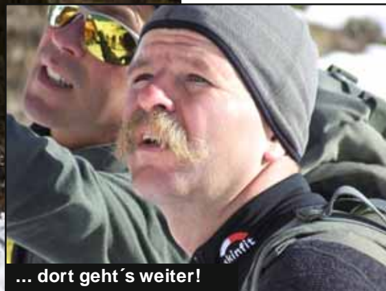
... dort geht's weiter!