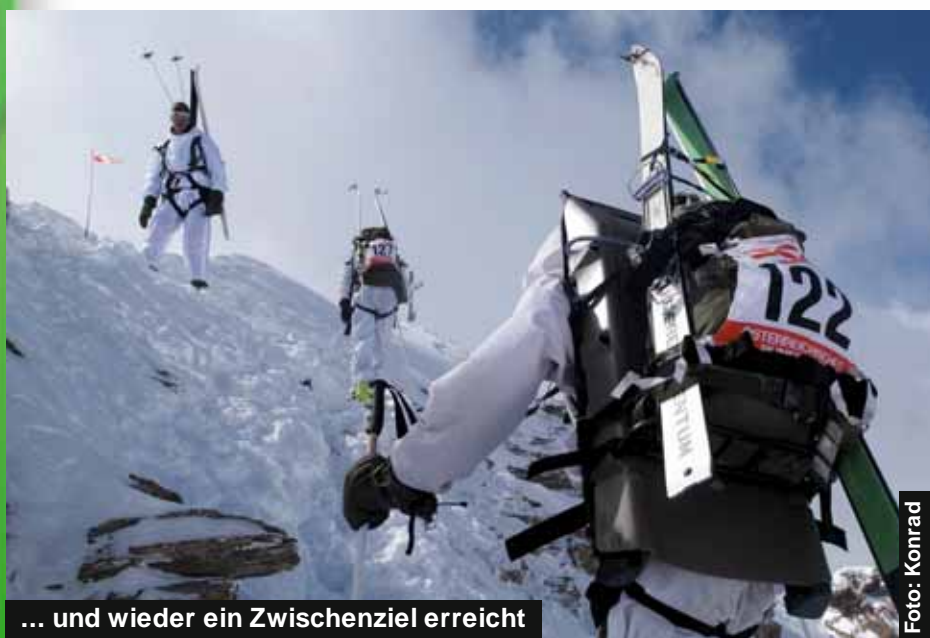
... und wieder ein Zwischenziel erreicht