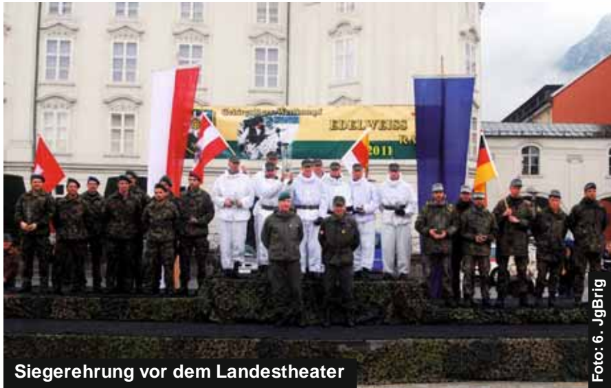
Siegerehrung vor dem Landestheater