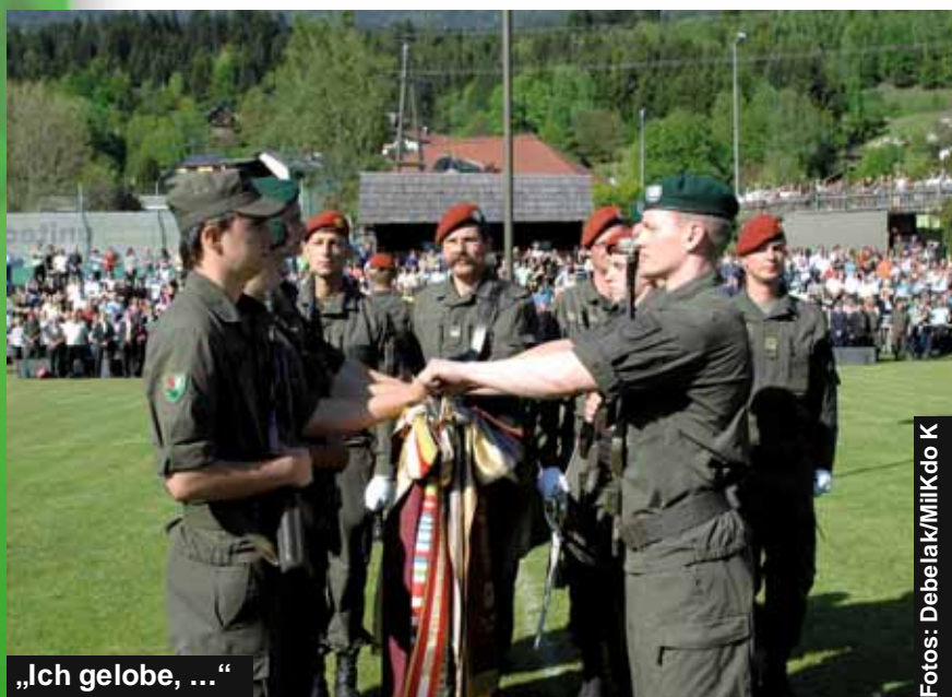
„Ich gelobe, ...“