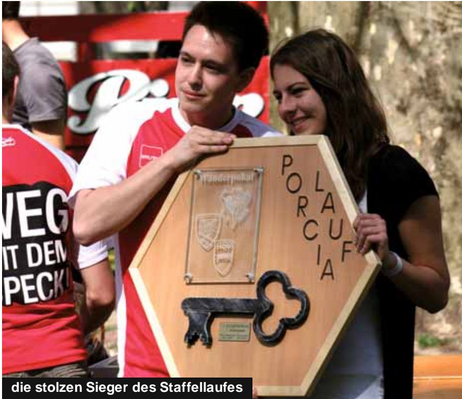
die stolzen Sieger des Staffellaufes