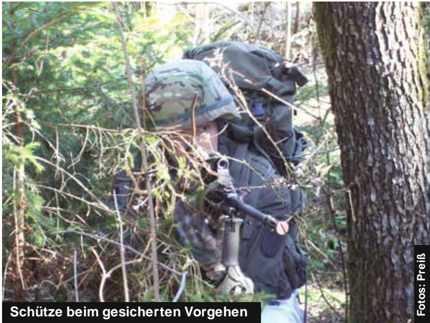
Schütze beim gesicherten Vorgehen