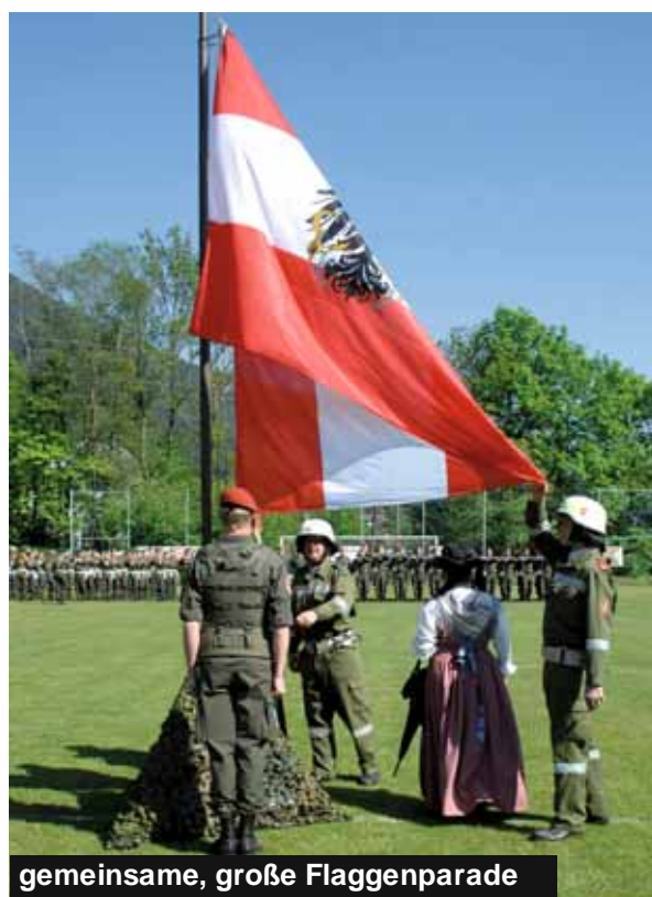
gemeinsame, große Flaggenparade