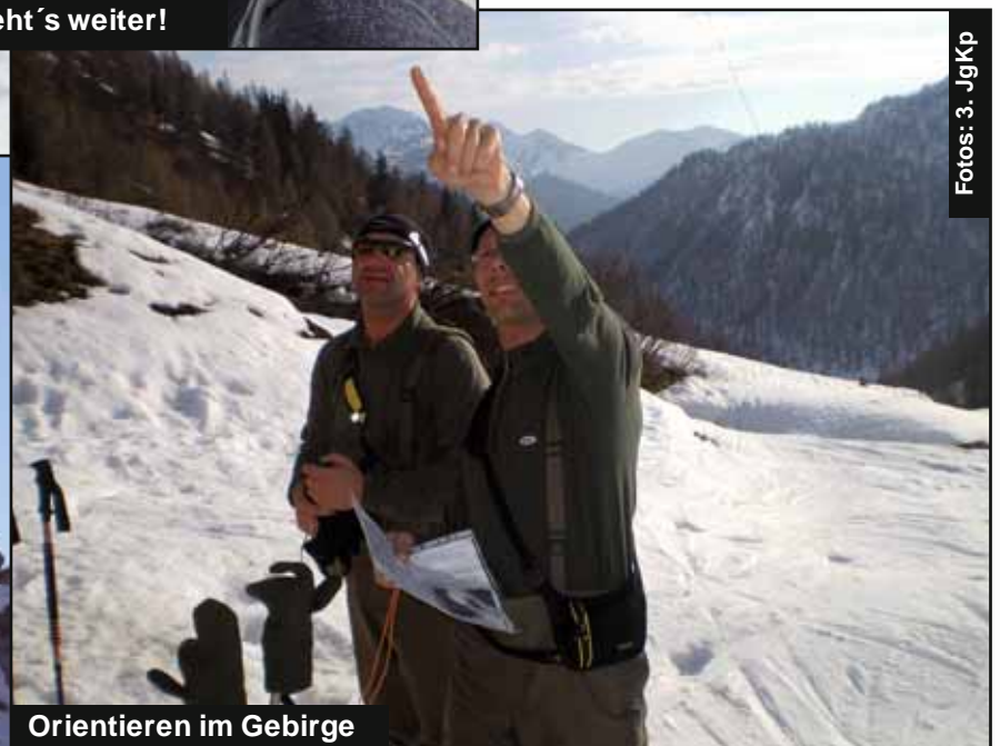
Orientieren im Gebirge