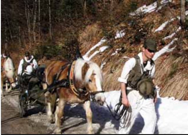
im Gebirgskampf nach wie vor unverzichtbar: Tragtiere ...