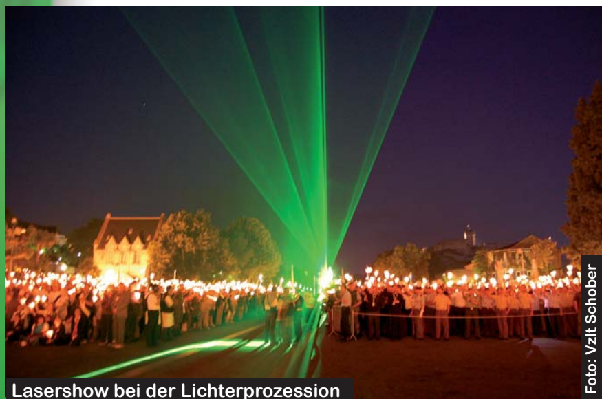
Lasershow bei der Lichterprozession