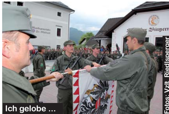
Ich gelobe ...