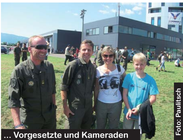
... Vorgesetzte und Kameraden