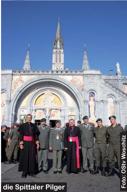
die Spittaler Pilger