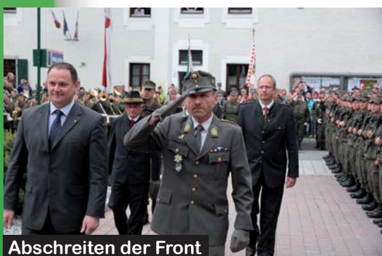
Abschreiten der Front