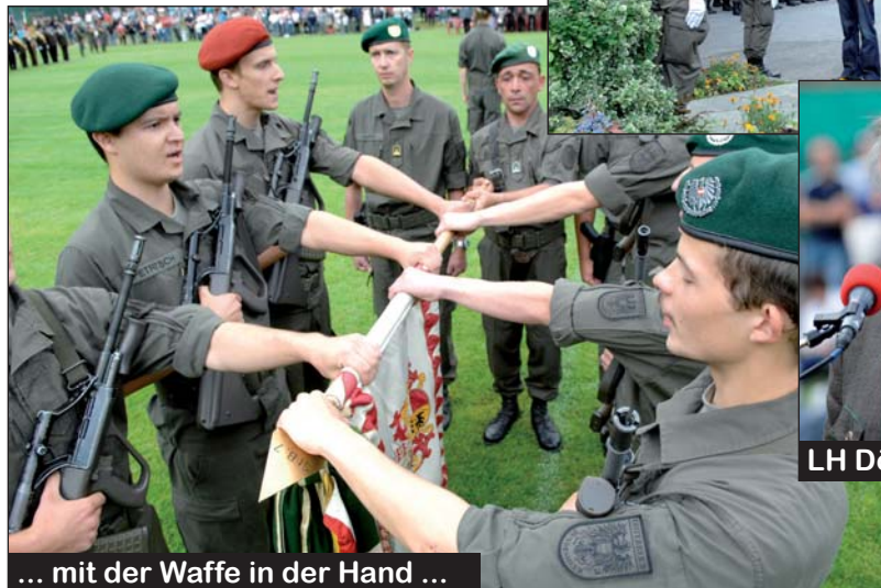
... mit der Waffe in der Hand ...