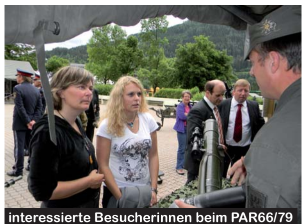
interessierte Besucherinnen beim PAR66/79