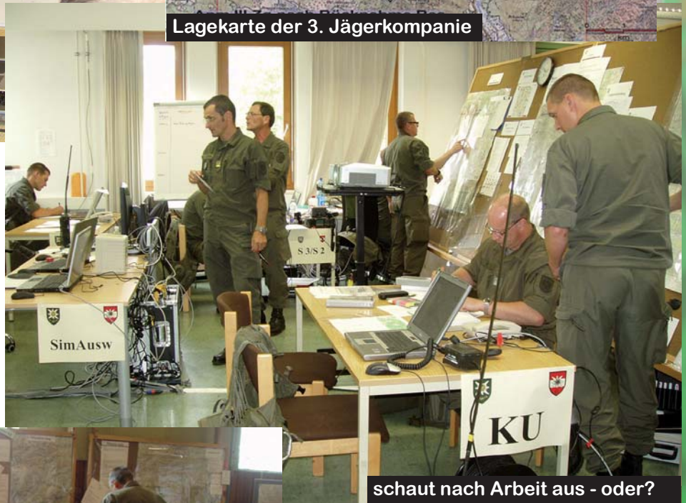
schaut nach Arbeit aus - oder?

Der Einstieg für den Bataillonsstab und die Kompaniekommanden in das Jahres-Schwergewichtsthema