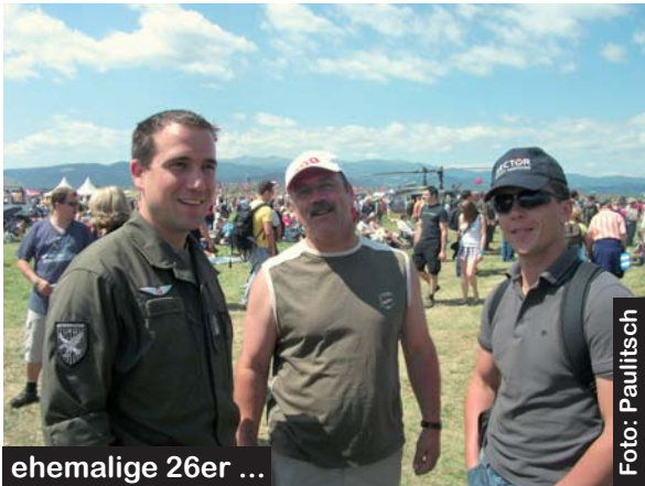
ehemalige 26er ...

Die Wertschätzung durch die Airpower 2011 wird mit rund 15 Millionen