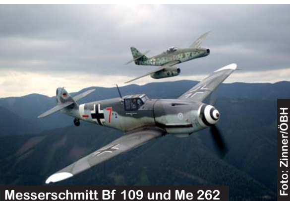
Messerschmitt Bf 109 und Me 262