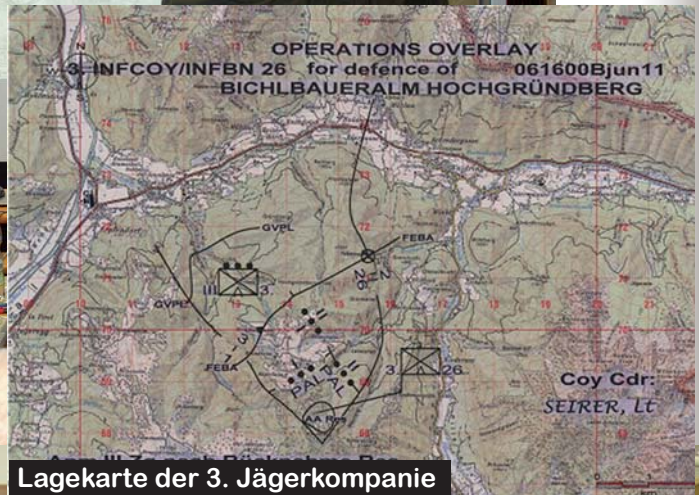
Lagekarte der 3. Jägerkompanie

sorgungseinrichtungen erzwungen. Plötzlich wird eine Seilbahn vom Tal auf das Hochplateau das zentrale Element der Versorgung.