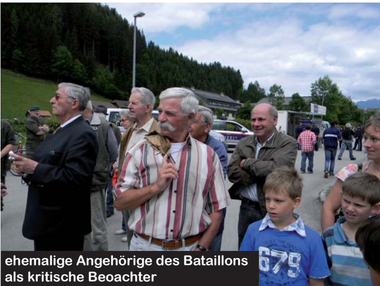
ehemalige Angehörige des Bataillons als kritische Beobachter