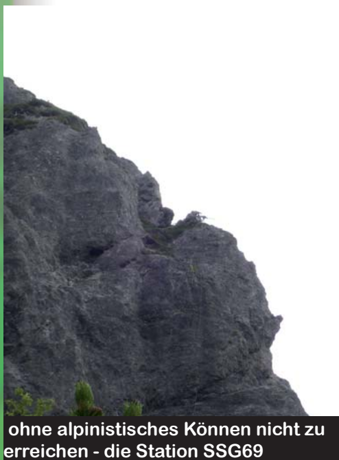
ohne alpinistisches Können nicht zu erreichen - die Station SSG69

Neben einer Kaderfortbildung in Form eines Wettkampfes, in dem Bedienungen schwerer Waffen „gebirgsjägerwürdige“ Aufgaben im scharfen Schuss erfüllen mussten, wurden auch die in der Vorwoche am Führungssimulator gewonnenen Bilder der Gebirgsbrigade in der Verteidigung mit Geländebezug und ebenso würdiger