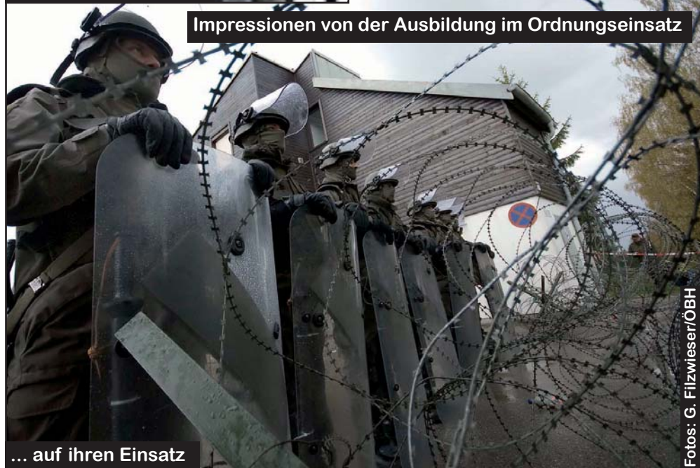
Impressionen von der Ausbildung im Ordnungseinsatz