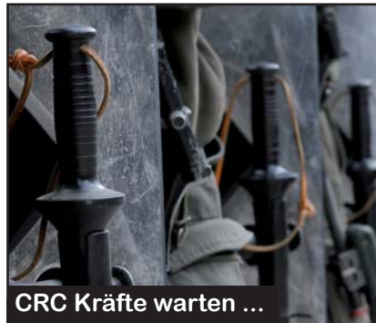
CRC Kräfte warten ...