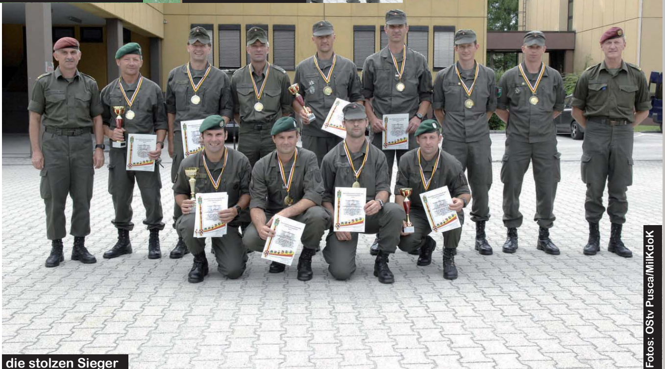
die stolzen Sieger