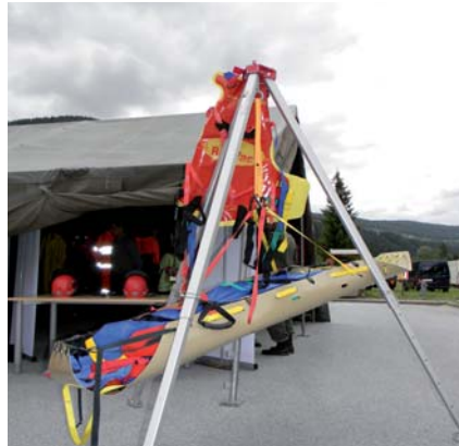
Rolltrage „Roll Up“ der Fa. Kohlbrat und Bunz