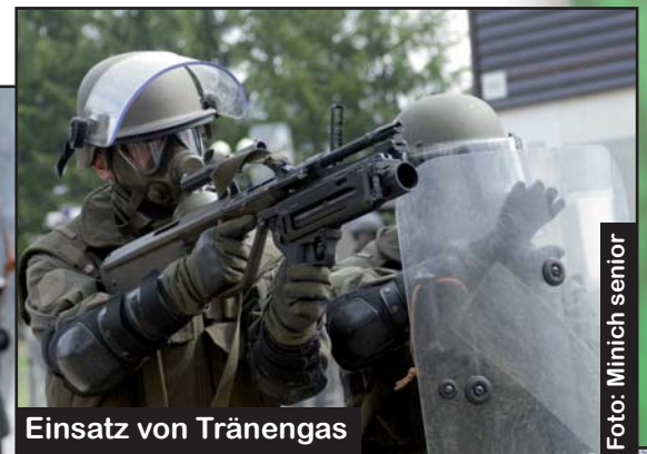
Einsatz von Tränengas