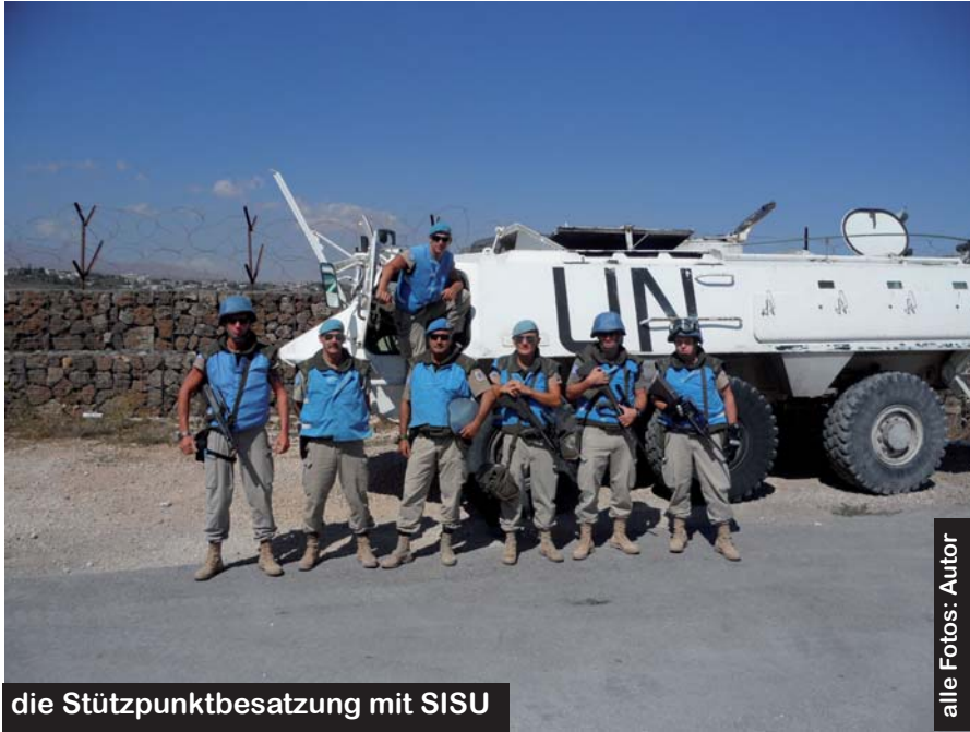
die Stützpunktbesetzung mit SISU