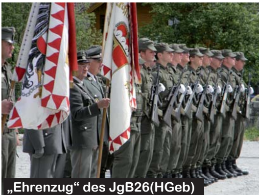
„Ehrenzug“ des JgB26(HGeb)