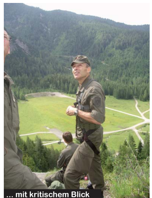
... mit kritischem Blick

Für Soldaten der Gebirgstruppe ist es nicht ausreichend, eine sachgemäße Waffenhandhabung unter Normalbedingungen vorweisen zu können. Vielmehr muss die Leistungserbringung auch unter extremen Wetterbedingungen, unter körperlicher Belastung und mit anspruchsvollen Ziellagen (bergauf, bergab) erfolgen können. Anpassungs- aber auch Improvisationsfähigkeit sind hierbei die Grundlagen der erfolgreichen Auftragserfüllung. Es konnte in diesem