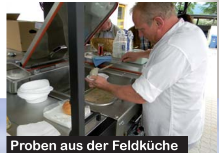
Proben aus der Feldküche