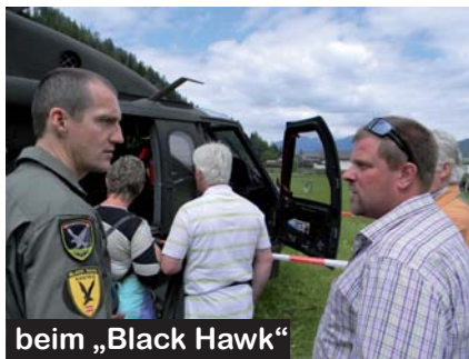
beim „Black Hawk“