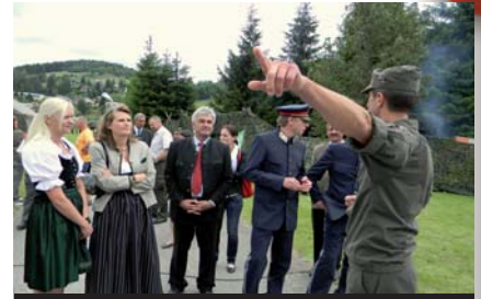
mit den Ehrengästen unterwegs