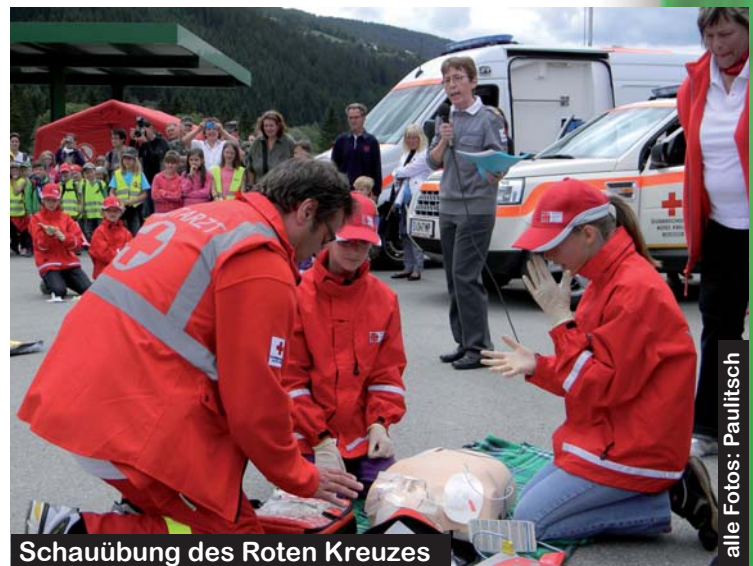
Schauübung des Roten Kreuzes