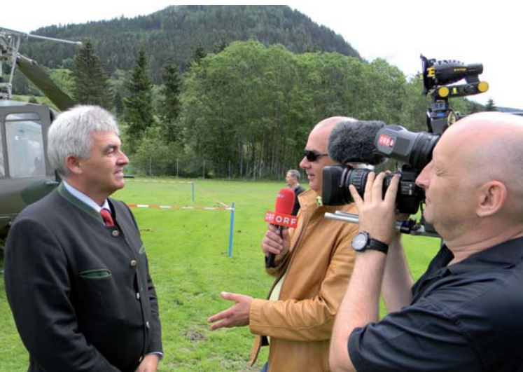
Landtagspräsident ÖR Illmer im Interview mit dem ORF