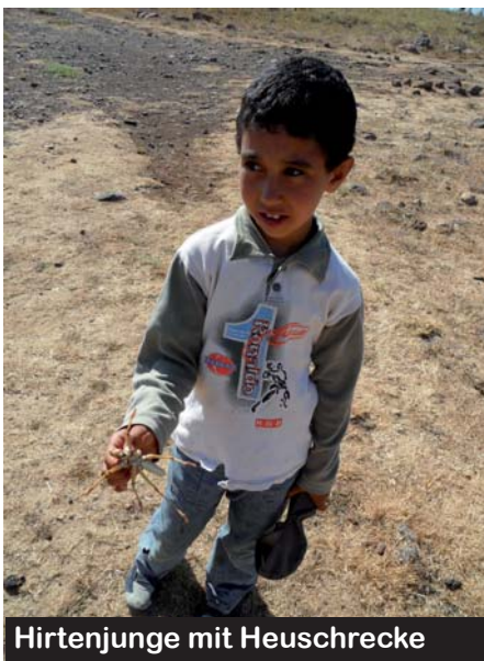
Hirtenjunge mit Heuschrecke