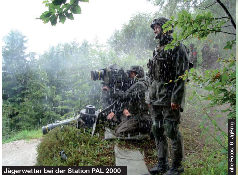
Jägerwetter bei der Station PAL 2000

Neben der Beleuchtung von Schnittstellen wurde auch rasch klar, dass gebirgisches Gelände und extreme Witterungsbedingungen nicht zwangsläufig als Nachteil für den Verteidiger zu werten waren. „Gute Planer spielen eigene Stärken aus – schlechte Pla-