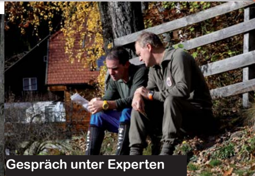
Gespräch unter Experten