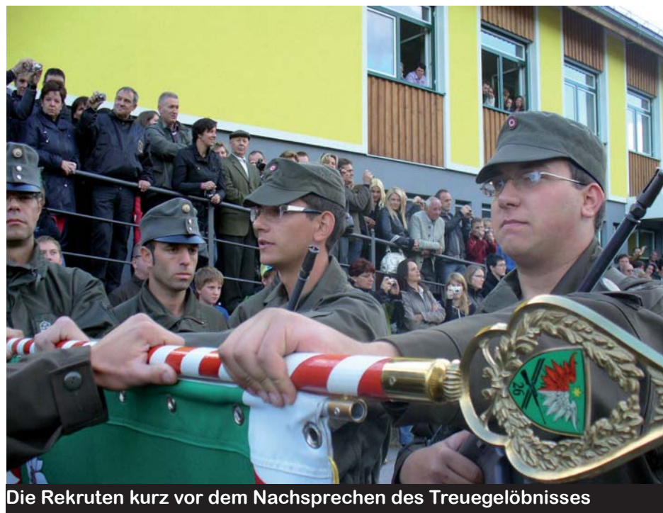
Die Rekruten kurz vor dem Nachsprechen des Treuegelöbnisses