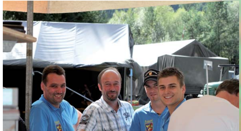
die Kameraden der Feuerwehr Baldramsdorf haben heuer Großes vor

Als neuer geschäftsführender Obmann bedanke ich