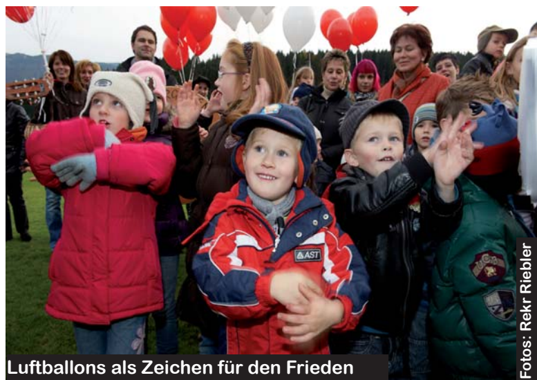
Luftballons als Zeichen für den Frieden