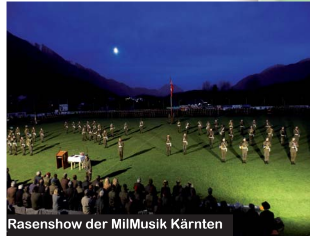
Rasenshow der MilMusik Kärnten

Die Truppenübungen des Landwehrbataillons 741, des Gailtaler Bataillons, der Grenzüberwachungseinsatz „Karnische Wacht“, die Abschlussübung der Militärakademie und die Großmanöver der 12. Jägerbrigade 1996 sind neben zahlreichen Katastropheneinsätzen, wo schnell und unbürokratisch wertvolle Hilfe geleistet wurde, und vieler würdiger und