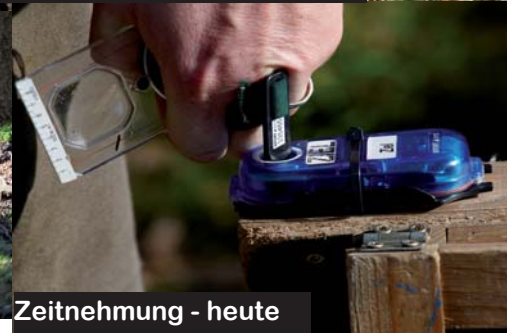
Zeitnehmung - heute