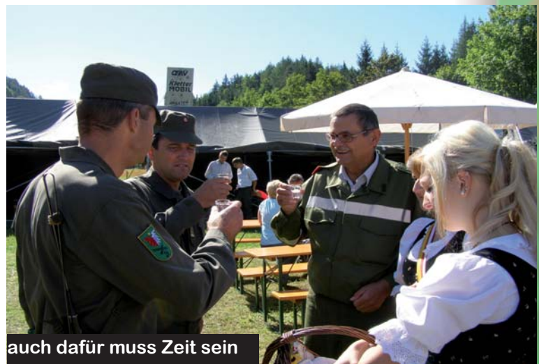
auch dafür muss Zeit sein