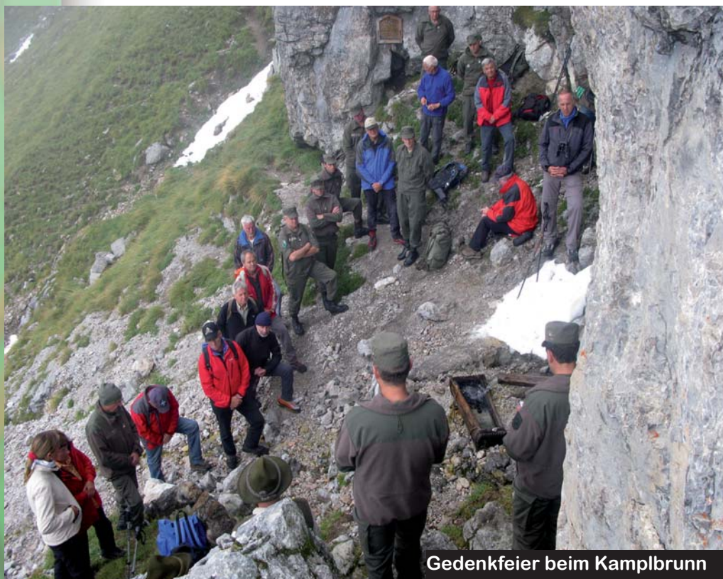
Gedenkfeier beim Kamplbrunn

Uneingeschränkter Respekt vor den Menschen, der Familie und vor der Gemeinschaft.