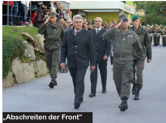
„Abschreiten der Front“