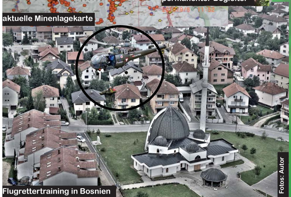
Flugrettertraining in Bosnien