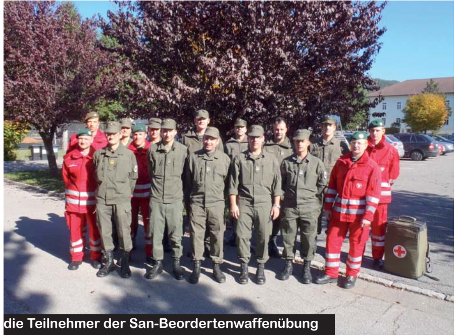
die Teilnehmer der San-Beordnetenwaffenübung

Hauptaugenmerk lag diesmal bei der Laienreanimation,