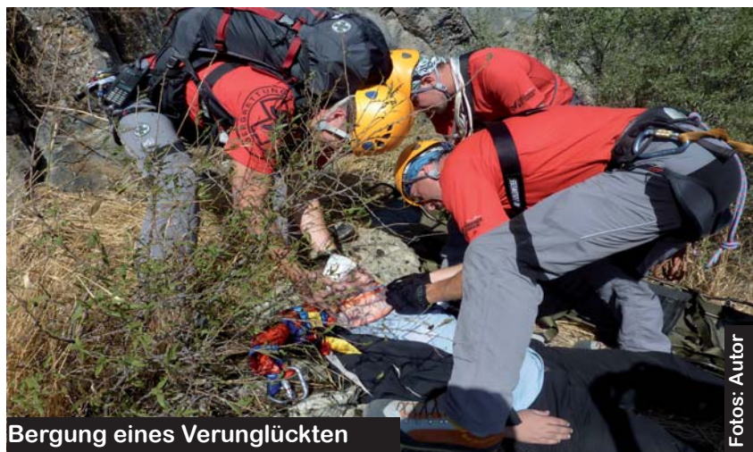
Bergung eines Verunglückten