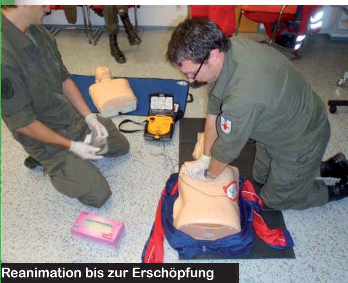
Reanimation bis zur Erschöpfung