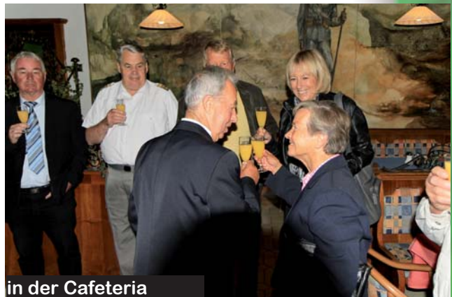
in der Cafeteria

Er freut sich und lacht mit uns, er leidet mit uns - zuletzt mit der Wegver-