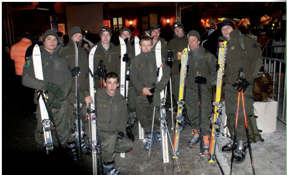
Teilnehmer am 11. Mountain Attack:

Dann begann der Anstieg über das Hasenauer Köpfl auf den Reiterkofel. Dieser Anstieg erschien aufgrund der vorherigen Belastung viel brutaler. Bis zum Hasenauer Köpfl war meine Verfassung noch einigermaßen gut, doch die restliche Strecke