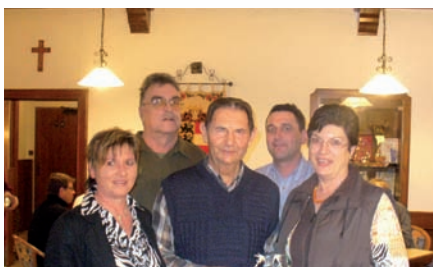
v.: das Damenpaar der BH Spittal und der älteste Teilnehmer hvlnr.: leitender Gesamtorganisator und Bataillonskommandant

Computerwertung unterstützt, konnte jedes Paar (einschließlich der Finali) in der Rekordzeit von knapp 6 Stunden 11 Spiele (!) absolvieren.