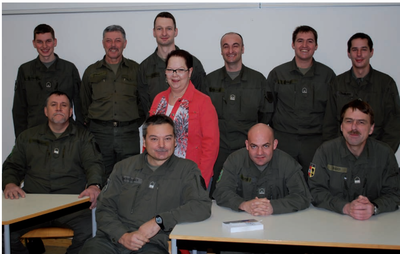
Die Teilnehmer des „A II-Kurses“

The students of the English group “A II” in 01/02/2009