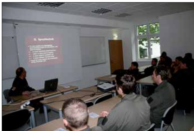
Ausbildung in „Voice procedure“

sichtlich der Aufgaben, welche in der NATO Task List (NTL) verankert sind hergestellt. Die Abdeckung der Aufgaben der NTL ist in weiterer Folge die Grundlage für die erfolgreiche Evaluierung. Hiezu wurden