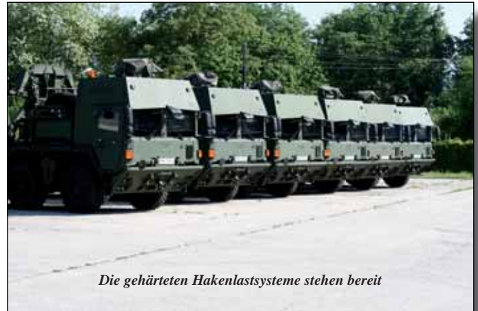
Die gehärteten Hakenlastsysteme stehen bereit

Im Rahmen der dreiwöchigen Zusammenziehung in Klagenfurt wurde mit Schwergewicht der einheitliche Ausbildungsstand der Soldaten, vor allem hin-