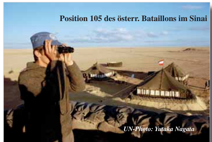
Position 105 des österr. Bataillons im Sinai

Dieser Einsatz war geprägt von logistischen Schwierigkeiten, die aber alle gemeistert werden konnten. Die erste reguläre Versorgung per Schiff kam erst Anfang 1974. Auch die klimatischen Verhältnisse stellten das Bataillon vor Probleme. Die Küche war auf Grund von Erkrankungen des Küchenpersonals die meiste Zeit geschlossen und wir mussten uns mit der „köstlichen“ englischen Einsatzverpflegung (compo ration) begnügen, welche wir mit unseren Kerosinkochern zubereiteten. Die Unterkünfte in den Camps Ismailia und später in Suez bestand aus guten Gebäuden, jedoch ohne Mobiliar.