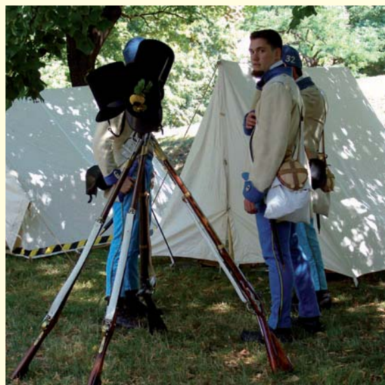
Abb. 5: Linieninfanterieregiment Esterházy Nr. 32 im Zeltlager