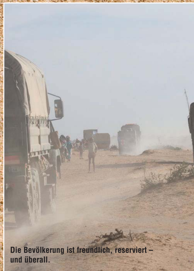
Die Bevölkerung ist freundlich, reserviert – und überall.