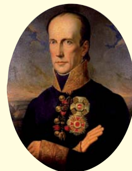
Abb. 3: Erzherzog Johann von Österreich (1782-1859)