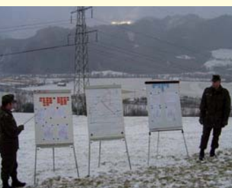
Abb 1: Lage St. Michael 1809