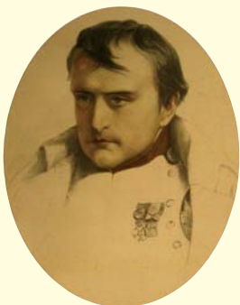
Abb.1: Napoléon Bonaparte (1769-1821)

Traditionspflege bietet vielerlei Anknüpfungspunkte.