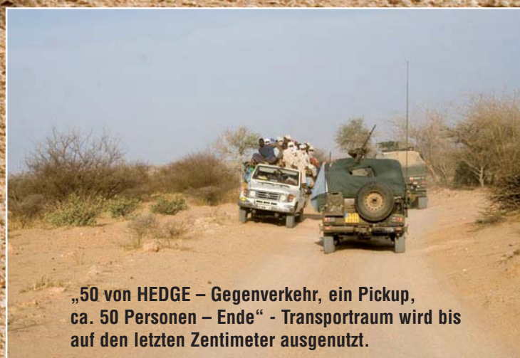
„50 von HEDGE – Gegenverkehr, ein Pickup, ca. 50 Personen – Ende“ - Transportraum wird bis auf den letzten Zentimeter ausgenutzt.