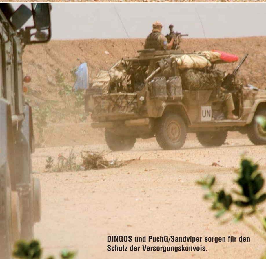
DINGOS und PuchG/Sandviper sorgen für den Schutz der Versorgungskonvois.

Die Notwendigkeit dieses Schutzes ergibt sich alleine aus der Tatsache, dass UN-Fahrzeuge und Personen immer wieder Opfer von Wegelagerern und Dieben werden. Durch die Verwendung des All-