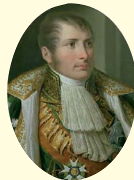
Abb. 2: Vizekönig Eugène de Beauharnais (1781-1824)