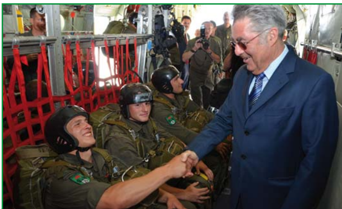
Der Bundespräsident bei Gesprächen mit den Fallschirmspringern