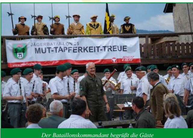
Der Bataillonskommandant begrüßt die Gäste

marschall Ludwig Andreas Graf von Khevenhüller in die „Khevenhüller Kaserne“ umbenannt.