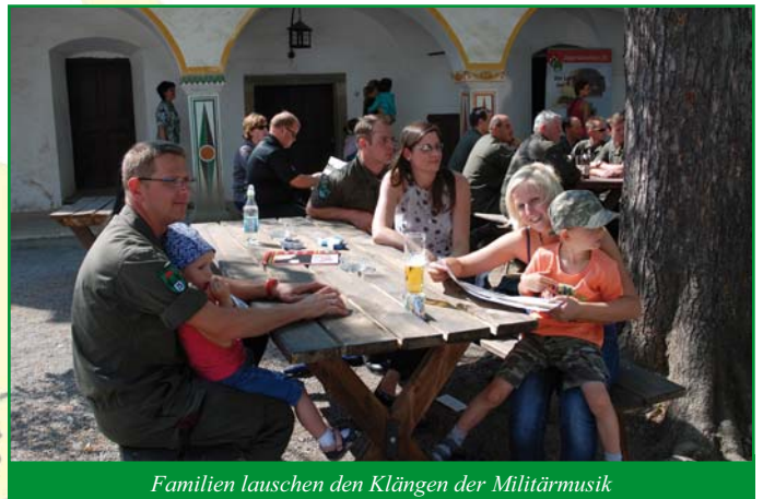
Familien lauschen den Klängen der Militärmusik

Das Jägerbataillon 25, als das Klagenfurter Hausbataillon, beauftragt mit der Traditionspflege, kann somit auf eine ehrenvolle Zeit zurückblicken. Die Kaserne Lendorf, in der das Jägerbataillon 25 stationiert ist, wurde zum Gedenken an Feld-