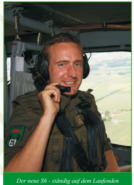
Der neue S6 - ständig auf dem Laufenden