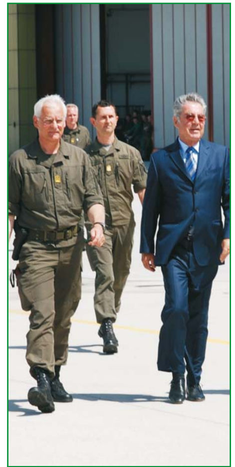
Der Bundespräsident mit dem Brigadekommandanten und dem Bataillonskommandanten