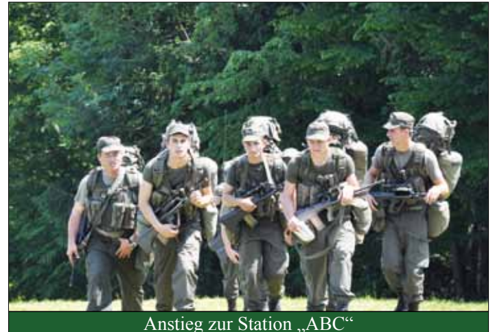
Anstieg zur Station „ABC“

als sehr positiv aus ihrer Sicht empfunden wurde.