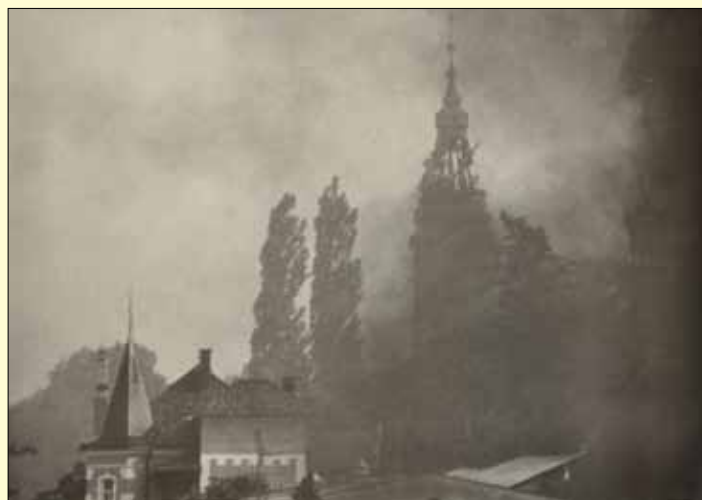
Zerstörter Kirchturm in Oberradkersburg

ihre Unabhängigkeit vom jugoslawischen Staatenverband. Die slo-