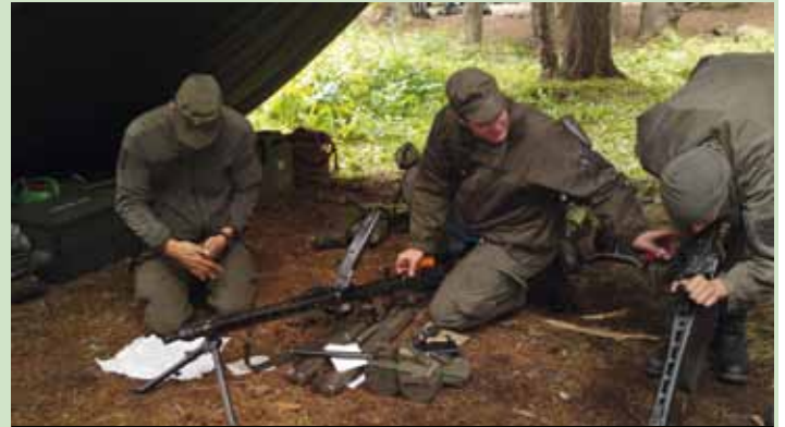
Instandhaltung im Feld ist von großer Bedeutung

men noch andere Stressfaktoren, wie Gefahr von Verwundung oder Tod, Trennung von Familie und Freunden, Ungewissheit, etc... Aus diesem Grunde muss auch das „Leben im Felde“ geübt werden, weil dies ansonsten zu einer weiteren Belastung für den Soldaten führt. Dank des schlechten Wetters konnten un-