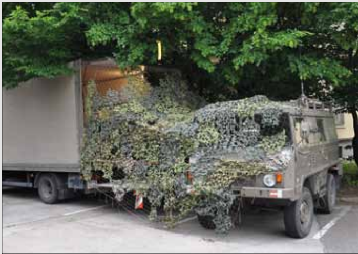
Unser improvisierter Gefechtsstand

wohl den Einsatz in der Verzögerung, als Reserve der Brigade und in weiterer Folge als Gegenangriffskraft vor. Das fiktive Übungsgelände