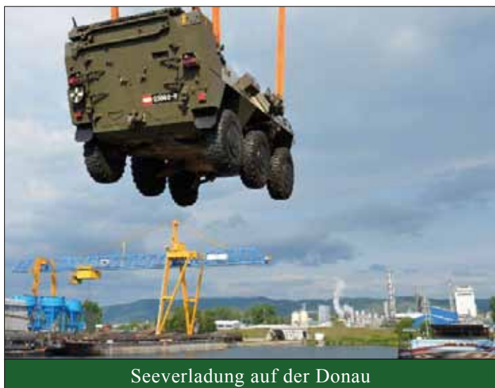
Seeverladung auf der Donau

träge erfüllt werden sollten. In den nächsten Tagen wechselte das Übungsschwergewicht von Versorgung auf den Kampf der verbundenen Waffen. Der Task Force stand als Gegner das Milizbataillon Burgenland gegenüber, welches als Ziel hatte, der Task Force den Zugang zu den Flüchtlingslagern zu verwehren und den Aufbau des Schutzes für die Versorgungskonvois und der eingesetzten Hilfsorganisationen zu verhindern. Bereits bei dem Versuch, den