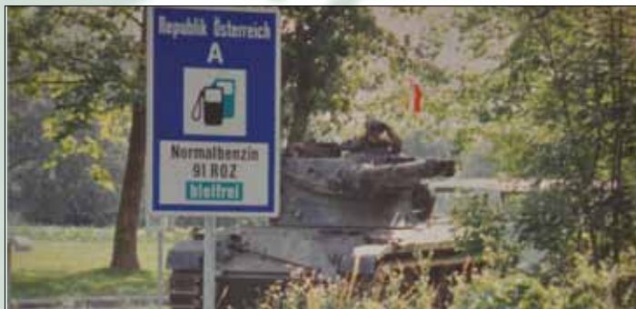
Lesen Sie mehr auf Seite 10 / 11