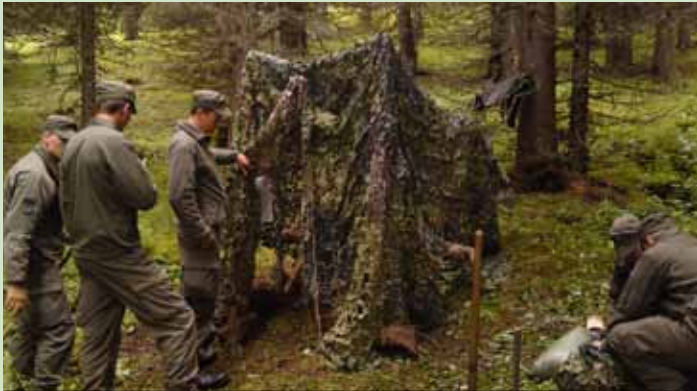
Soldaten beim Latrinenaufbau