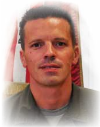
Zusammengestellt von Hauptmann Peter Schwarzinger