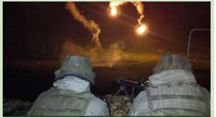
Scharfschießen bei Nacht

dienst die letzten Vorbereitungen für das Scharfschießen getroffen. Das Schießen mit den schweren Waffen am Freitag stellte wohl den Höhepunkt der Verlegung dar. Unter Ausnutzung der Leuchtgranaten wurde das Nachtschießen durchgeführt, welches einen eindrucksvollen Anblick bot.