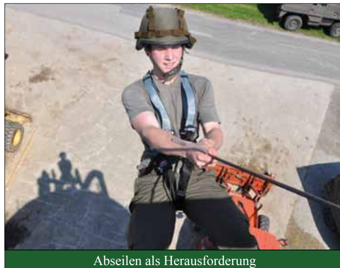
Abseilen als Herausforderung

Gruppe und stellten durch den hiermit erworbenen Erfahrungsgewinn eine Bereicherung für die Soldaten dar, welcher durchwegs