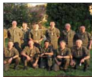
Teilnehmer in Toledo

Alle zwei Jahre werden durch den jeweiligen Vorstand der Vereinigung europäischer Unteroffiziere (A.E.S.O.R.) die Militärwettkämpfe in Form eines militärischen Achtkampfes durchgeführt. Nachdem zurzeit Spanien den Vorsitz der AESOR hat, wurden in der Zeit vom 06. bis 10. Juli 2011 die Wettkämpfe