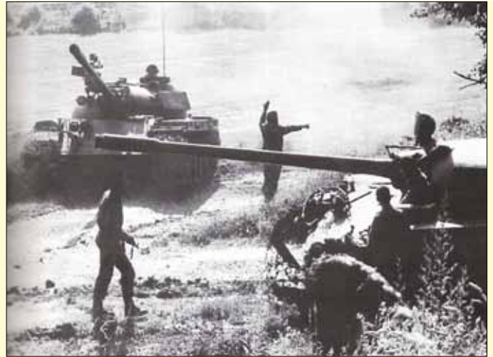
Panzer gehen in Stellung

Stellungen zum eigenen Schutz wurden ausgehoben. Aus diesen Deckungen wurden schwere Kampfhandlungen, vor allem im Bereich der Grenzübergänge in Bad Radkersburg und Spielfeld, von jungen wehrpflichtigen Staatsbürgern beobachtet. Gerade ihre Anwesenheit vermittelte der Bevölkerung ein Gefühl der Sicherheit. Unser kleines Heer gewann dadurch enorm an Ansehen und Popularität. Kritiker verstummten, die schwer in Frage gestellten Draken wurden jubelnd auf ihren