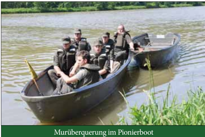
Murüberquerung im Pionierboot

Beteiligten mitunter ein hohes Maß an Selbstüberwindung und Durchhaltevermögen ab. Jedoch förderten sie andererseits das Zusammengehörigkeitsgefühl sowie die Kameradschaft innerhalb der