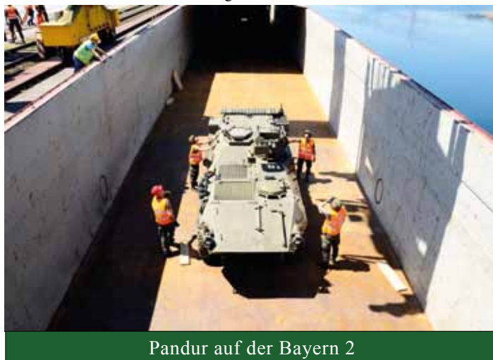
Pandur auf der Bayern 2