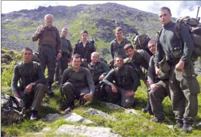
Lesen Sie mehr auf Seite 6