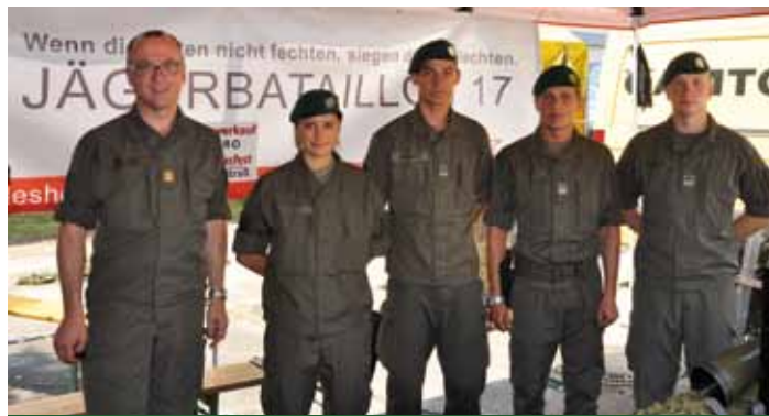
Militärkommandat mit Soldaten des Jägerbataillon 17

und militärisches Auftreten einen bleibenden Eindruck bei unseren Besuchern hinterlassen.