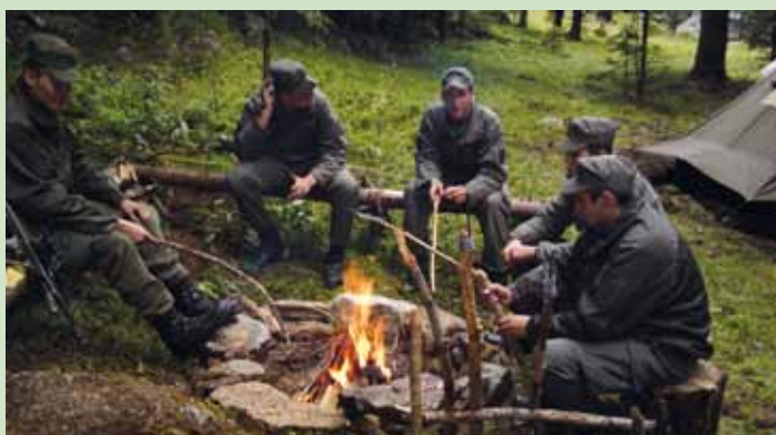
Zubereitung des Abendessens

platz Seetal um ein Feldlager zu errichten. Ziel der Ausbildung war es, die Feldverwendbarkeit der Soldaten herzustellen. Aus eigener Erfahrung wissen wir, dass im Auslandseinsatz Soldaten jederzeit und überall dort eingesetzt werden, wo sie benötigt werden. Ein Dach über dem Kopf, Toiletanlagen, Dusche, etc. gibt es dort in der Regel nicht und trotzdem muss ein Auftrag über längere Zeit ausgeführt werden. Hinzu kom-