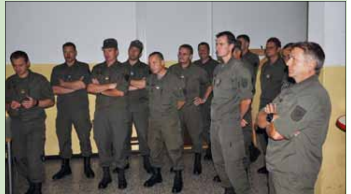
Teile des Bataillonskommandos bei der Einweisung

Die nächste Herausforderung ergab sich dadurch, dass der Server des Jägerbataillon 17 durch den S6-Unteroffizier vom Netz zu nehmen war und über das Vermittlungssystem kleiner Verband an anderer Stelle wieder in das Netzwerk einzubinden war.