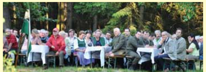
Zahlreiche Besucher folgten unserer Einladung

sehr stolz sind. Für mich als Kompaniekommandant war es eine Ehre, bei diesem Festakt die Ansprache zu halten und ich bedanke mich beim gesamten Kaderpersonal