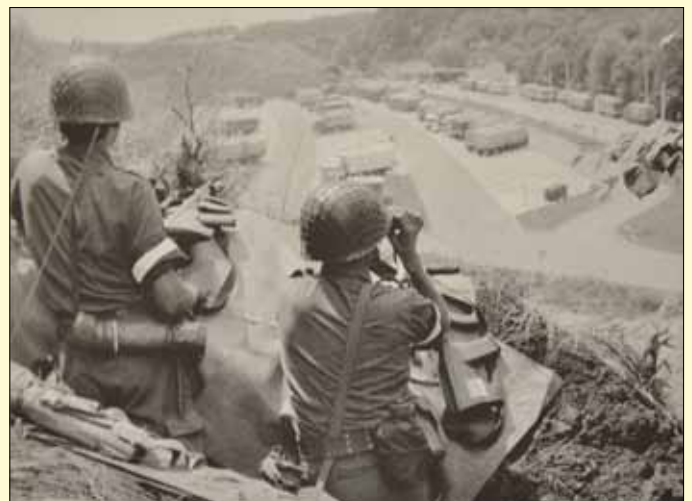
Beobachtungsstelle nahe Grenzübergang Spielfeld

Da sich die Situation südlich der Staatsgrenze beruhigte, wurden am 05. Juli die ersten Kräfte abgezogen. Es kam zu einer laufenden Kräfteumstrukturierung, sodass am 31. Juli 1991 der Sicherungseinsatz gem.