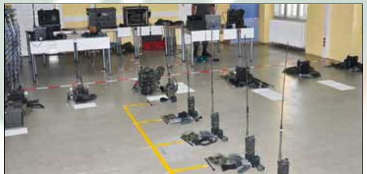
Lesen Sie mehr auf Seite 17