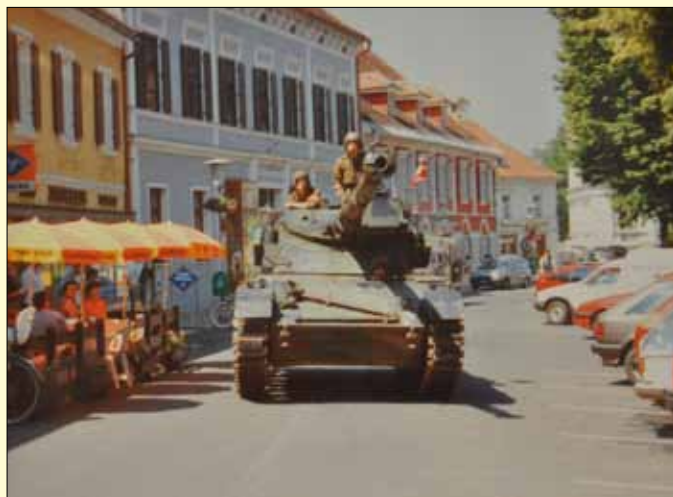
Jagdpanzer am Hauptplatz in Mureck

Am 25. Juni erklärten Slowenien und Kroatien