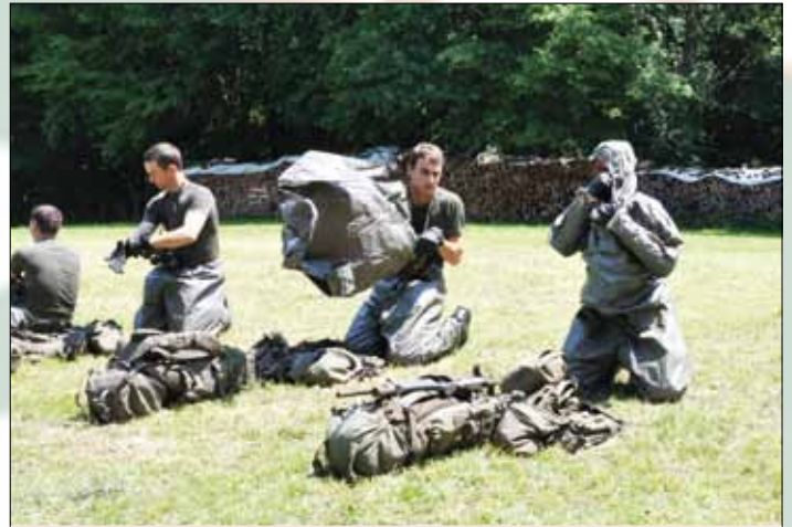
Lesen Sie mehr auf Seite 9