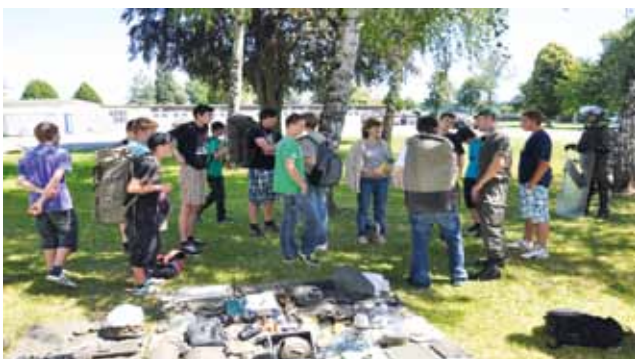
Schüler beim Begreifen der Ausrüstung