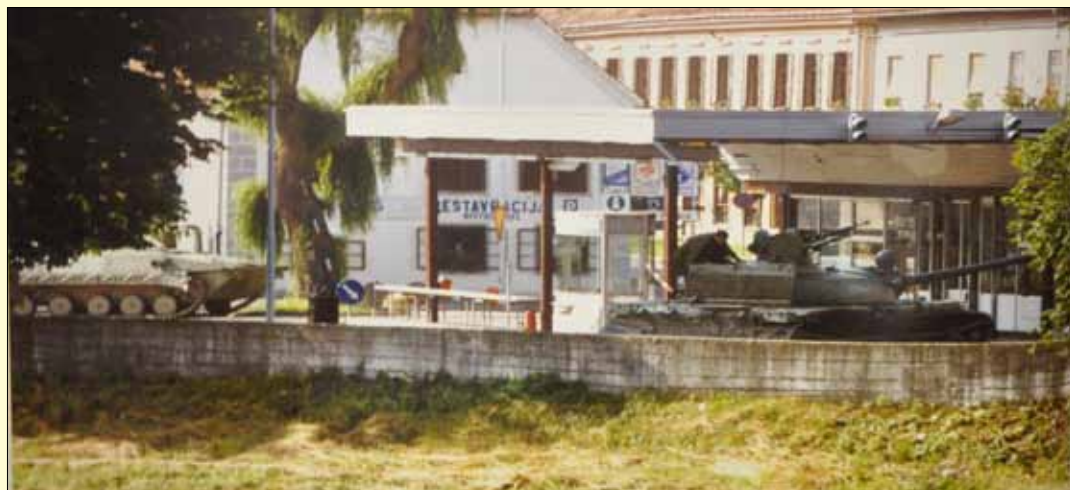
Kampfpanzer am Grenzübergang in Oberradkersburg