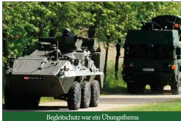
Begleitschutz war ein Übungsthema

gegnerischen Kräften ein Ultimatum zu stellen, kam es zu ersten Kampfhandlungen, welche aber durch den Einsatz der Panzerkompanie rasch unter Kontrolle der Task Force gebracht wurden. Da das Ultimatum erwarteter Weise nicht eingehalten wurde, trat die Task Force am Folgetag an, um die gegnerischen Kräfte aus dem Raum zu drängen.