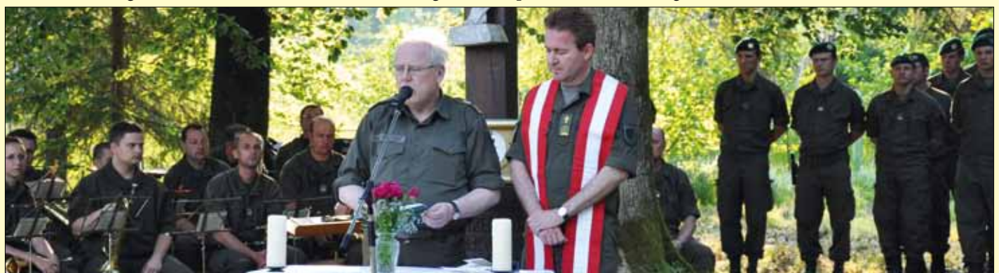
Heilige Messe mit den beiden Militärseelsorgern