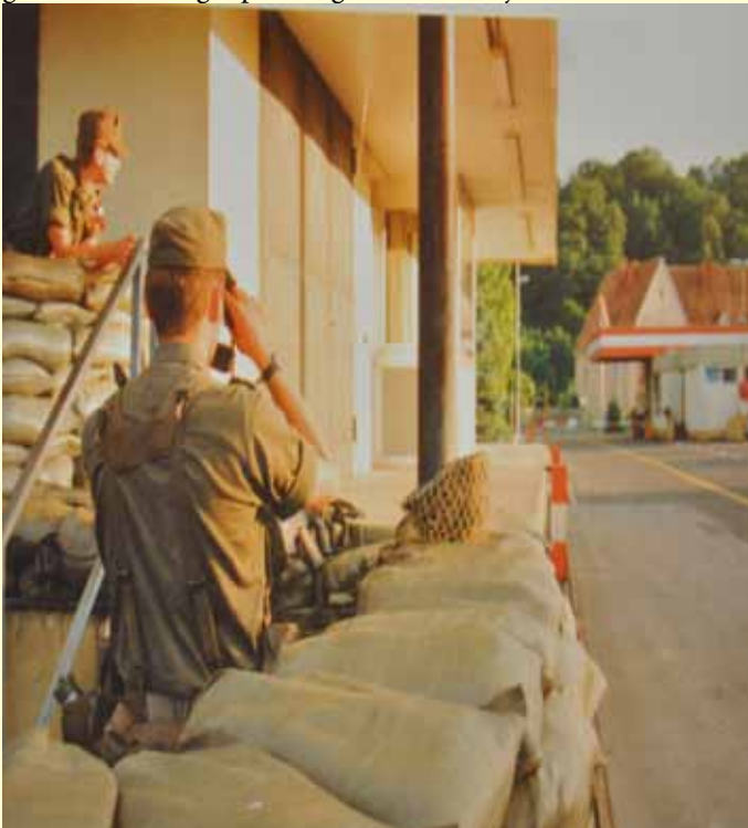
Grenzübergang Bad Radkersburg

und Überwachung sämtlicher Grenzübergänge zu Slowenien, Überwachung des Zwischengeländes und Kennzeichnung des Verlaufs der Staatsgrenze, Luftraumüberwachung im gesamten Grenzraum, Verhinderung von grenzübergreifenden