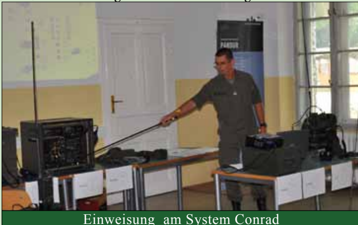
Einweisung am System Conrad

Hiezu war es erforderlich unser digitales Vermittlungssystem, das sogenannte Vermittlungssystem kleiner Verband, an den Truppenanschluskkasten im Kasernenareal anzuschließen. Dies geschieht in enger Zusammenarbeit mit dem Kommando Führungsunterstützung, da das Vermittlungssystem als mobile Komponente in das bestehende Netzwerk des Bundesheeres integriert wird.