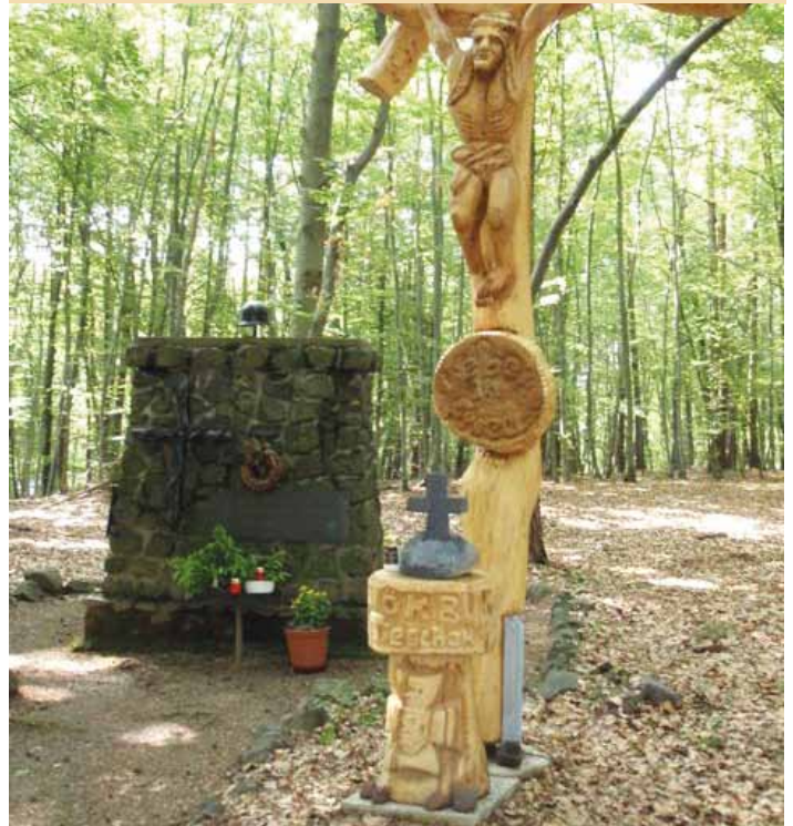
Denkmal mit Kreuz am Königsberg