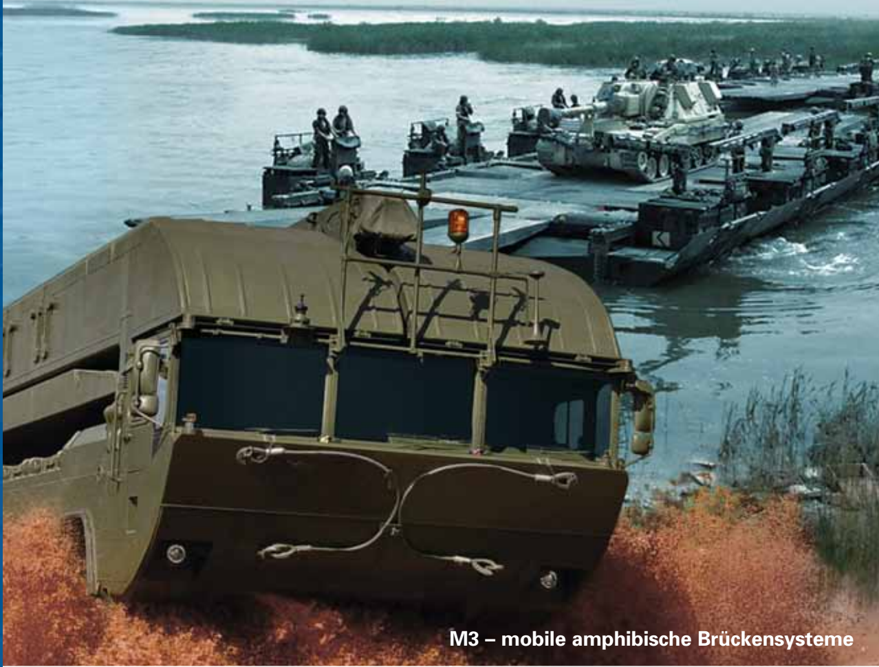
M3 – mobile amphibische Brückensysteme

Im Einsatz und bei Naturkatastrophen hervorragend bewährt, die mobilen amphibischen Brückensysteme und Fährenfahrzeuge von General Dynamics European Land Systems. Wenn Flüsse über die Ufer treten, Straßen unbenutzbar werden, Dämme zu brechen drohen und Menschen und Tiere evakuiert werden müssen, dann ist rasche Hochwasserhilfe vor Ort überlebenswichtig. Zum Beispiel mit der aus Aluminium gefertigten Amphibie M3, dem modernsten, schnellsten und effektivsten amphibischen Brücken- und Fährenfahrzeug in Bezug auf Flexibilität, Traglast, Aufbauzeit und Gelände- und Wasserbeweglichkeit.