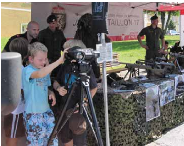
Begeisterung bei Jung und Alt im Rahmen des „Tages der Einsatzorganisationen“ vor dem Stift Vorau

bataillon 17 nahm an dieser Veranstaltung mit einer statischen Waffen- und Geräteschau teil. Kadersoldaten und Rekruten der Stabskompanie präsentierten Waffen und Ausrüstung, sowie Nachtsichtmittel und Bekleidung. Neben dem Jägerbataillon 17 waren auch das Militärkommando Steiermark und das Heerespersonalamt mit jeweils einem Informationsstand vertreten.