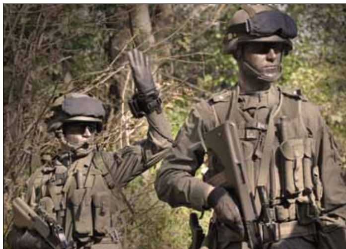
Den Erfolg aber mehr zu wollen, als andere, unterscheidet die Guten von den Besten

1991 befand sich das Regiment als erster Verband im Einsatz an der Jugoslawischen Grenze, 1997 wurden die Pandure implementiert, 1998 wurden in Straß die ersten weiblichen Soldaten aus-