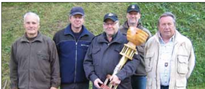
Die siegreiche Mannschaft des HSV Straß bei der diesjährigen Schießmeisterschaft der UOG Steiermark