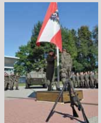
Flaggenparade im Rahmen des Traditionstages

Nach Beendigung der Veranstaltung fand ein gemeinsames Mittagessen für alle Anwesenden statt.