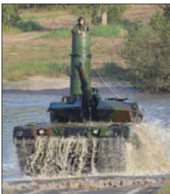
Der Panzerkommandant behält den Überblick

Als Ausgangslage für alle Stationen diente ein Szenario, in dem sich in einer Region zwei Konfliktparteien gegenüber standen. Diese Konfliktparteien wurden durch eine Friedenstruppe der Vereinten Nationen, welche eine demilitarisierte Zone errichtete, getrennt. Die Lage