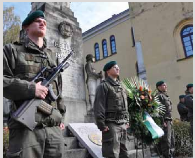
Gefallenenehrung vor dem Kriegerdenkmal in Straß