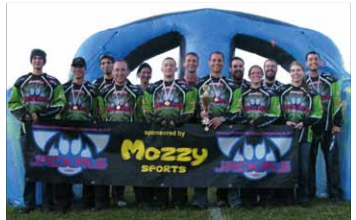
Auch 2011 wieder Staatsmeister. Die Paintballer „Jackals“ vom HSV Straß