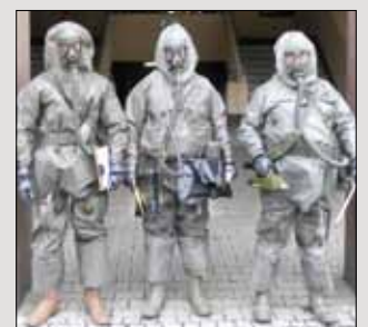
Ein Major und zwei Vizeleutnante während der Kaderfortbildung