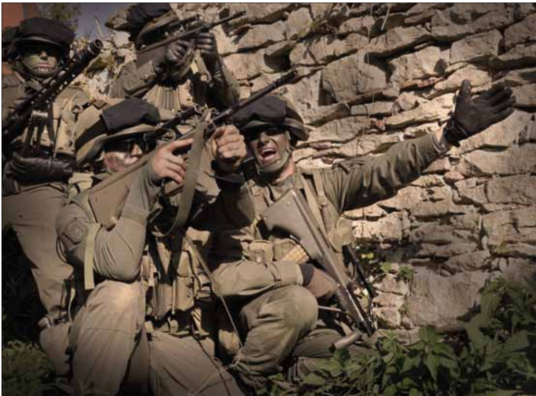
Kommandanten tragen eine besondere Verantwortung

Verbunden mit der wirklichen Welt zu sein – das sind unsere Soldaten wie sie in ihren Einsätzen stehen – ist wesent-