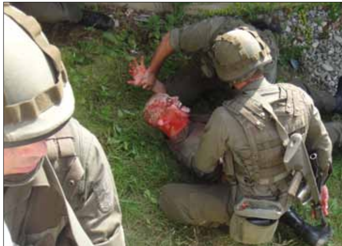
Versorgung eines am Kopf schwerverletzten Kameraden

Höhepunkt der Übung war aber zweifelsohne der Donnerstag. Weil die Lage im Einsatzraum eskaliert war, musste die Kompanie zum Angriff auf die Ortschaft ansetzen. Massive Verluste waren freilich vorprogrammiert. Dementsprechend gefordert waren die Kommandanten, die nicht nur den Angriff, sondern auch die Verwun-