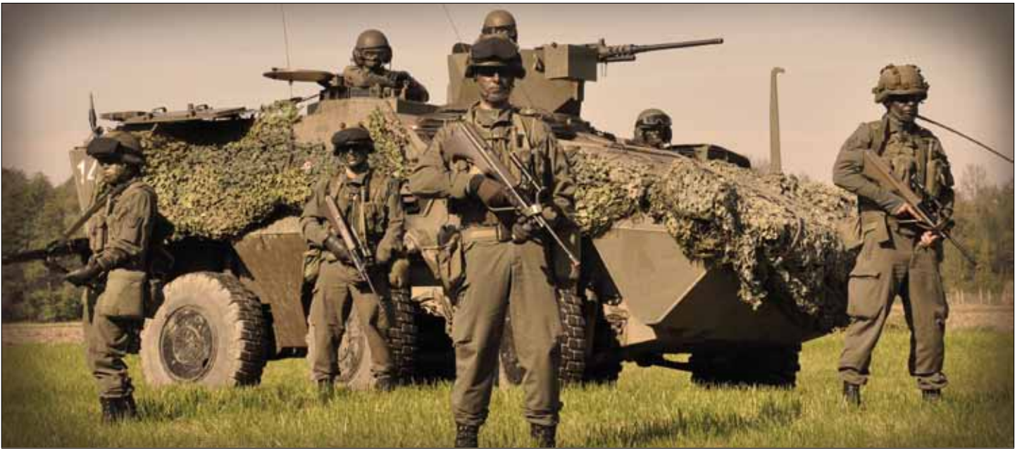
Straß. Schneidige Soldaten, verschworene Kompanien und ein umsichtiger Stab sind integraler Bestandteil des Verbandes

gebildet und es erfolgte die Teilnahme am ersten NATO/PfP-Manöver auf österreichischem bzw. slowenischem Staatsgebiet. 1999 wurde Straß mit der Einsatzvorbereitung für das erste KFOR-Kontingent beauftragt. Es ist fast müßig alle Besonderheiten, beginnend mit dem Einsatz an der ungarischen Grenze im Jahr 1956 bis zur Teilnahme an der EU-Battlegroup im Jahr 2011 aufzuzählen.