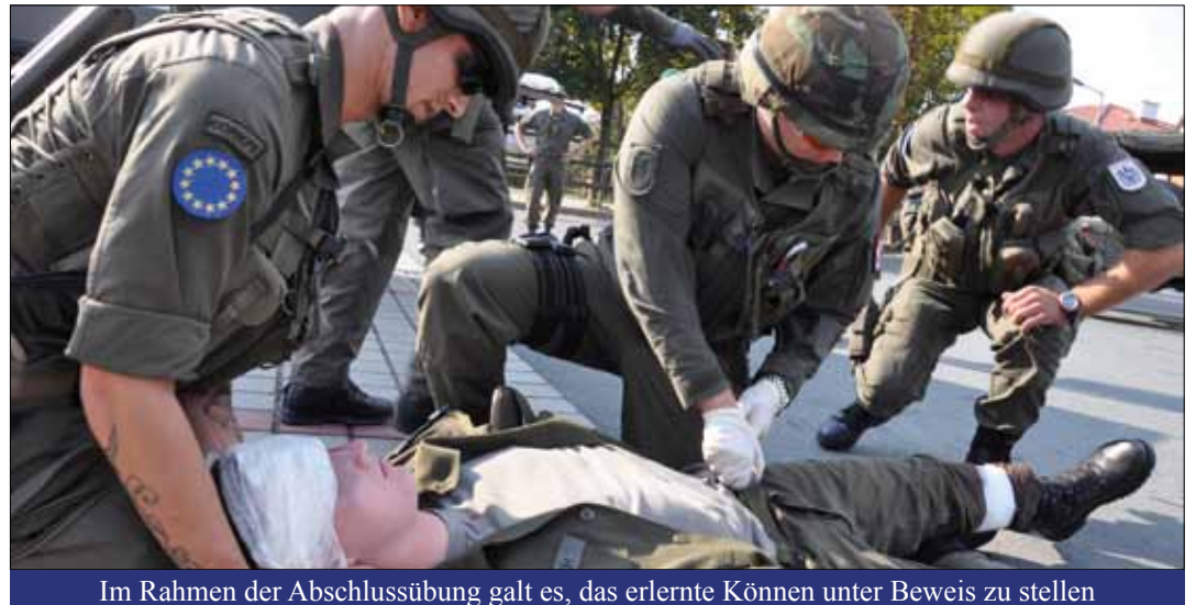
Im Rahmen der Abschlussübung galt es, das erlernte Können unter Beweis zu stellen

Die dritte Woche der Einsatzvorbereitung stand ganz im Zeichen der Ausbildung auf Zugsebene im Raum Straß. Die Züge übten neben dem Ordnungseinsatz auch den Schutz von Transporten und das Beziehen von Sicherungen im Falle von Evakuierungen oder der Gefangennahme von vermutlichen Kriegsverbrechern. Dabei wurden die Ausbildungsräume tageweise gewechselt, damit die Soldaten