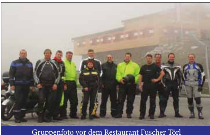
Gruppenfoto vor dem Restaurant Fuscher Törl

schaftstransportpanzer Pandur, Infanteriewaffen und Gerät, aber auch die Nachtsichtmittel vorgestellt. Abschließend fanden sich die außerordentlich wissbegierigen Schüler im Lehrsaal der 1. Kompanie ein, wo eine Fragestunde den Besuch beim Jägerbataillon 17 abrundete.