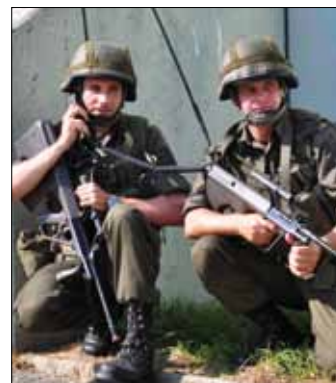
Mit vollem Einsatz waren die Milizsoldaten des Jägerbataillon 17 bei der diesjährigen Waffenübung bei der Sache