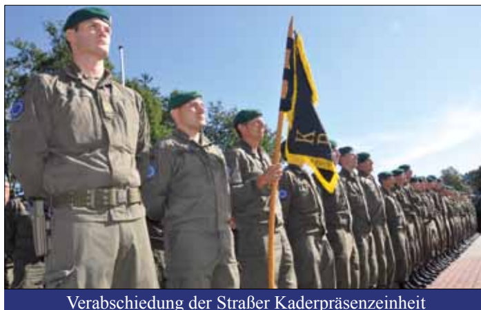
Verabschiedung der Straßer Kaderpräsenzeinheit

Im Dezember 2004 übernahm die EU die Führungsrolle für den militärischen Einsatz in Bosnien von der NATO. Aus SFOR wurde dadurch EUFOR/ALTHEA. Die Aufgabe der bis heute andauernden EU-Mission ist es, die lokalen Sicherheitskräfte bei der Gewährleistung eines sicheren und stabilen Umfeldes zu unterstützen. Die