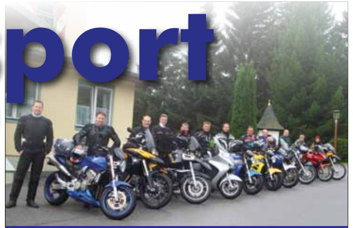
Bei uns werden auch die Motorräder ausgerichtet

Nach einer kurzen Pause und einigen Fotos ging es runter Richtung Heiligenblut und hier begann der Regen. Doch das Tagesziel war vor Augen und so konnte uns das nicht aus der Ruhe bringen. Wir kamen um