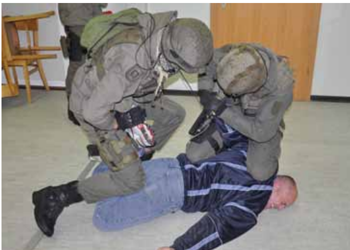
Schließen einer Person mit Unterstützung