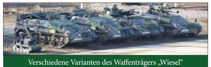
Verschiedene Varianten des Waffenträgers „Wiesel“