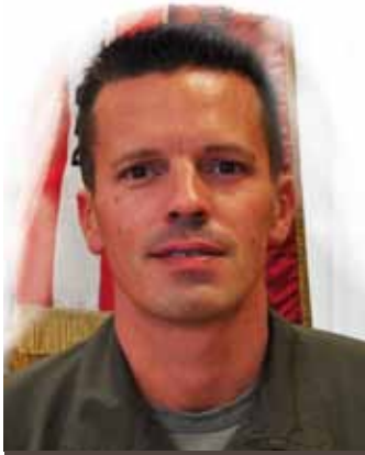
Zusammengestellt von Hauptmann Peter Schwarzinger