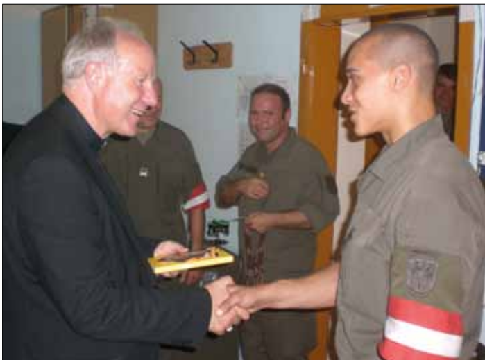
Besuch von Kardinal Christoph Schönborn

„Bei den Gewehren“ lautet der Leitspruch unserer Einheit, was bedeuten soll: Wir stehen bereit, wenn andere uns brauchen! Am 9. September standen wir „Bei den Gewehren“ um ihm die letzte Ehre zu erweisen.