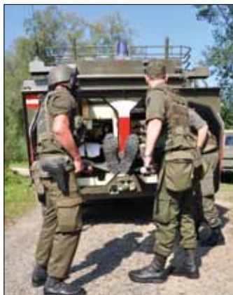
Verladung des Verletzten in den San-Pandur

Militärisches Neuland betrat die Milizsoldaten des Jägerbataillon 17 im Rahmen der Sonderwaffenübung vom 19. bis 23. September. Am Dienstplan stand nämlich die einsatzorientierte Selbst- und Kameradenhilfe im Kompanierahmen. Eine Spezialausbildung, in deren Genuss zuvor nur die Fähnriche der Theresianischen Militärakademie und das österreichische Kontingent der EU-Battlegroup 2011 kamen.