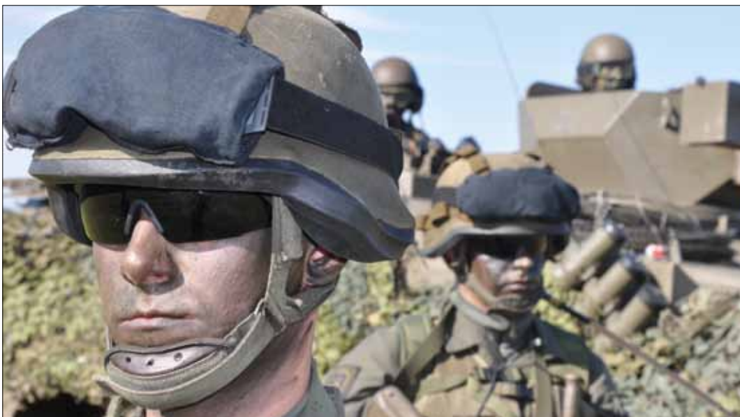
Der Unteroffizier. Solides Fachwissen, soziale Kompetenz und korrektes, militärisches Auftreten