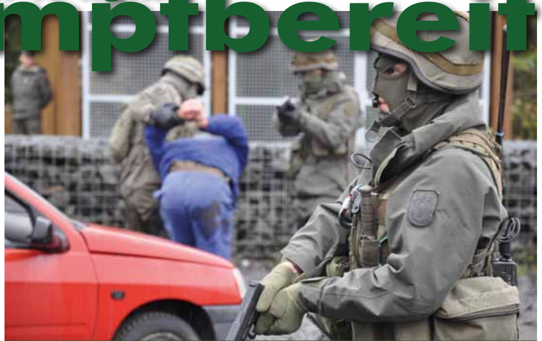
Ständiges Training ist unumgänglich

Da noch keine Stundenbilder für den „neuen“ Nahkampfinstruktorenkurs vorlagen, wurde dieser in gewohnter Form in der Dauer von zwei Ausbildungswochen durchgeführt. Die erste der beiden Wochen stand ganz im Zeichen des Nahkampfes