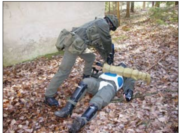
... wurde im Ortskampf ...

Bedingungen wurden alle erlernten Techniken zur Anwendung gebracht. Nach einer schriftlichen und mündlichen Prüfung am letzten Ausbildungstag mussten die Kursteilnehmer ihren Kampfeswillen in einem Abschlusskampf stellen. Obwohl