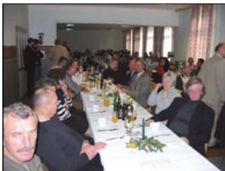
Kein freier Platz mehr im Speisesaal