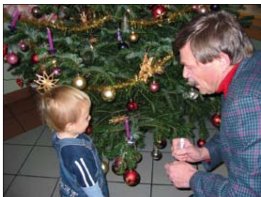
Ein besonderes Ereignis für unsere Kleinsten

den Händen des Weihnachtsmannes ihre Geschenke überreicht zu bekommen. Nach den besinnlichen