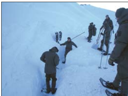
Vorbereitungen für das Scharfschießen: Ausbau des Gruppennestes