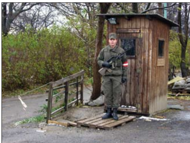
Sicherung des Zugsefchtsstandes durch einen Wachposten

Der permanente Schlafenzug und die 12-Stunden-Dienste drückten andauernd auf unsere Psyche und Physis. Trotz allem war die Eingewöhnungsphase rasch abgeschlossen, weil wir schon durch eine zweiwöchige Vorbereitung eingestimmt wurden. Im Großen und Ganzen brachte der Assistenzeinsatz vie-