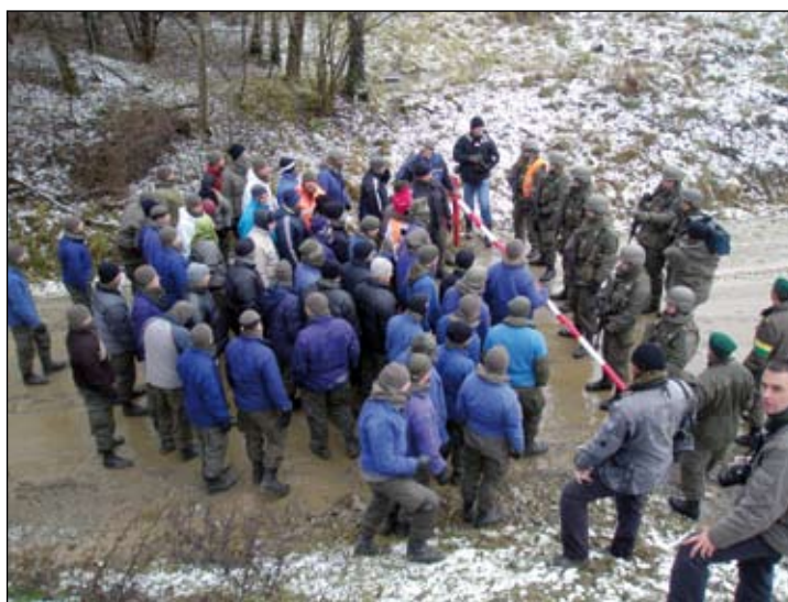
Gesprächsverhandlung mit Demonstranten

m ä ß i g e Kontrolle eines Zivilfahrzeuges, bei der es aber zu einem Sprengstoffzwischenfall mit verletzten Eigenen und Zivilpersonen kam. Vom reibungslosen Ablauf der Verwundetenver-