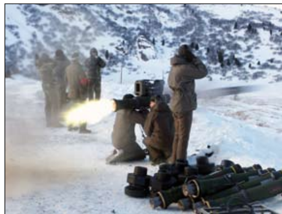
Feuertaufe beim scharfen Schuss mit dem Lenkflugkörper