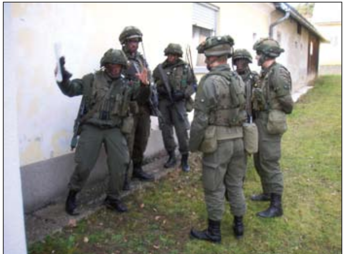
Jeder erhält genaue Anweisungen

Beurteilung der Lage und der Befehlsgebung. Nachdem der Plan der Durchführung der Kompaniekommandanten erstellt wurde, erfolgte die Befehlsausgabe an die Zugskommandanten. Ziel war es durch methodische Anwendung des Führungsverfahrens einen Entschluss zu fassen und diesen mit den Führungsgrundsätzen auch argumentieren zu können. Die Zugskommandanten erhielten anschließend den Auftrag eine Ausbildung mit ihren Gruppenkommandanten zu planen. Um die geplante Einsatzführung auch im Gelände real zu üben, wurde der KIOP-Zug aus Pinkafeld als Fülltruppe herangezogen. Alle an der Gefechtsübung teilnehmenden Soldaten wurden mit Duellsimulatoren ausgestattet. So konnten die Kompanien mit ihren Kadernsoldaten das zuvor im Gelände Besprochene unter wirklichkeitsnahen Bedingungen in die Praxis umsetzen. Eine Kaderfort-