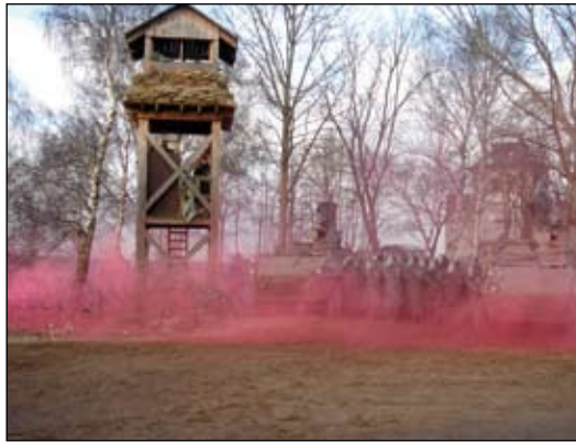
AUCON1/ORF bei der internationalen Übung auf dem GÜZ ALTMARK in Deutschland

Die Steigerung der Führungsfähigkeit des Kaderpersonals sowie des allgemeinen Informationsstandes wird vor allem im I. Quartal forciert. Bereits durchgeführt wurden Planspiele zur Anwendung der Führungsverfahren auf Ebene Bataillon und Einheit, Geländebesprechungen auf Ebene Gruppe bis zur Einheit, sowie das daran knüpfende Üben von Gefechts-