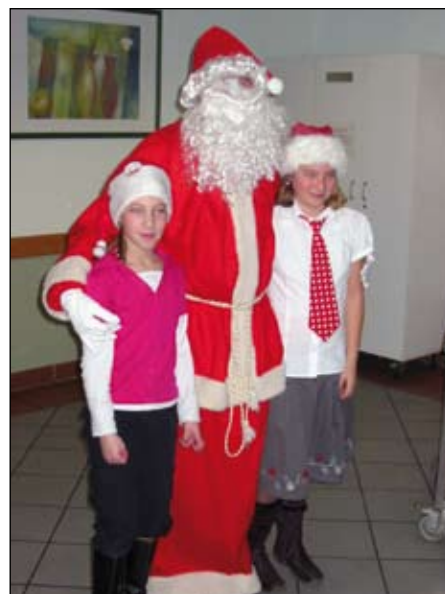
Die Verteilung der Geschenke erfolgte durch den Weihnachtsmann höchstpersönlich