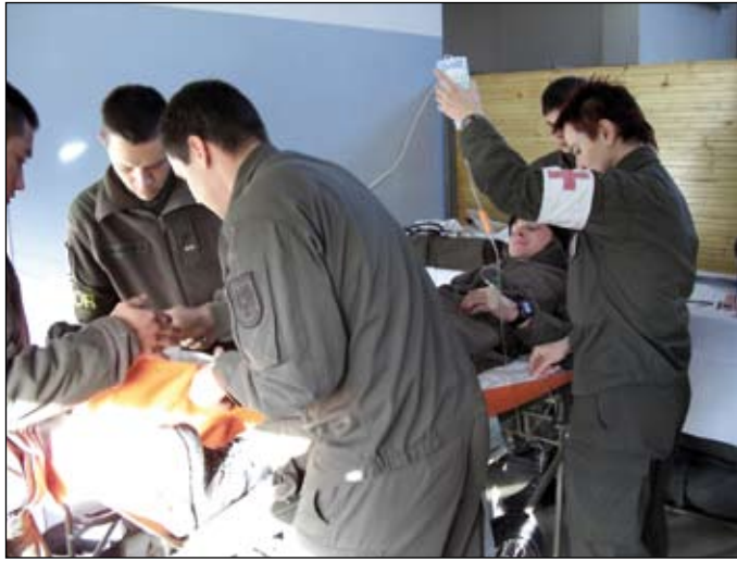
Unsere Ambulanzgruppe - Ein eingespieltes Team

Um die tatsächliche personelle und materielle Einsatzbereitschaft darzustellen, wurde der verminderte Sanitätszug der Stabskompanie evaluiert. Dabei stellte sich heraus, dass die personelle Einsatzbereitschaft größtenteils gegeben ist. Es sind jedoch materielle Defizite, die nicht im Bereich des JgB19 liegen, aufgetreten. Bei den Verlegungen mit der Task Force 18 (TF18) – Force Integration Training (FIT) und PACEMAKER 07 (PM07) – sind anfänglich Missverständnisse bezüglich des Tätigkeitsspektrums des (-)SanZg aufgetreten, da wir mit dem SanZg „Alt“ verwechselt wurden. Wir wurden mit der Führung des Krankenreviers im Camp St. Michael in Obersteiermark während des FIT betraut. Während