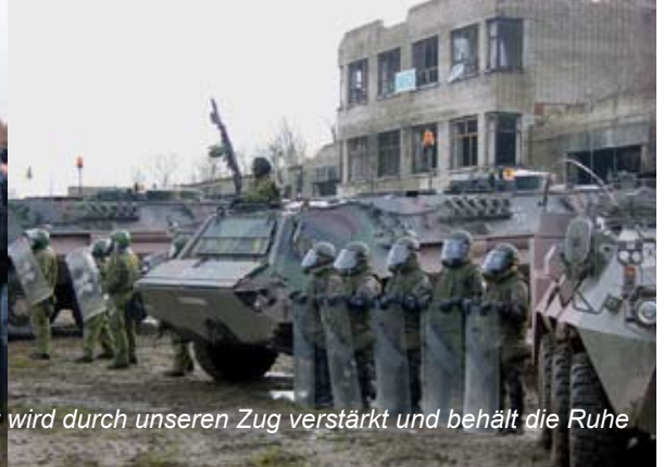
Wortgefechte am Beginn dieser Demonstration - Die Ordnungskraft wird durch unseren Zug verstärkt und behält die Ruhe