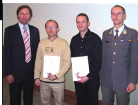
Verleihung der Verdienstmedaille