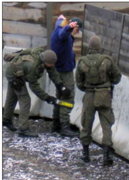
Keine Kontrollen ohne Sicherung

sorgung und der angeforderten Hubschrauberbergung unseres verletzen Kontrollpostens, der Kontrolle der infolge der Explosion rasch anwachsenden schau-