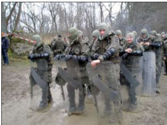
Kurze Verschnaufpause nach Auflösung der Sperrkette

Der JgZg/KPK aus Güssing nahm im November und Dezember 2007 gemäß seiner Zuordnung als Teil-einheit der 1. Kompanie der Task