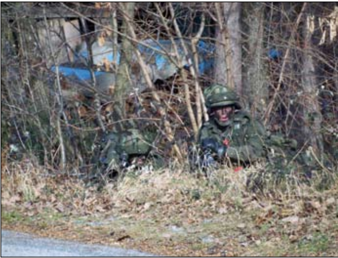
Sicherung nach dem Erreichen des Verfügungsraumes

Kaderfortbildungen in allen Bereichen (Taktik/Gefechtstechnik/Militärische Sicherheit/Personal) sind alljährlich fixer Bestandteil im Ausbildungskalender des JgB19. Für 2008 waren als Ausgangslagen für die taktische Kaderfortbildung die Lagen „Pandurenritt“ und „Thermenritt“ gewählt.