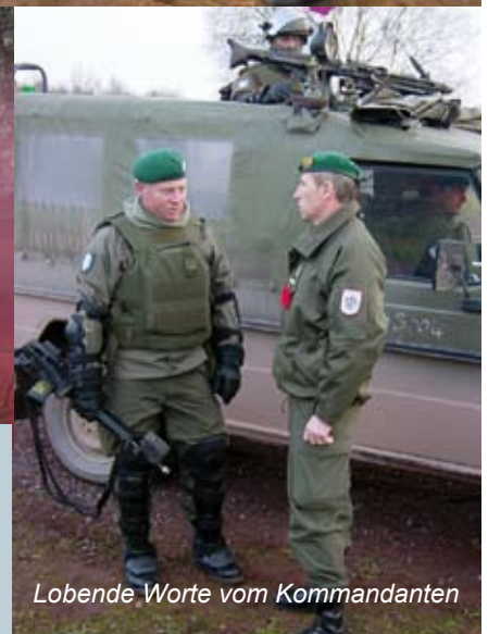
Lobende Worte vom Kommandanten

Das JgB19 stellt derzeit einen JgZg für das Operational Reserve Force-Bataillon unter der Führung der deutschen Bundeswehr. Vorgestaffelt wurde eine gemeinsame Ausbildung am GÜZ Altmark in Deutschland durchgeführt. Im Vordergrund stand die Schaffung der Kampfgemeinschaft mit den deutschen Kameraden. Die fordernden Übungsszenarien konnten durch unseren Zug bravourös gemeistert werden.