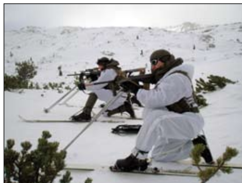
Anschlagart auf Schi: „Wirkung geht vor Deckung“

zu nehmen. Nach dem Ausfassen der erforderlichen Ausrüstung (Schi, Felle, Lawinengrundausrüstung usw.) erfolgten die ersten Gehversuche auf Heeresschi und auch die erforderliche Ausbildung am Lawinerverschüttetensuchgerät und im Sondieren. Rasch lernten alle ihre Waffen unter diesen erschwerten Bedingungen richtig zu führen, in Anschlag und auch