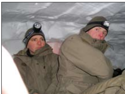
Kampfkrafterhaltung in der selbstgegrabenen Schneehöhle

Gemeinsam mit unserer Kaderpräsenz-einheit verbrachten wir die letzten zwei Jännerwochen am alpinen Übungsgelände Oberfeld. Ziel dieser beiden Wochen war es, die Gebirgsbeweglichkeit und die erforderliche Durchhaltefähigkeit unter den besonderen, hochalpinen Umfeldbedingungen zu verbessern und dabei vor allem keinem Soldaten die „Freude am Berg“