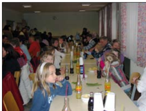
Zahlreiche Kinder waren bei der Weihnachtsfeier