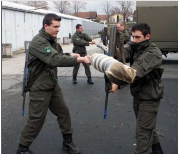
Was in der Kaserne drillmäßig geübt wurde ....

Bedingungen wurden alle erlernten Techniken zur Anwendung gebracht. Nach einer schriftlichen und mündlichen Prüfung am letzten Ausbildungstag mussten die Kursteilnehmer ihren Kampfeswillen in einem Abschlusskampf stellen. Obwohl