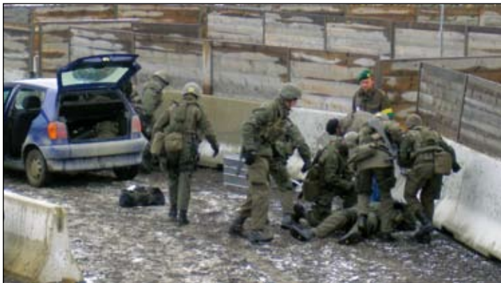
Versorgung eines Verwundeten am Checkpoint

Der JgZg/KPK aus Güssing nahm im November und Dezember 2007 gemäß seiner Zuordnung als Teil-einheit der 1. Kompanie der Task