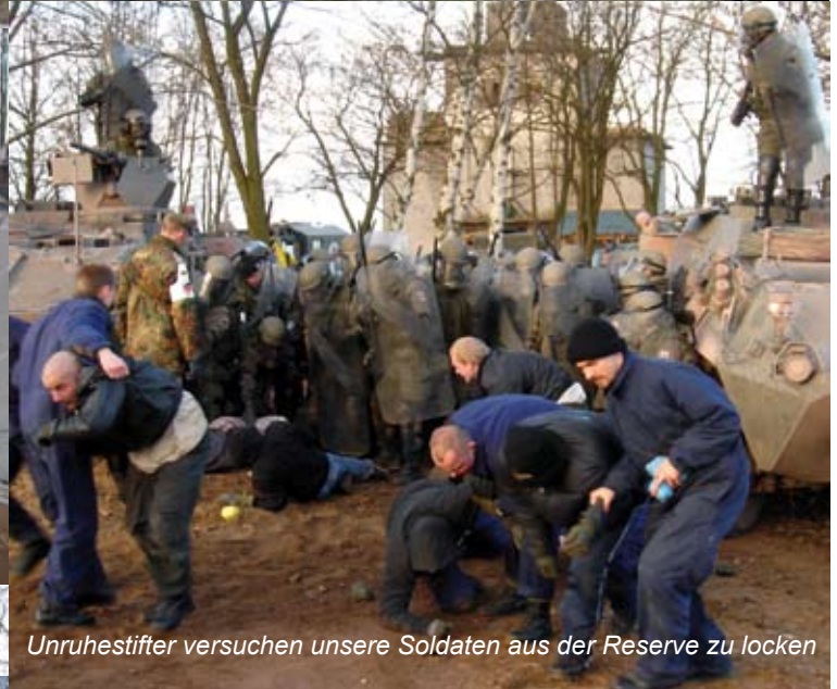
Unruhestifter versuchen unsere Soldaten aus der Reserve zu locken