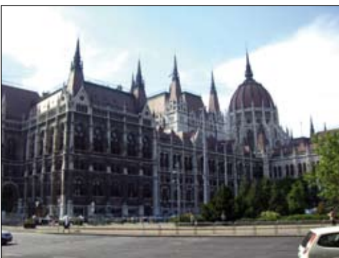
Schnapsschuss während des Spazierganges

Die Offiziere des JgB19 führten vom 18.01. - 19.01.08 einen Ausflug in die ungarische Hauptstadt durch. Ziel war es neben der Besichtigung von Budapest auch