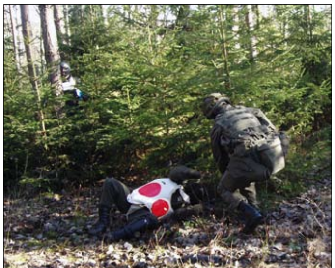
... und im Gelände angewendet.