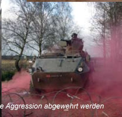
Durch entschlossenen Einsatz konnte die Aggression abgewehrt werden