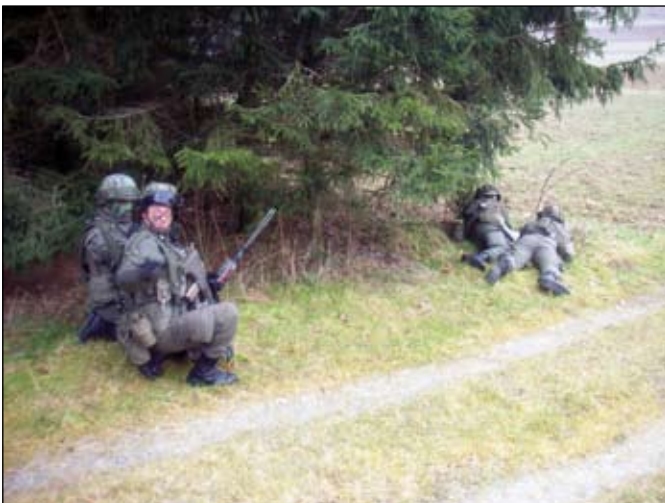
„Feuer und Bewegung“ - führen zum Erfolg

In der ersten Phase wurden die Lagen vom BKdt bzw. BKdtStv als Kaderfortbildung für die Kompaniekommandanten präsentiert. Die theoretischen Grundlagen für die jeweilige Einsatzart, taktische Zeichen und Führungsbegriffe wurden jeweils zu Ausbildungsbeginn in Form eines Unterrichtes mit aktiver Einbeziehung der Teilnehmer vermittelt. Nach dem Anspielen der Lage und der Präsentation der Ausgangslage wurde das militärische Führungsverfahren angewandt und dabei wurde jeder Beurteilungsschritt durch die jeweiligen Kommandanten schulmäßig durchgeführt. Die Bearbeitung und Verwendung der Handkarte war in weiterer Folge ein Schwergewicht im Rahmen der