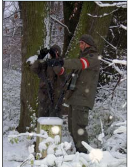
Überwachung des Grenzraumes bei jeder Witterung

le neue Erfahrungen, denn das Zusammenleben von 42 Soldaten über sieben Wochen auf engstem Raum ist für die überwiegende Mehrheit ein unbekanntes Kapitel.