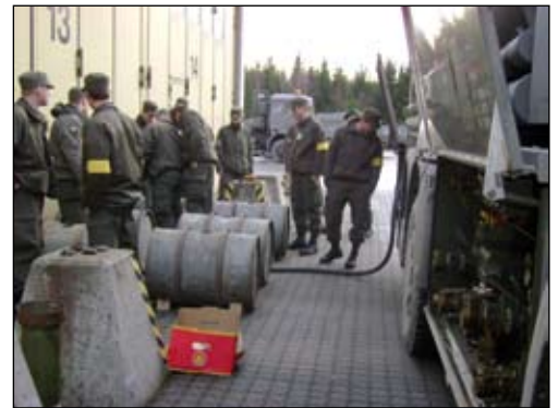
Die Betriebsmittelversorgung erfolgte mittels eines Tankkraftwagens

ca. 800 Soldaten aus verschiedenen Nationen. Die Betriebsmittelgruppe stellte die Feldbetankung der Heereskraftfahrzeuge und Heizaggregate mit einem Tankwagen sicher, welcher vom Versorgungsregiment 1 abgestellt wurde. Während dieser Übung wurden ca. 20.000 Liter Betriebsmittel benötigt. Die Versorgungsfahrten im Großraum Allentsteig wurden von der Transportgruppe mittels MAN und UNIMOG durchgeführt. Für die Sicherstellung der Reservebekleidung sowie für die Annahme und Rückgabe der Wäschesäcke war der WiUO/Bekl verantwortlich. Für den gesamten VersZg war die Übung dieser Größenordnung sehr fordernd, aber auch lehrreich. Die Überprüfungsergebnisse fielen durchwegs positiv aus, so sind wir bestens für die PACEMAKER 08 gewappnet.