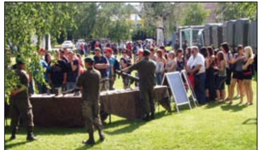
Das Interesse war enorm ...

Für Schüler aus höheren oder berufsbildenden Schulen stellt sich oft diese Frage: „Grundwehrdienst oder Zivildienst?“. Deshalb sieht das JgB19 es als Aufgabe, die Schulen in den Bezirken Oberwart, Güssing und Jennersdorf über das Bundesheer zu informieren. Nicht nur die Möglichkeit die Waffen, Funkgeräte und Ausrüstungsgegenstände hautnah zu erleben, sondern auch die Information über die Karrieremöglichkeiten beim JgB19