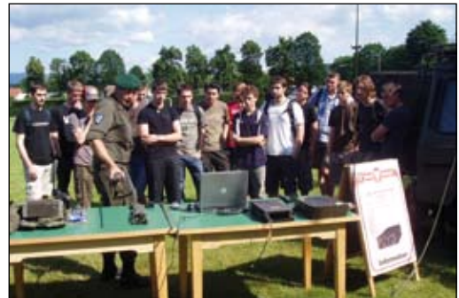
... und nach fachkundiger Vorstellung des Gerätes ...

Für Schüler aus höheren oder berufsbildenden Schulen stellt sich oft diese Frage: „Grundwehrdienst oder Zivildienst?“. Deshalb sieht das JgB19 es als Aufgabe, die Schulen in den Bezirken Oberwart, Güssing und Jennersdorf über das Bundesheer zu informieren. Nicht nur die Möglichkeit die Waffen, Funkgeräte und Ausrüstungsgegenstände hautnah zu erleben, sondern auch die Information über die Karrieremöglichkeiten beim JgB19