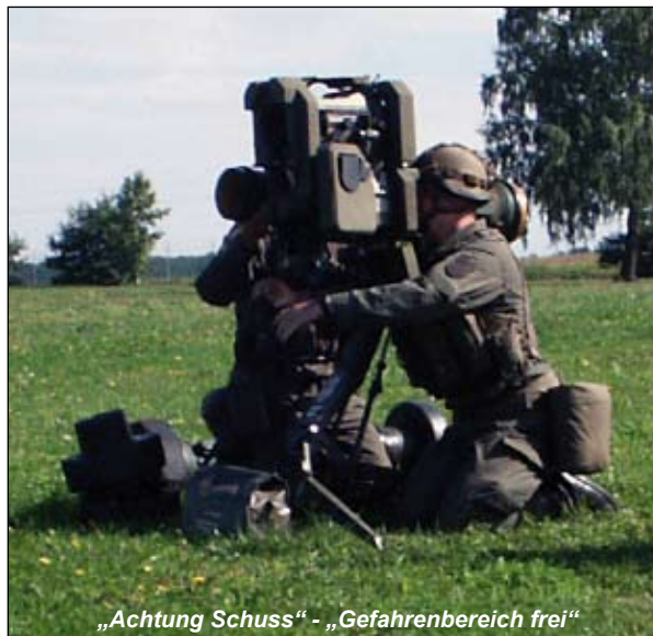
„Achtung Schuss“ - „Gefahrenbereich frei“

Am 12. August verlegten die Soldaten des PAL-Zuges auf die Seetaler Alpe zum Scharfschießen mit der Panzerabwehrenkwaffe PAL2000. Das JgB19 bekam sechs Lenkflugkörper (LFK) zur Verfügung gestellt, wobei fünf Kadetsoldaten und ein Grundwehrdiener schießen durften. Nach acht Wochen intensiver Ausbildung mit Schwergewicht Simulatorschießen wurde der beste Richtschütze für den scharfen Lenkflugkörper auserwählt. Die übrigen Grundwehrdiener durften sich als Ladeschützen bewähren. Am 13. August um 0900 Uhr begann das Scharfschießen. Nach dem Überprüfen der Waffe und der Lenkflug-