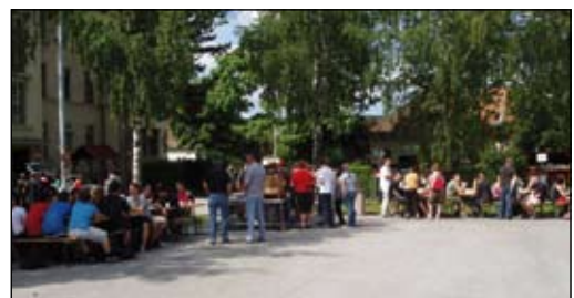
... wurde durch die Truppenküche verköstigt!