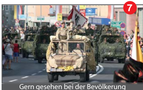
Gern gesehen bei der Bevölkerung