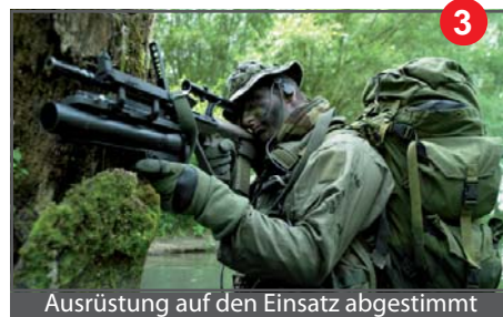
Ausrüstung auf den Einsatz abgestimmt