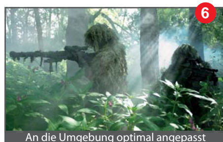
An die Umgebung optimal angepasst