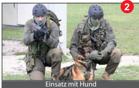
Einsatz mit Hund