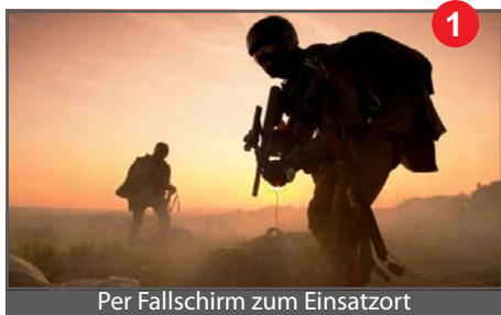
Per Fallschirm zum Einsatzort