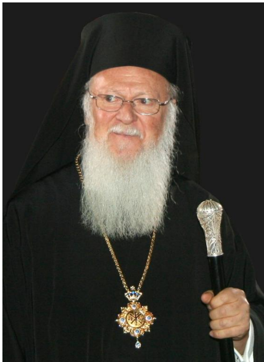
Bartholomäus I., Patriarch von Konstantinopel, 2007