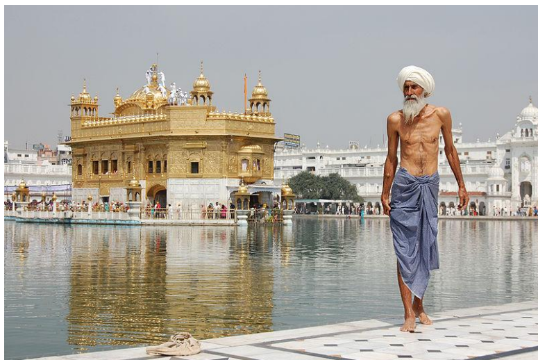
Sikh-Pilger beim Goldenen Tempel in Amritsar (Indien) nach einem rituellen Bad

Der Erhalt und der Eigenwert der Natur genießt im Sikhismus sehr hohen Stellenwert. Schon allein aus jener Philosophie heraus, dass in allem Sein, und in allen Wesen „Der Schöpfer“ weilt.