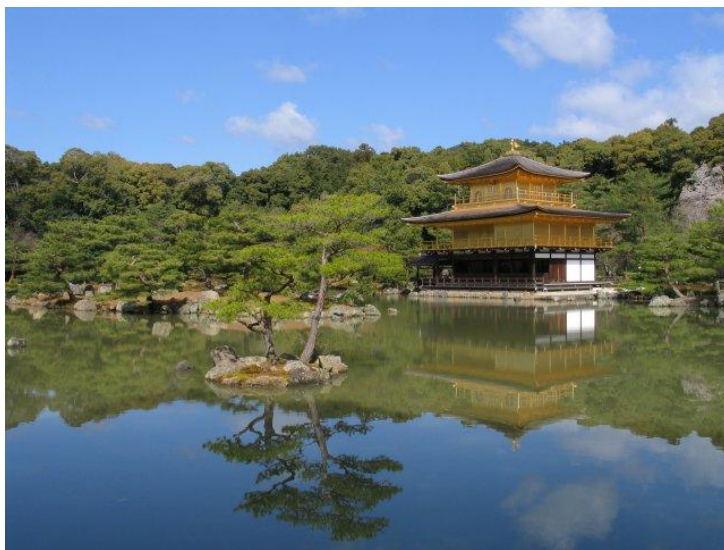
Kinkaku-ji Temple, Kyoto