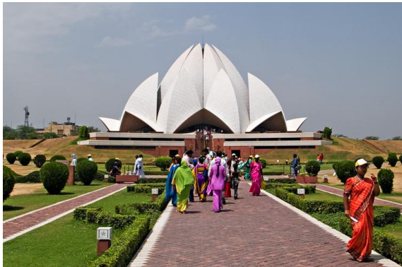
Haus der Andacht in Neu-Delhi, Foto: nomo/ Michael Hoefner

Sehr geehrte Damen und Herren, Erlauben Sie mir zunächst, den geschätzten Organisatoren dieser Veranstaltung herzlich dafür zu danken, dass sie dem Thema „Natur und Umwelt in verschiedenen Religionen...“ ein eigenes Seminar widmen und dazu Vertreter von Religionen eingeladen haben.