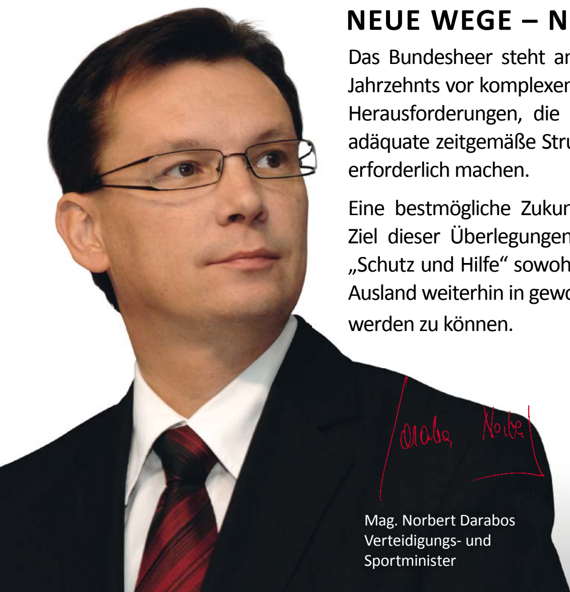
Mag. Norbert Darabos Verteidigungs- und Sportminister

Eine bestmögliche Zukunftsperspektive ist das Ziel dieser Überlegungen, um unserem Motto „Schutz und Hilfe“ sowohl im Inland als auch im Ausland weiterhin in gewohnter Qualität gerecht werden zu können.