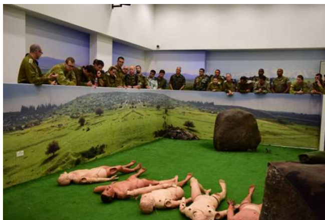
Simulationsraum für die Ausbildung von Sanitätern und Selbst- und Kameradenhilfe

In diesem Zusammenhang wurde ein weiterer interessanter Aspekt der IDF bezüglich zeitgemäßer lerndidaktischer Ansätze zur Vermittlung von militärischen Kompetenzen mittels Lernmittel, wie virtual-reality/e-learning/computerunterstützte Simulation etc., unter anderem für die Wehrpflichtigen- generation „Z“ dargestellt. Beim Einsatz der modernen Lernmittel und -techniken geht es vordergründig nicht um eine Kosten- bzw. Zeitreduktion, sondern primär um eine Effizienzsteigerung der Handlungssicherheit der Soldaten im Sinne der Erhöhung der Sicherheit und des militärischen Könnens.