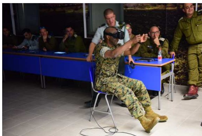
Virtual Reality Ausbildung im Bereich der Instandsetzungsausbildung

Ergänzend zu den fachlichen Inhalten des Kurses, kann man abschließend das multinationale Kursklima ansprechen, das man als sehr wertschätzend und kameradschaftlich ansprechen kann. Der Kurs bietet eine exzellente Möglichkeit die IDF, im Speziellen in logistischer Hinsicht, näher kennenzulernen und sich mit diesem spezifischen geostrategischen Raum vertraut zu machen.