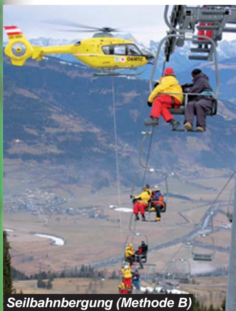
Seilbahnbergung (Methode B)

Mit dem Hubschrauber wird die Bergemannschaft auf die Gondel/Sessel verteilt und das Abseilen der Personen erfolgt auf den Boden, wo diese dann von weiteren Rettungskräften an einen sicheren Ort gebracht werden.