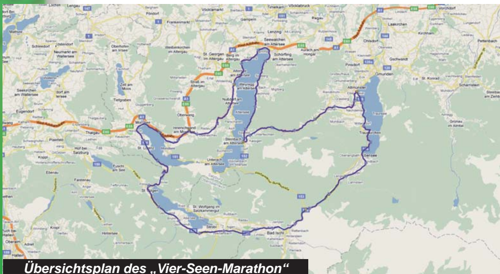
Übersichtsplan des „Vier-Seen-Marathon“