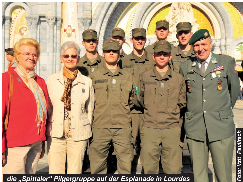
die „Spittaler“ Pilgergruppe auf der Esplanade in Lourdes

Höhepunkt der Wallfahrt war einmal mehr die abendliche Marienprozession. Neben den Licht- und Raucheffekten zeichneten zehntausende brennende Kerzen dabei ein eindrucksvolles Bild. Begleitet wurde die Prozession vom stimmkräftigen Chor „Ars Musica“ aus Wien und der Militärmusik aus Österreich. Und mit 45.000 Teilnehmern verzeichnete die Veranstaltung dieses Jahr einen neuen Besucherrekord. Der Sonntag war bei geprägt vom Ausflug nach Saint Jean de Luz und nach Biarritz und natürlich von der Österreichischen Abschlussfeier. Nach der Fahrt durch die Camargue an die Cote D'Azur und einer längeren Pause in Cassis erreichte die Pilgergruppe nach einer weiteren Nachtfahrt müde, aber glücklich und zufrieden, die Heimat.