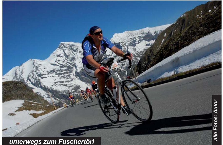
unterwegs zum Fuschertörl

Das Ziel, welches ich mir für alle Veranstaltungen stellte, war, nicht Letzter zu werden und Spaß daran zu haben - also nicht unbedingt bis zum Erbrechen Bestleistungen zu erbringen. Die Strecken sorgen von alleine für die „gesun-