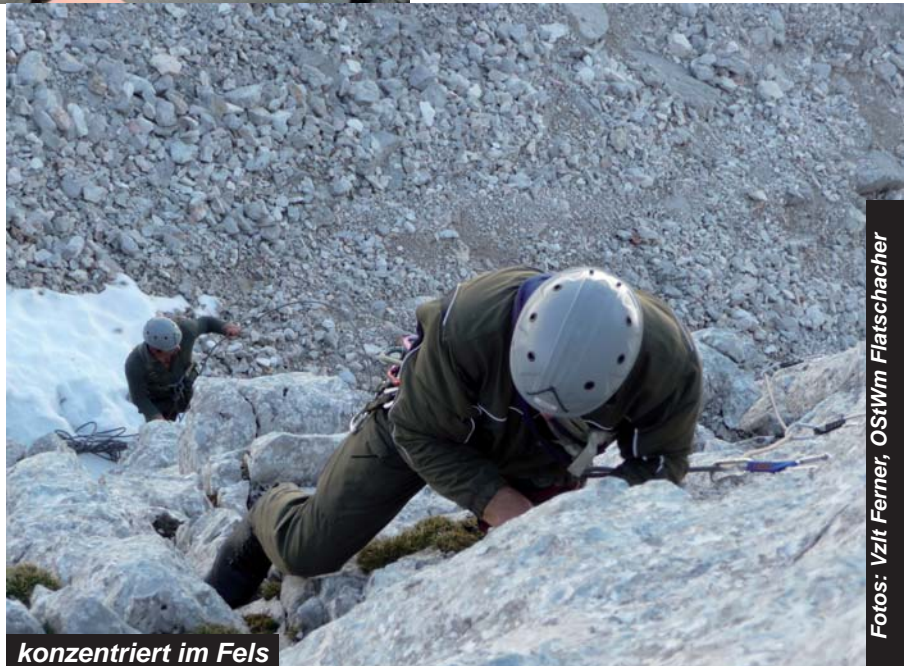
konzentriert im Fels

nen. Die Themen des ersten Ausbildungstages waren durch den Zeitverlust auf eine Geländeeinweisung und die Trittschulung beschränkt. Der zweite Ausbildungstag diente der Angleichung und Erweiterung des Wissens und Könnens in den Bereichen Gebirgsausrüstung, Verankerungen, Seiltechnik und, vor allem, dem „Einklettern“ in den zahlreich vorhandenen Toprope - Kletterrouten der Klettergärten. In den darauffolgenden zwei Tagen wurden verschiedene Klettertouren und, von den nicht so versierten Bergsteigern, Wandertouren durchgeführt. Zu unseren Zielen gehörten unter anderem auch der Besuch und die Abhaltung einer Gedenkminute bei der Gedenktafel von Herrn Vizeleutnant Horst Jelovcan, einem ehemaligen 26er. Der letzte Ausbildungstag diente noch der Begehung