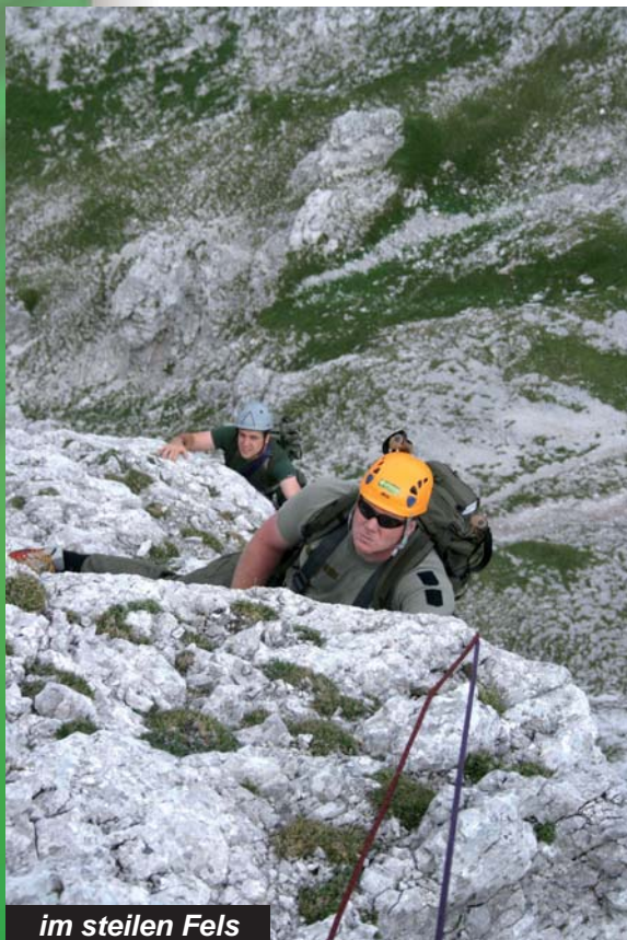
im steilen Fels

Die 2. Jägerkompanie/JgB26 wählte als Ausbildungsort die Lienzer Hütte. Nach einer Eingewöhnungstour durch die Pirkacher Klamm feierte man bereits am Dienstag einen ersten Gipfelsieg am Keeskopf (3081 Meter). Am Mittwoch stand man am Gipfel des Hochschobers (3240 Meter) und am Donnerstag auf dem „Matterhorn Osttirols“, der Glödis (3206 Meter). Ein Abstecher auf die