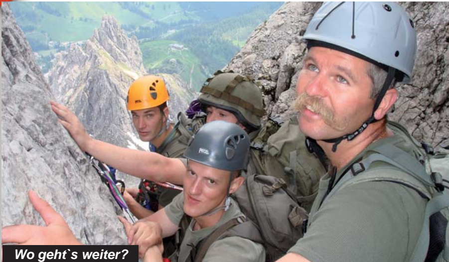
Wo geht's weiter?

nen. Die Themen des ersten Ausbildungstages waren durch den Zeitverlust auf eine Geländeeinweisung und die Trittschulung beschränkt. Der zweite Ausbildungstag diente der Angleichung und Erweiterung des Wissens und Könnens in den Bereichen Gebirgsausrüstung, Verankerungen, Seiltechnik und, vor allem, dem „Einklettern“ in den zahlreich vorhandenen Toprope - Kletterrouten der Klettergärten. In den darauffolgenden zwei Tagen wurden verschiedene Klettertouren und, von den nicht so versierten Bergsteigern, Wandertouren durchgeführt. Zu unseren Zielen gehörten unter anderem auch der Besuch und die Abhaltung einer Gedenkminute bei der Gedenktafel von Herrn Vizeleutnant Horst Jelovcan, einem ehemaligen 26er. Der letzte Ausbildungstag diente noch der Begehung