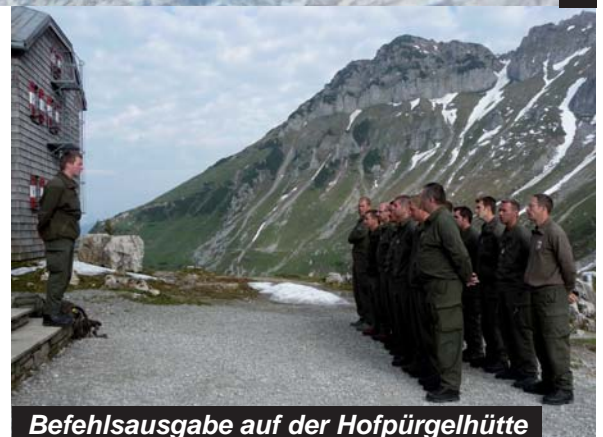
Befehlsausgabe auf der Hofpürgelhütte

Zurückblickend war es eine sehr lehrreiche und teilweise auch fordernde Woche, die