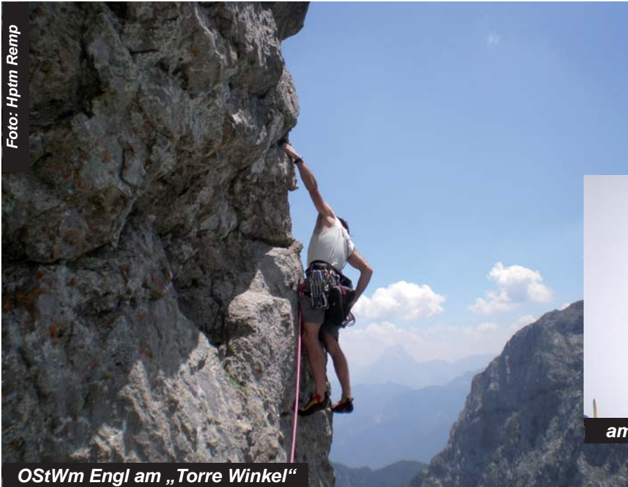
OStWm Engl am „Torre Winkel“

Wangenitzseescharte am Freitag ließ die Alpinausbildung der 2. Kompanie erlebnisreich und unfallfrei zu Ende gehen.