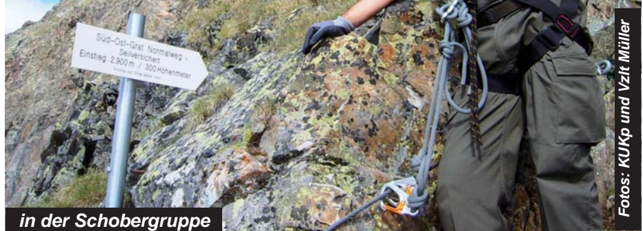
in der Schoberggruppe

und Mähderhütte - also genug für den ersten Tag. Am zweiten Tag fuhren wir ins Plöckengebiet, wo auf Grund der enormen Hitze die Vorgabe Polinik nicht erreicht wurde. Anstelle dessen entschied man sich für die Überschreitung vom Freikofel über den Kleinen Pal, einschließlich des Rundweges im Freilichtmuseum Plöckenpass und zurück über den Landsturmsteig zum Plöckenhäus. Zwei weitere Touren im Bereich des oberen Drautales und die Begehung des Klettersteiges „Bella Vista“ auf die Hohe Leier komplettierten die Ausbildung der „Wandergruppe 26“.