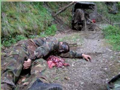
Überwinden von Hindernissen und Gefechtsdienst