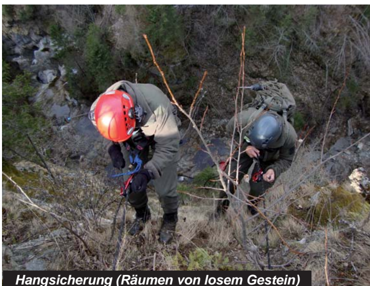
Hangsicherung (Räumen von losem Gestein)