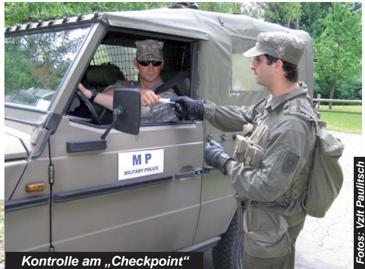
Kontrolle am „Checkpoint“

men eines 24 Stunden Kampftages in den Räumen TÜPI Marwiesen, Koflachgraben, Zlaner Stausee und Egelsee statt.