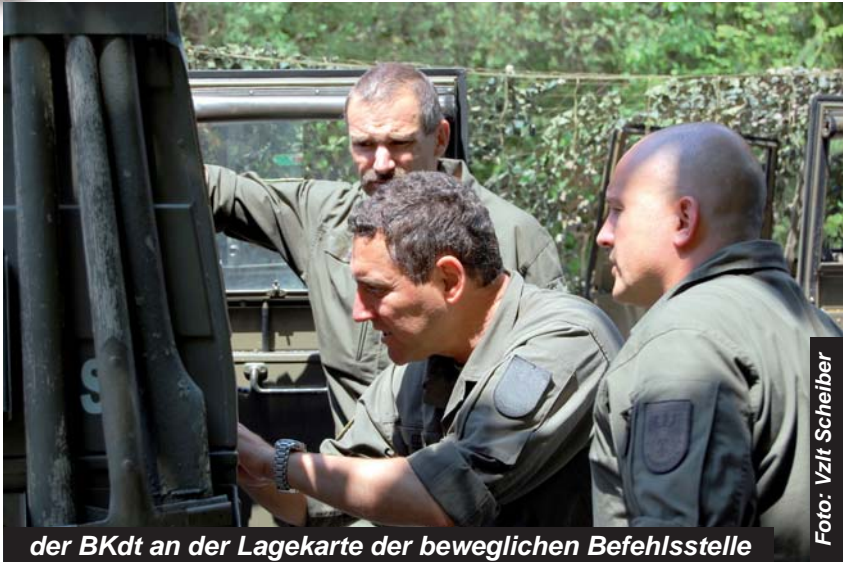
der BKdt an der Lagekarte der beweglichen Befehlsstelle