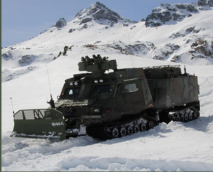
Erhöhte Mobilität durch das Übersneefahrzeug Hägglunds BvS10AUT