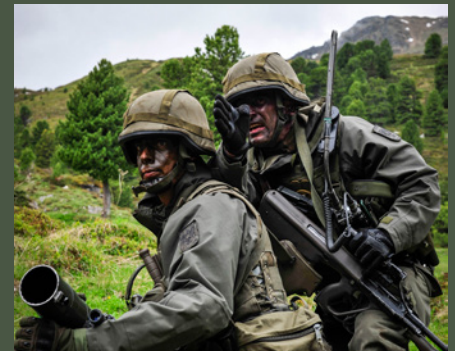
Gebirgsjäger im Einsatz