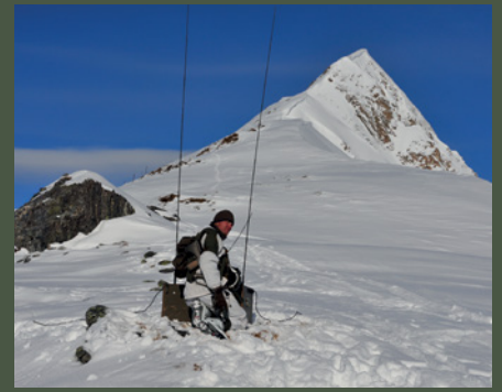
Führungsunterstützung im Gebirge