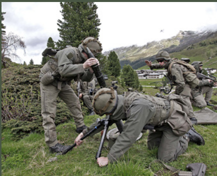
Granatwerferfeuer im Gebirge hochmobil und effizient