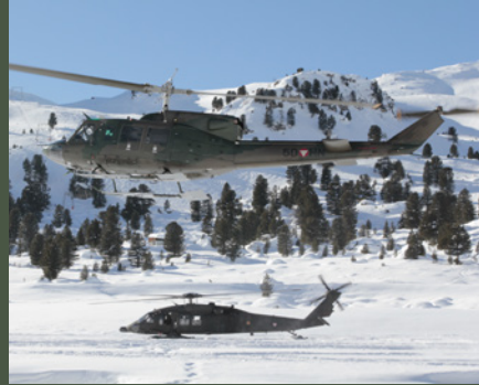
Unterstützung aus der Luft ist im Gebirge unerlässlich