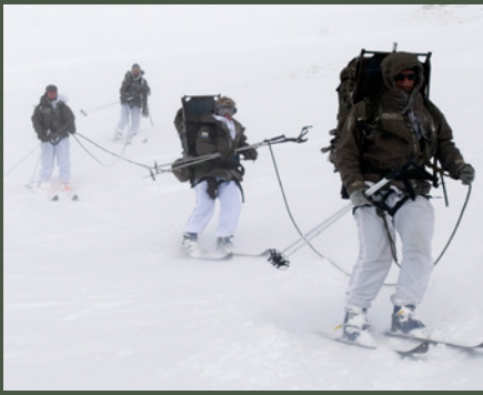
Skibeweglichkeit ist eine Basis für den Einsatz im Gebirge