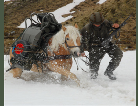
Tragtiere sind ein unverzichtbarer Bestandteil der Transportkette im Gebirge