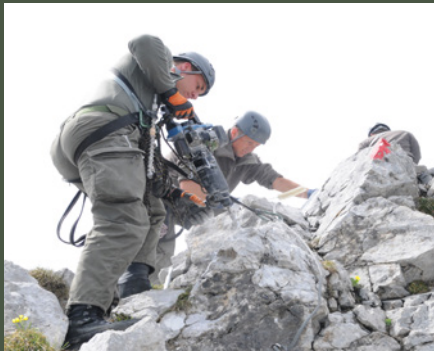
Gebirgspioniere beim Stegebau im Hochgebirge