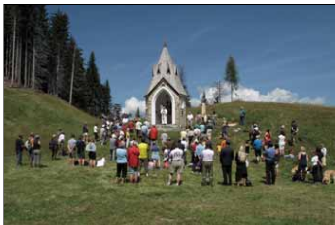
Gottesdienst bei der „Zitakapelle“ auf der Raunaalm bei Wolfsbach (Italien)