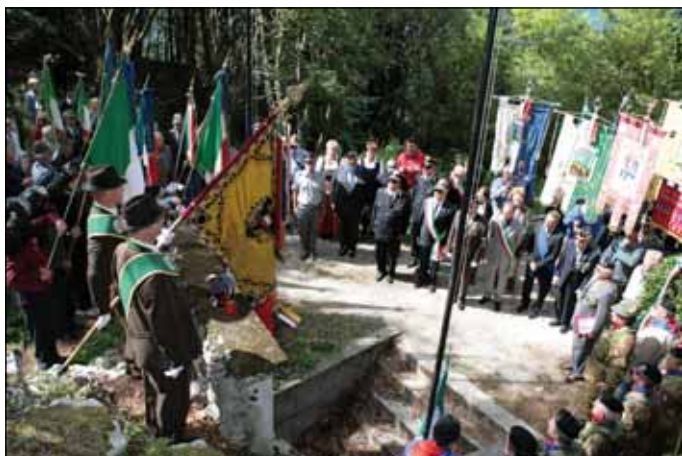
Beim österreichischen Denkmal am Monte Cimone (Italien)

Freiwilligen Schützenpark in Warmbad-Villach übergeben. Gleichzeitig wurde auch die Bezirksfahne für den Bereich Oberkärnten eingeweiht. Auch für den Bereich Unterkärnten wurde nach einer Sammlung durch Kam. Grayer eine eigene Fahne angeschafft und geweiht.