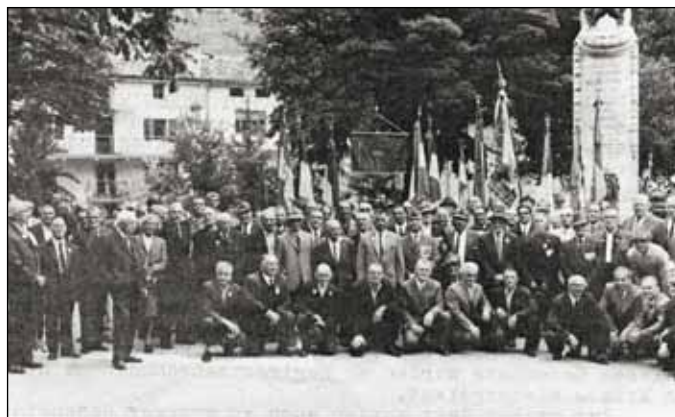
Kameradschaftstreffen in Moggio (Italien)