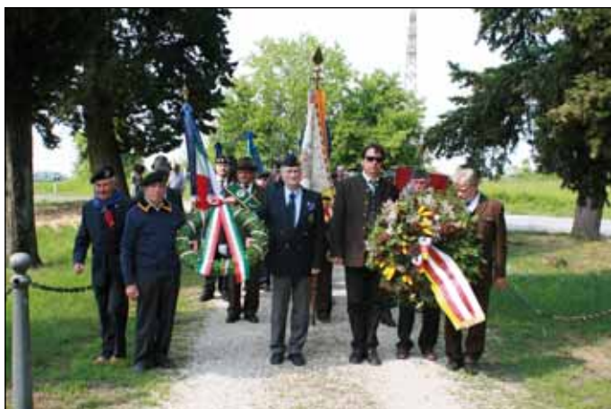
Einmarsch der Abordnungen in Palmanova (Italien)