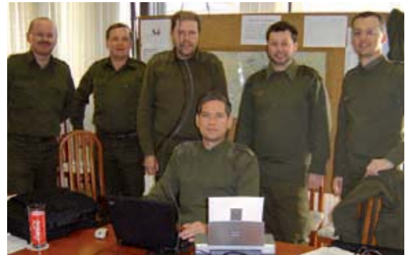
S4 Zelle bei der Stabsarbeit

Auf Anregung des damaligen Bataillonskommandanten Oberst Hans Beschließer nahm ich mich 2004 der Geschichte des Traditionstruppenkörpers Infanterieregiment 11 an. Bei der historischen Spurensuche erlebte ich interessante Entdeckungen im Wiener Staatsarchiv und berührende Begegnungen mit hochbetagten Veteranen und Nachkommen ehemaliger „Elfer“. All jenen, die durch Gespräche, Informati-