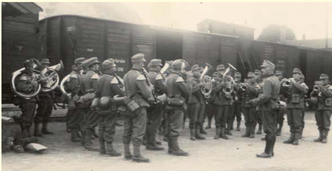
Abb. 5: Abschiedskonzert des Gebirgsjäger-Musikkorps 138 in Leoben, Herbst 1939