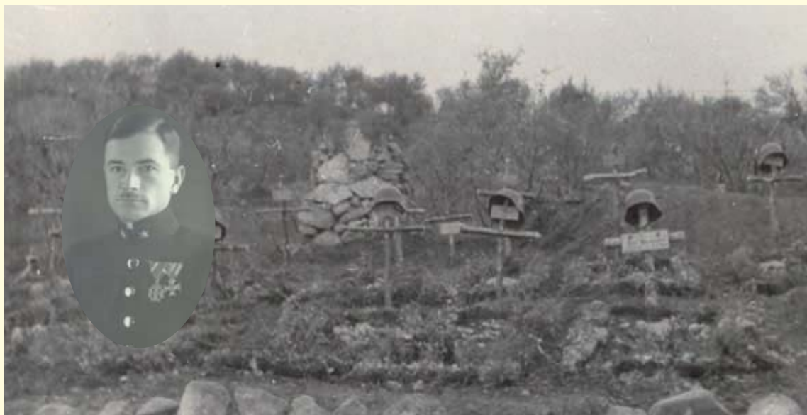
Abb. 6: Grab des Hptm Norbert Hantsch (3. Kp) an der Eismeerfront 1941