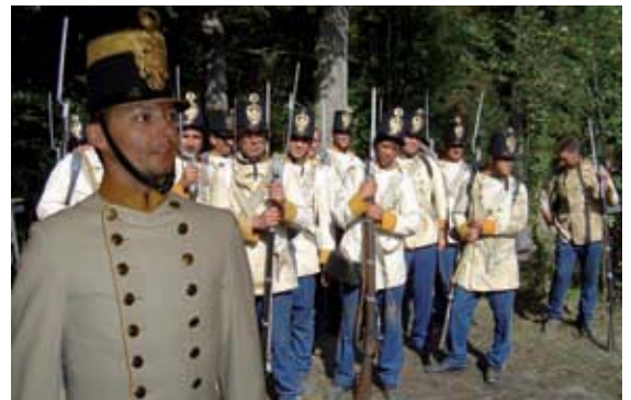
Historical Consulting für die Filmproduktion „Henry Dunant – Red on the Cross“, Radkersburg 2005

onen, Bilder und persönliche Anteilnahme zur Vervollständigung dieses militärgeschichtlichen Puzzles beigetragen haben, sei an dieser Stelle aufrichtig gedankt.