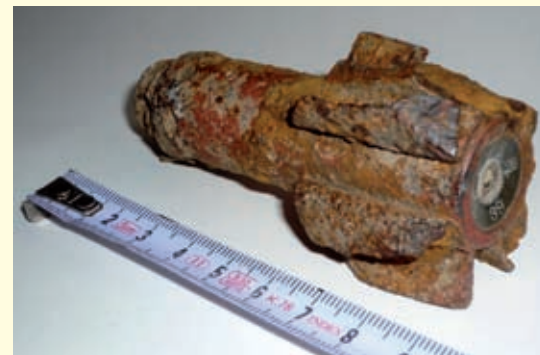
Abb. 4: Spuren...