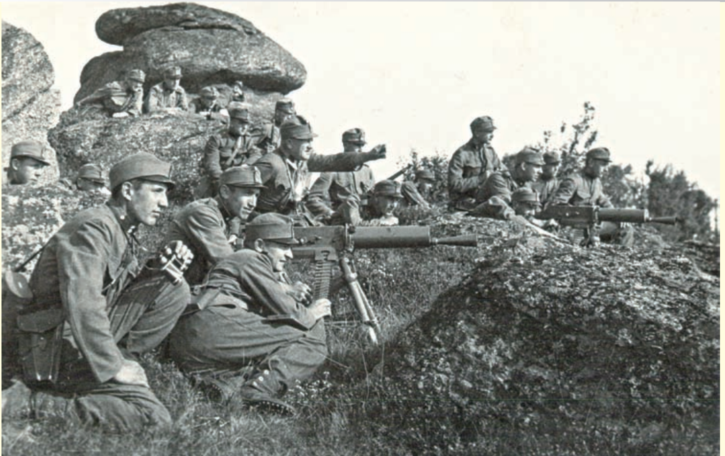
Abb. 2: Feuerstellung der MG-Kompanie I/11 (Manöver 1937)