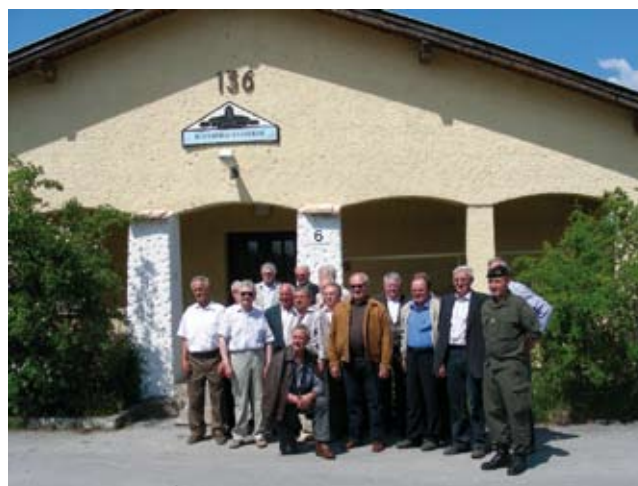
Ehemalige Bataillonsangehörige vor dem Block der damaligen Stabskompanie

Am 13. Mai 2008 besuchten uns ehemalige Bataillonsangehörige, welche in den Jahren 1958 - 1959 ihren Grundwehrdienst in Großmittel ableisteten. Dieser Besuch wurde unter anderem von unseren pensionierten Unteroffizieren mitorganisiert. Ein Großteil dieser Pensionisten sahen die Kaserne das letzte Mal vor 50 Jahren. Gezeigt wurde ihnen die Infrastruktur (welche sich seit damals nur wenig änderte) und die Fahrzeuge, welche heute im Dienst stehen. Natürlich wurden auch Geschichten von damals erzählt. Auch zahlreiches Bildmaterial, z.B. über den Bau der Garnisonskirche, wurden an das Bataillon übergeben und archiviert.