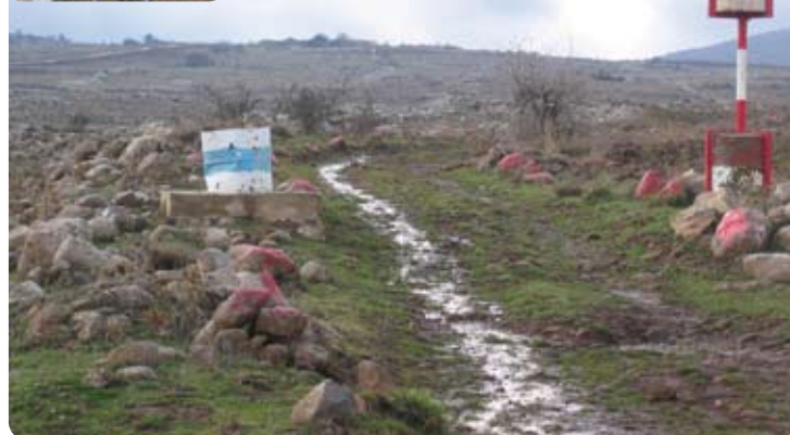
Minen - der ständige Wegbegleiter der UN-Soldaten am Golan

Dienstbetrieb vorkommen, z.B.: Fuß- und motorisierte Patrouille, Dienst am UN-Stützpunkt (Position) sowie rasches Reagieren als EGG (Eingreifgruppe).