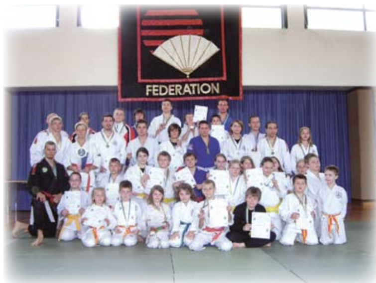
Erfolgreiches Grappling Team - bestes Team in NÖ bei Landesmeisterschaften