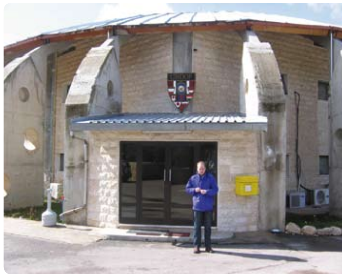
Besuch im Hauptquartier und am Kompaniegefechtstand der 2.

Das Kontingent selbst gliedert sich in Schlüsselpersonal (alle Kom-