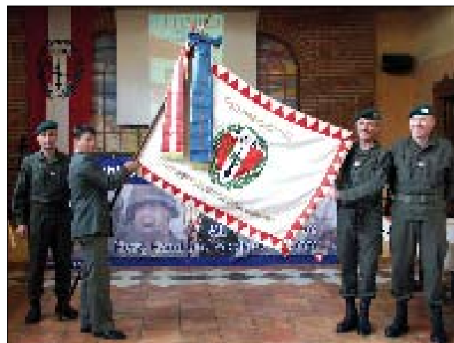
Fahnenrapp des JgB19 mit der Fahne der ÖUOG