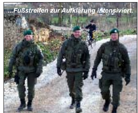
...Fußstreifen zur Aufklärung intensiviert.

Verantwortungsbereich befinden sich vier kleine Enklaven, die es zu schützen gilt. Die Stimmung und Moral der Truppe ist gut. Als Abwechslung gibt es Satellitenfernsehen inklusive österreichischer Sender, DVD-Abende im Betreuungszelt, Sport eingeschränkt und natürlich die vorzügliche französische Küche. Untergebracht sind alle Soldaten in sogenannten Corimecs (Container) der französischen Armee. Durch die angespannte Lage im Einsatzraum wurde der Einsatz bis Anfang Juni verlängert. Die Soldaten des JgB19 machen einen hervorragenden Job und halten sich an den