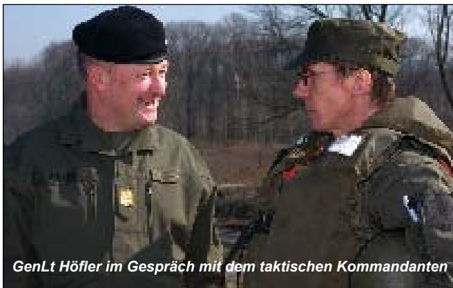
GenLt Höfler im Gespräch mit dem taktischen Kommandanten