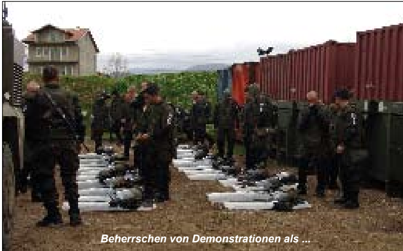
Beherrschen von Demonstrationen als ...