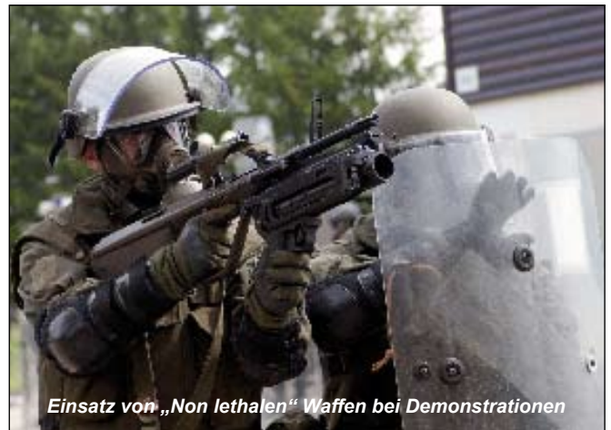
Einsatz von „Non lethalen“ Waffen bei Demonstrationen