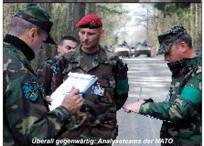
Überall gegenwärtig: Analyseteams der NATO