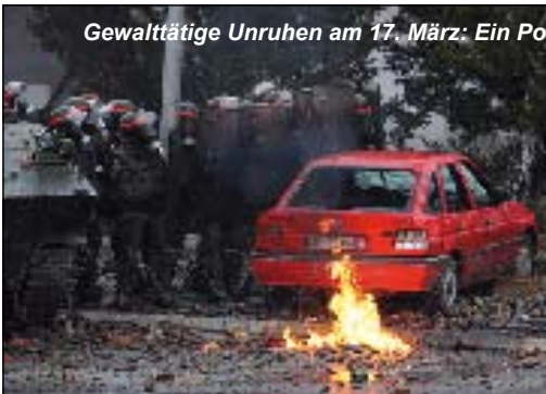
Gewalttätige Unruhen am 17. März: Ein Polizist getötet, mehrere Soldaten verletzt . Deshalb wurden zum Schutz der Enklaven rund um Mi

sich die Situation grundlegend ändern. Es war dies der Gedenktag der Unabhängigkeitserklärung des Kosovos, sowie der Jahrestag der Märzunruhen von 2004. Dieses Datum war für serbische Bewohner Anlass genug, um nach Besetzung des Gerichtsgebäudes in Mitrovica eine Massendemonstration zu initiieren, die ausser Kontrolle geries. Das dort eingesetzte KFOR-Kontingent und die UNMIK-Polizisten wurden nur nach Einsatz aller zur Verfügung stehenden Mittel (CRC-Einsatz, Tränengas, Scharfschützeinsatz) Herr der Lage. Bei diesen Ausschreitungen wurden seitens der serbischen Bevölke-