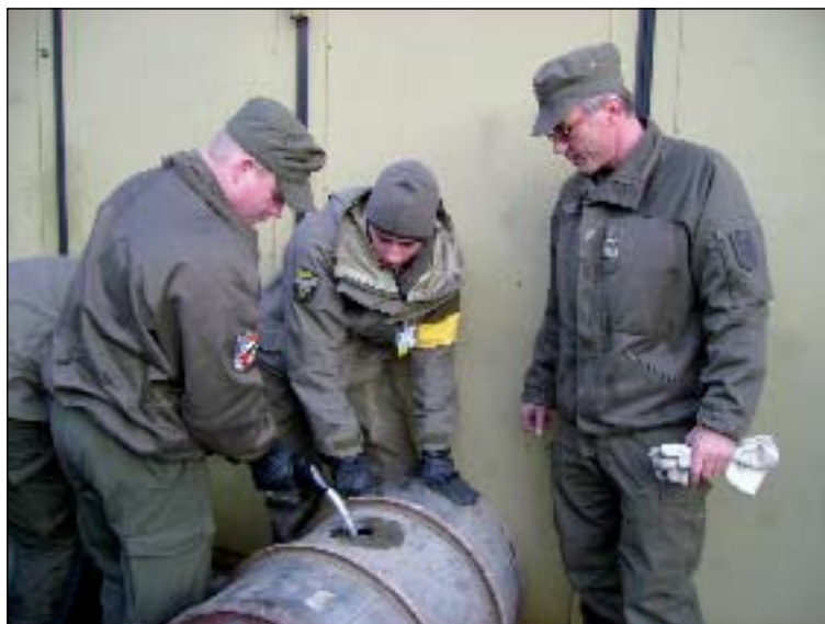
Die Versorgung mit Betriebsmittel durch den VersZg/KPE

Der Versorgungszug der Kaderpräsenzeinheit (VersZg/KPE) wurde vom 7. bis 11. April in St. Michael in Obersteiermark mit weiteren Teilen zur Task Force 18 zusammengeführt. Die Task Force 18 bereitete sich für die PACEMAKER 08 vor. Zuständig für die Realversorgung führten wir Versorgungstransporte in Richtung Allentsteig durch. Am Sonntag, dem 13. April, begann um 2200 Uhr die Verlegung ins Übungsge- lände. Während der zwei Wochen wurde unter einsatznahen Bedingungen die Ver- sorgung der gesamten Task Force 18 durch- geführt. Der VersZg wurde personell und materiell durch einen Tankwagentrupp, so- wie „örtliche Arbeiter“