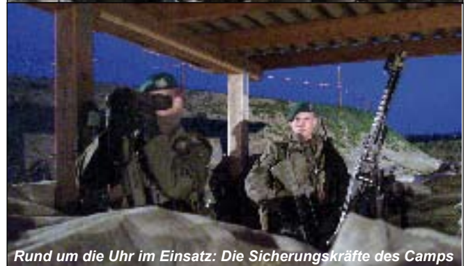
Rund um die Uhr im Einsatz: Die Sicherheitskräfte des Camps