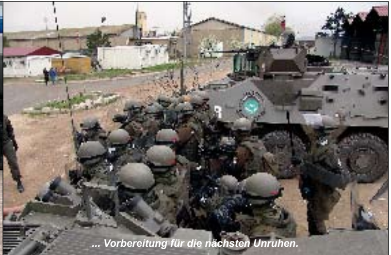
... Vorbereitung für die nächsten Unruhen.

und des stellvertretenden Kommandanten General Stelz rundeten die ersten Wochen ab. Unsere Soldaten sind hauptsächlich im Bereich um das Field-camp Plana und der Stadt Vushtri eingesetzt. Im