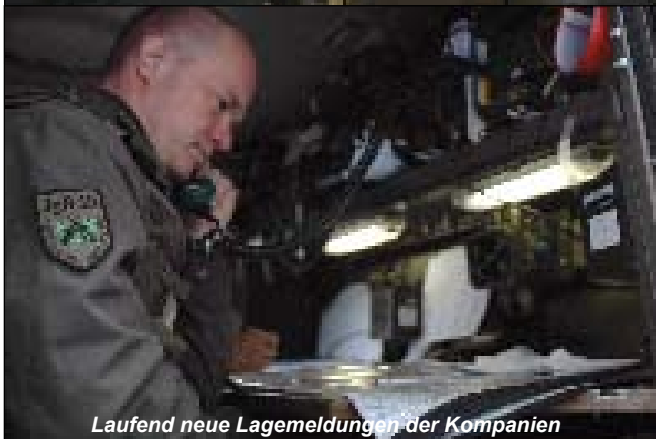
Laufend neue Lagemeldungen der Kompanien