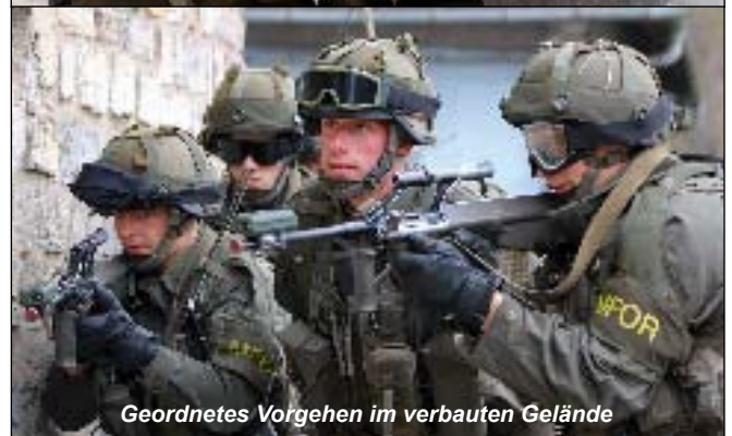
Geordnetes Vorgehen im verbauten Gelände