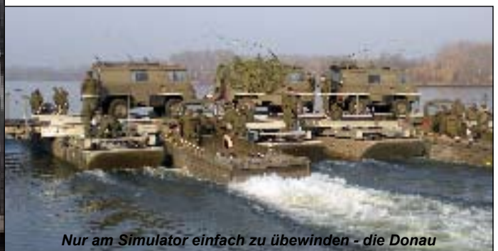
Nur am Simulator einfach zu überwinden - die Donau

Dieser Name steht für die Verknüpfung des Führungsverfahrens auf Bataillonsebene mit den Führungssimulatoren auf Kompanieebene. Hierbei war die bewegliche Befehlsstelle Bataillon real im Gelände unterwegs und die Kompaniekommandanten an den taktischen Arbeitsplätzen, den Simulatoren eingesetzt. Die eigentlich beübte Ebene war hier das Bataillonskommando. Es zeigte sich wieder einmal wie sehr das Bataillon von der Qualität der Lagemeldungen der Kompanien abhängig ist. Durch geschickte Positionswahl der beweglichen Befehlsstelle konnte über die sehr große Entfernung (60 km) jederzeit die Verbindung im Bataillon aufrecht erhalten werden. Den eingesetzten Kompanien gelang es alle Aufträge im Sinne des Bataillons zu erfüllen.