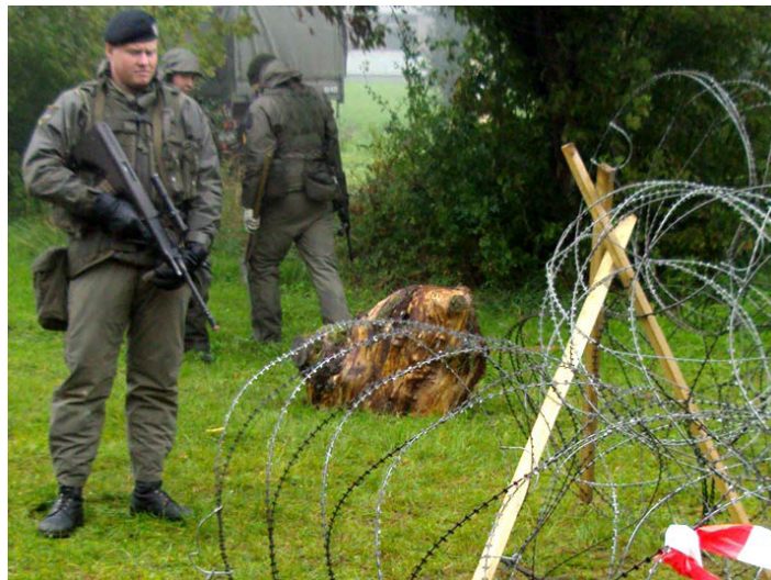
Mit Schnellsperren riegeln Sicherungskräfte den Untersuchungsort ab und ermöglichen den Tatortspezialisten ein ungestörtes Arbeiten

Die Grundstruktur dabei bil- den zwei Sicherungszüge. Sie sollen den Ort des Geschehens