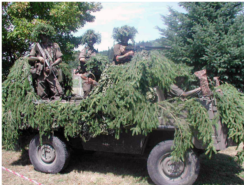
Aufklärungskräfte operieren den Kampftruppen vorgestaffelt und sind die Ersten, die Informationen über gegnerische Kräfte und deren Aktivitäten liefern

Die durch Beobachtung und Luftaufklärung entstandenen Lagebilder wurden an die eingesetzte bewegliche Befehlsstelle gemeldet und von dieser sofort ausgewertet. In weiterer Folge konnte durch präzise Aufklärungsergebnisse die geplante Feuerunterstützung optimal koordiniert und gesteuert werden. Für die Informationsweitergabe war der S2-Kreis verantwortlich, welcher die gemeldeten Feindteile direkt übermittelte, wo diese sofort bearbeitet und bewertet werden konnten.