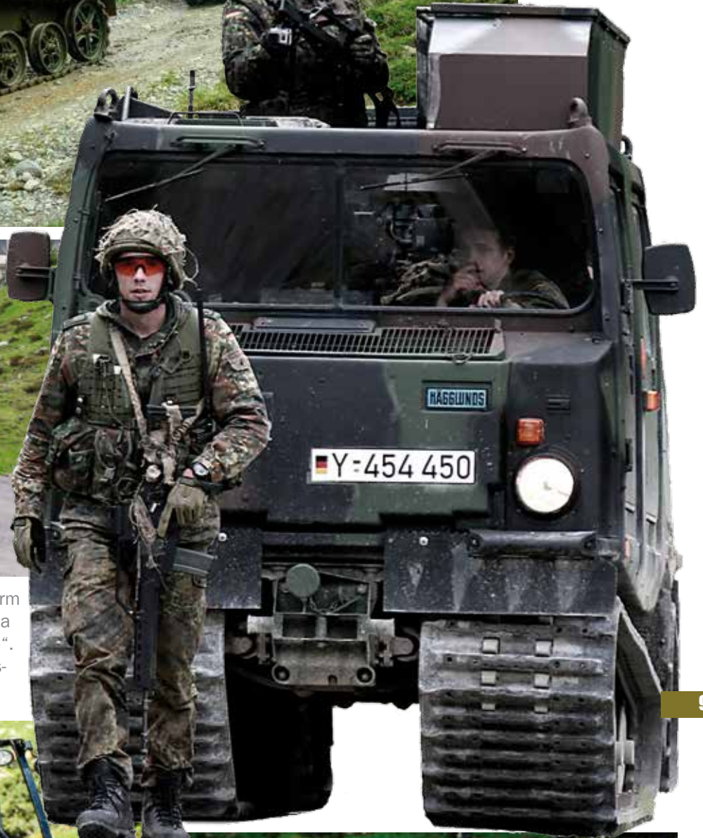
o. Wiesel 1 MK 20, Kettenfahrzeugplattform (Rheinmetall), Radschützenpanzer Piranha III (Mowag) „Schweizermesser auf Rädern“. re. BV206D „Husky“ (Hägglund) Führungsfahrzeug.