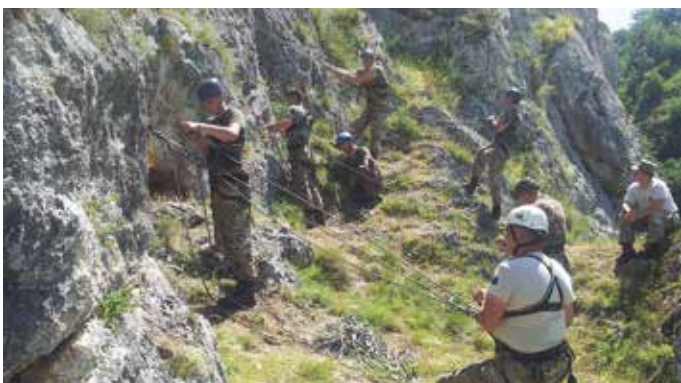
Klettergarten Pljevlja. Die Ausläufer des Dinarischen Gebirges, bis zu 2.500 m Seehöhe.

Montenegro (Црна Гора/Crna Gora) ist eine Republik an der südöstlichen Adriaküste in Südosteuropa. Sie hat gemeinsame Landesgrenzen mit Kroatien, Bosnien und Herzegowina, Serbien, dem Kosovo und Albanien. Nachdem Montenegro nahezu 90 Jahre zu Jugoslawien gehört hatte, wurde es am 3. Juni 2006 erneut unabhängig.