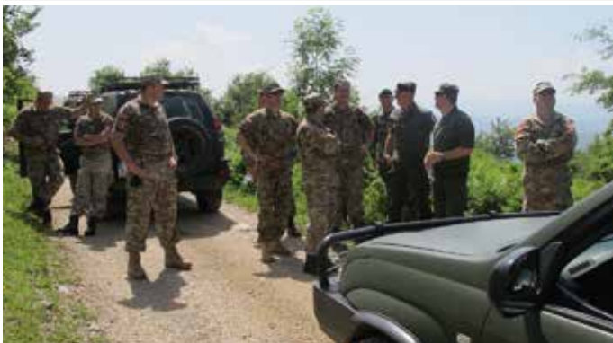
Geländebesprechung auf dem Übungsgelände Kolašin. Übungsteilnehmer aus MNE, MAZ, AUT.