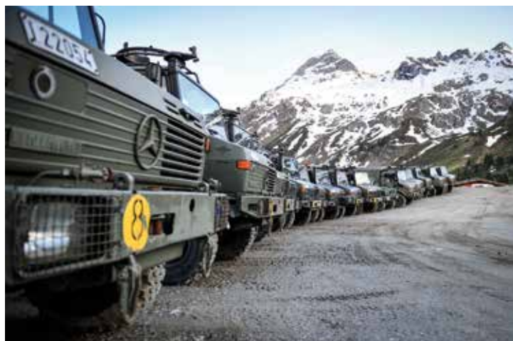
Beeindruckender Aufmarsch in den Tuxer-Alpen. Soldaten aus acht Nationen. Fahrzeuge aus Deutschland, Belgien, Österreich und der Schweiz.