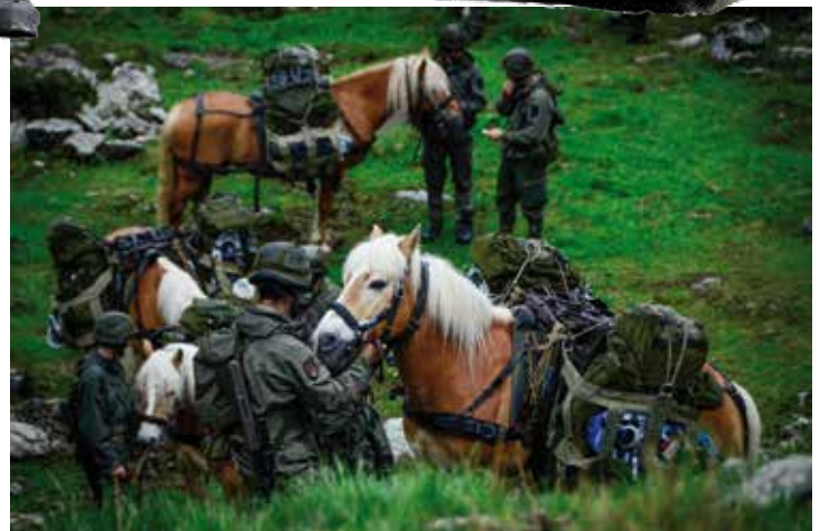
o. Belgisches ULTRALIGHT TACTICAL VEHICLE. re. Tragtiere des Tragtierzentrums Hochfilzen.