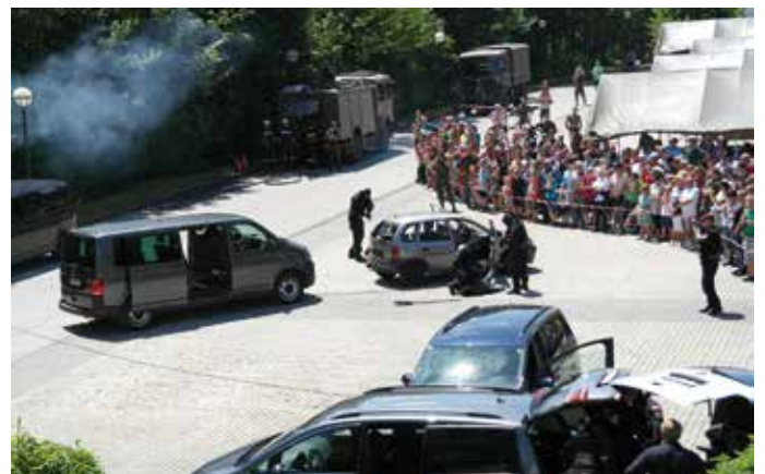
Text: Kurnik