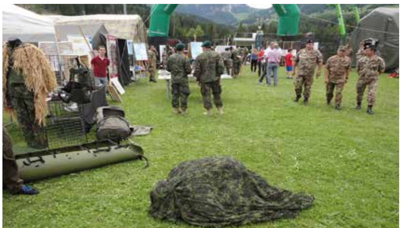
... nach der Übung: Leistungsschau der italienischen Armee.