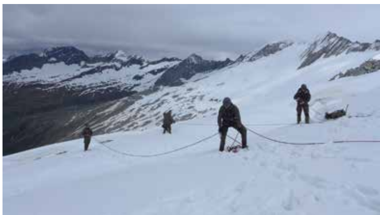
Selbstbergung aus der Gletscherspalte auf 3000m. Orientieren im weglassen und mühsamen Gelände.

ALLE Soldaten: Unterrichte aus Gletscherkunde und Sicherheitstheorie Orientieren im vergletscherten Hochgebirge Anseilarten in der 2er- und 3er Seilschaft sowie mehrere Mann am Seil Gehen im Fels, Schnee und Eis Standplatzbau und Verankerungen im Fels, Schnee und Eis Selbstbergung aus der Gletscherspalte mittels Kurzprusikverfahren und Bergführermethode Kameradenbergung aus der Gletscherspalte mittels Loser Rolle und Selbstseilrolle