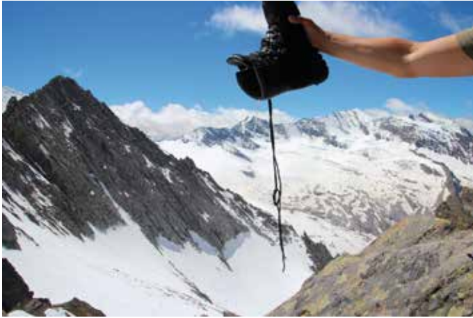
... bis es aus den Stiefeln rinnt ...

HHGS-Anwärter zusätzlich: Führen von Soldaten im Fels, Schnee und Eis Lehrauftritte in den o.a. Themenbereichen