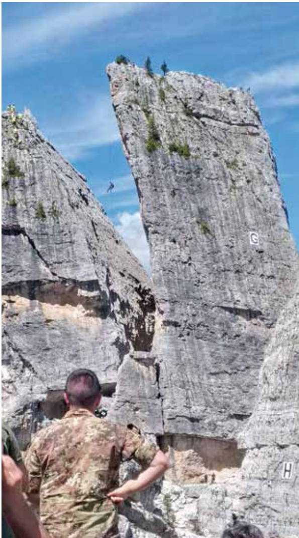
Vorführung des Einmann-Bergeverfahrens durch die 24er Seilschaften.