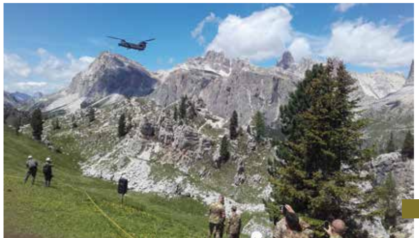
Chinook der ESERCITO ITALIANO über den Dolomiten.